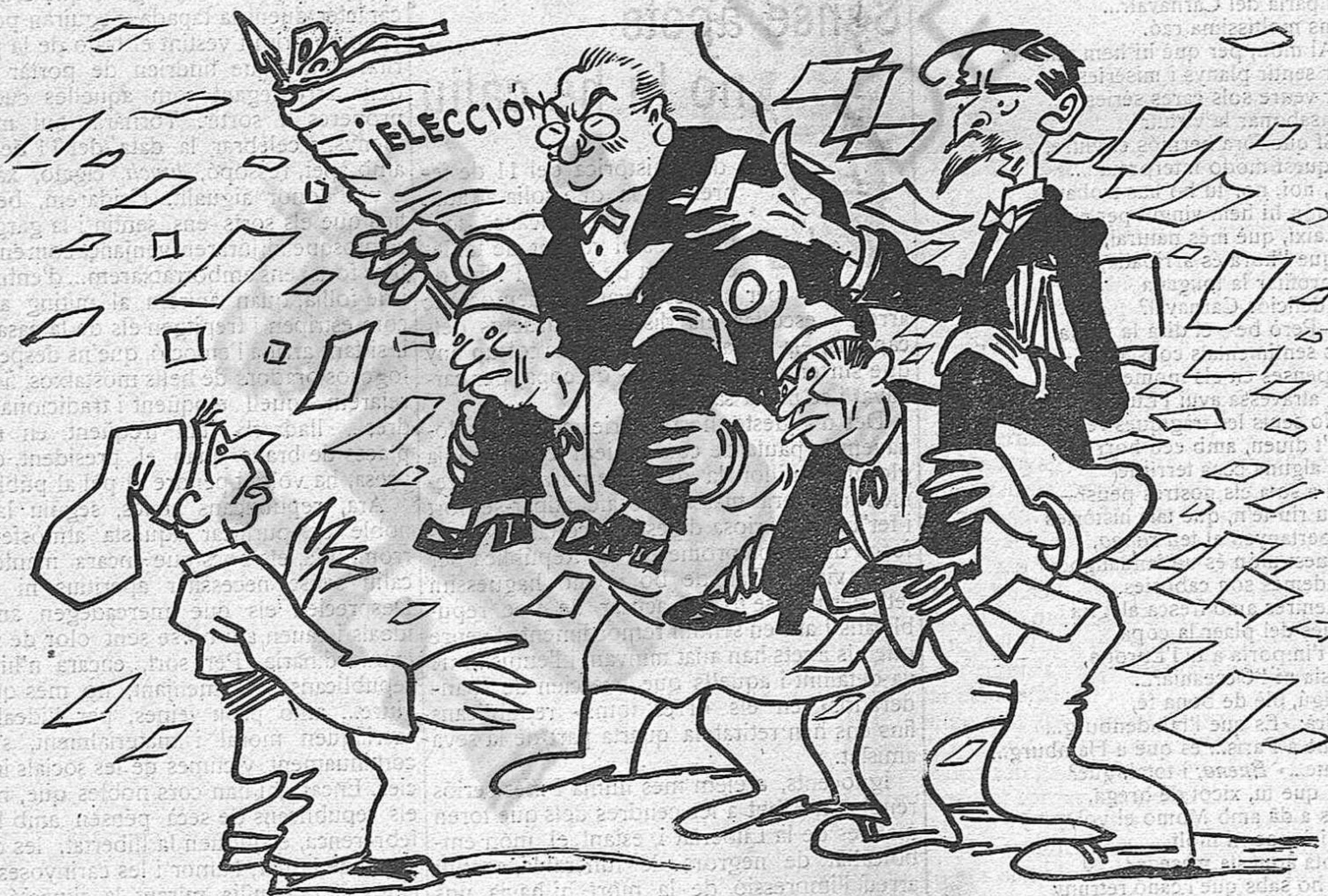
-Que no'ns coneixes?... Som els de sempre... -Doncs no hi veig la «renovació».