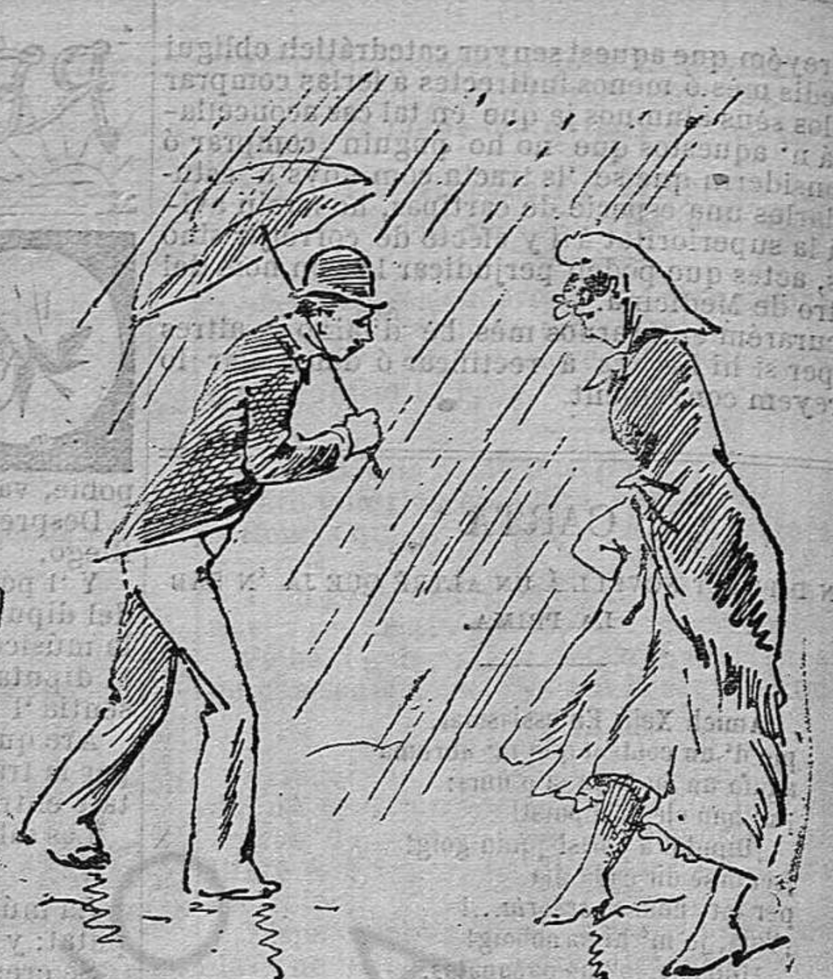
Las plujas han fet mirar molt á terra.