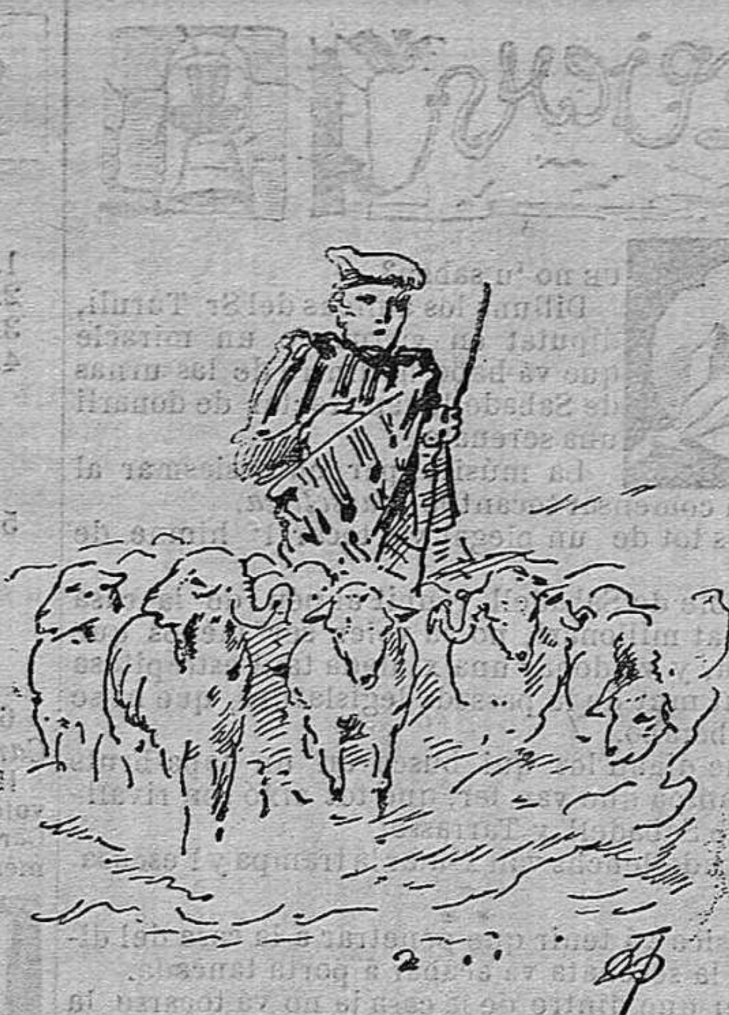
¡Aquestos pelegrins sí qu' han anat al cel en cos y ánima!