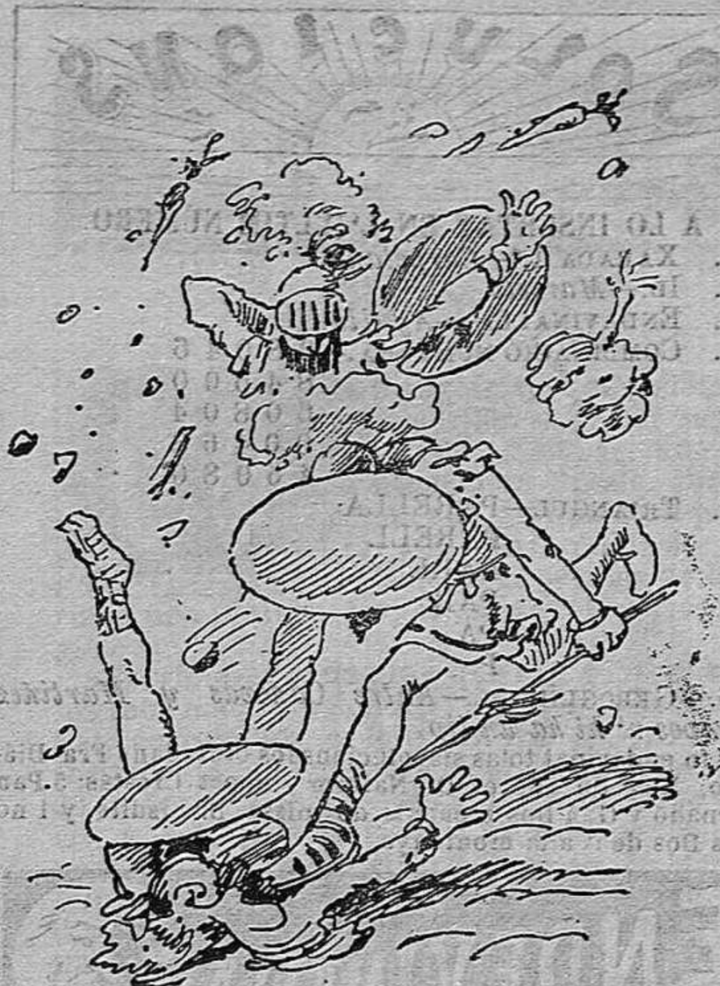
Las profesions s' han celebrat ab tota solemnitat y pompa.