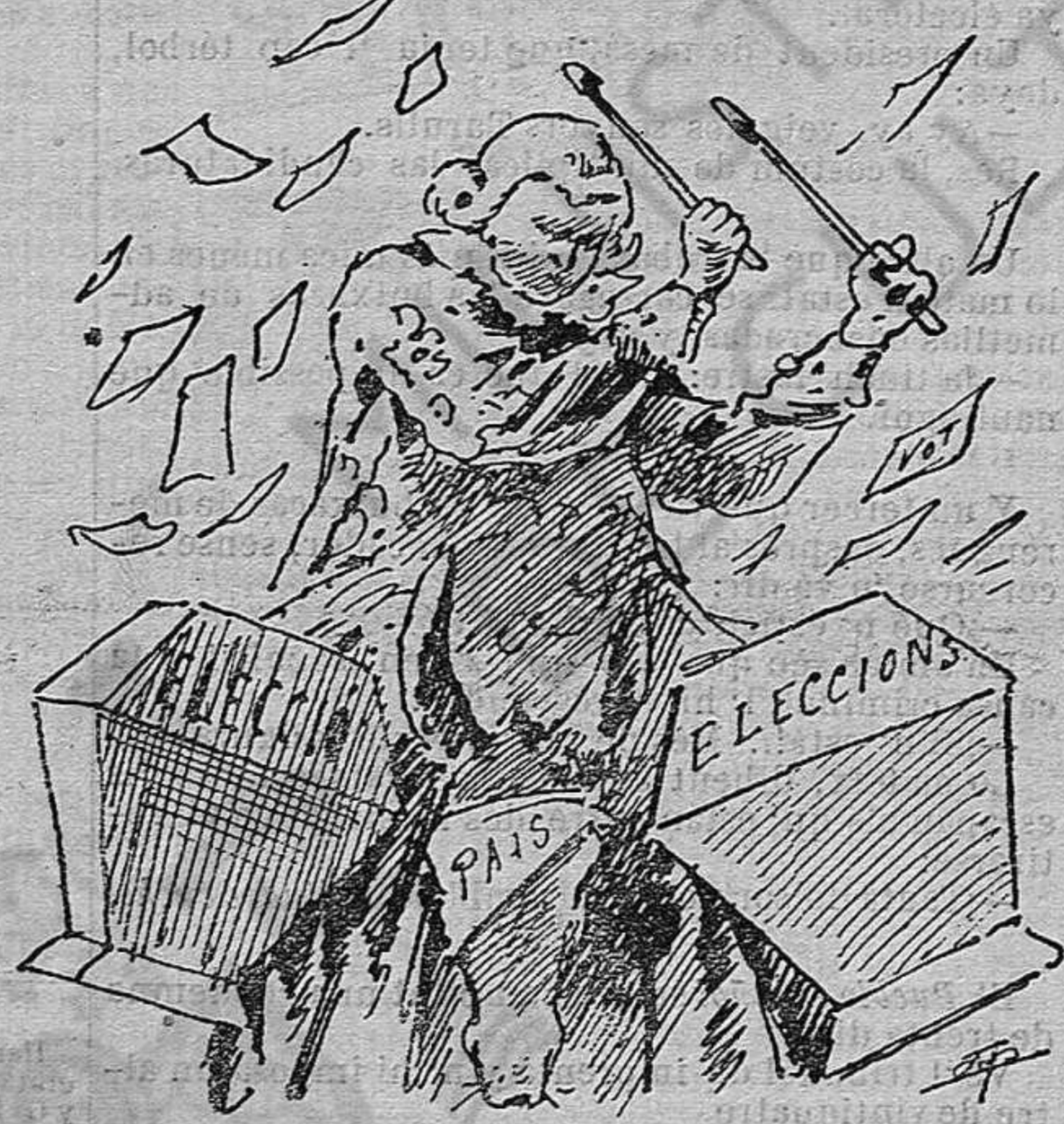
Me sembla que aquest any las trampas han sortit avans d' hora.