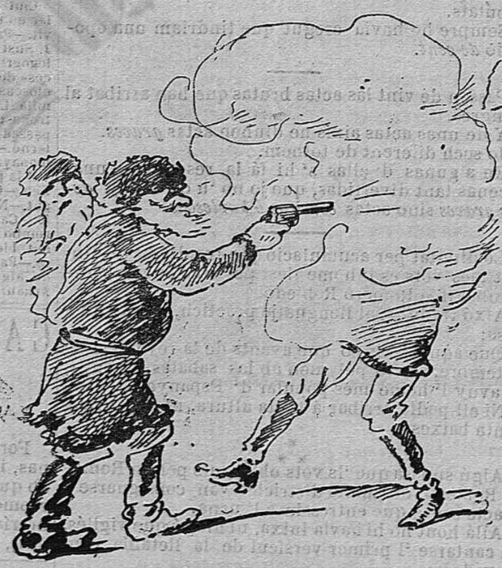
Los Nihilistas han seguit difundint sas teorías.