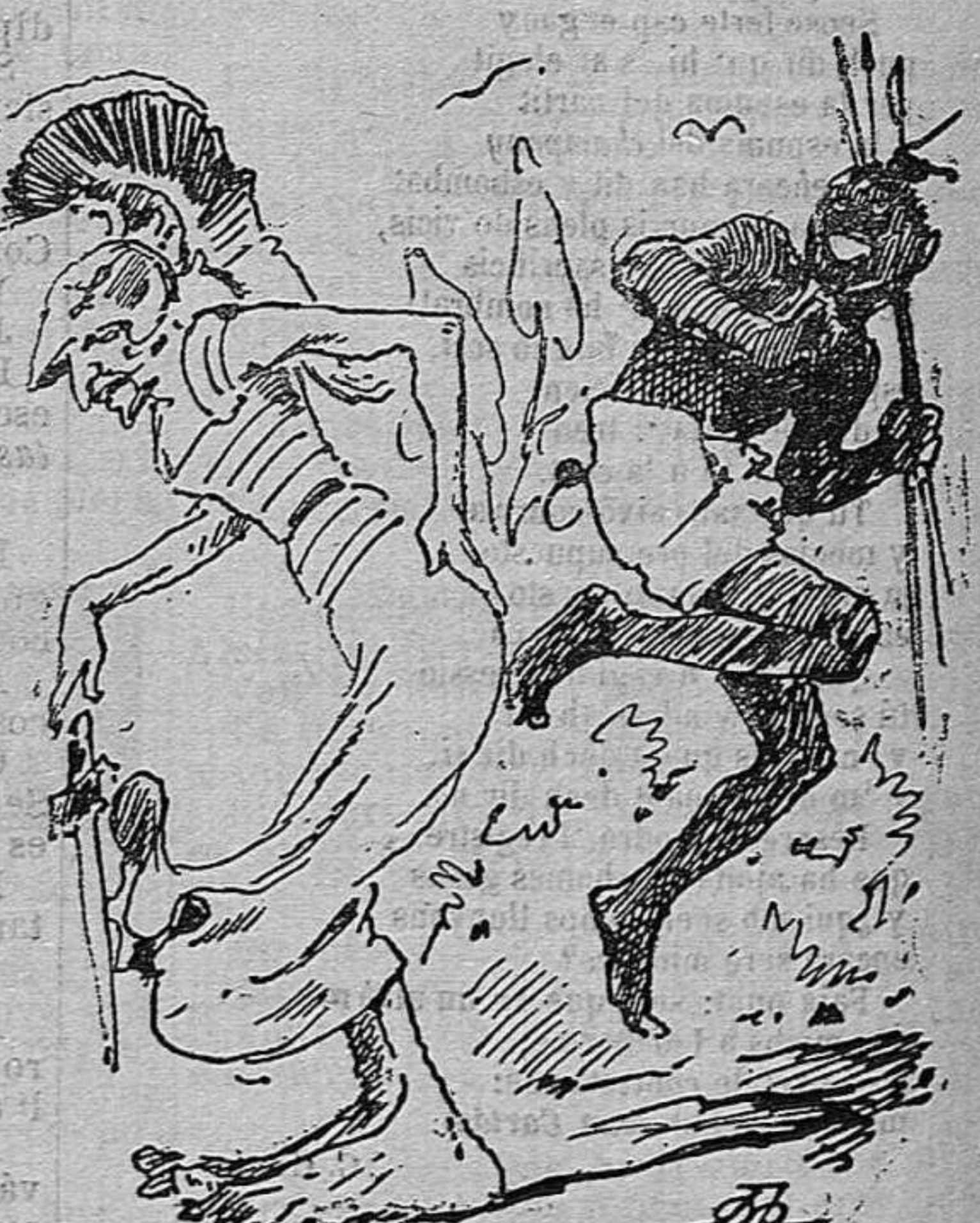
L' Inglaterra ha gastat tots los seus llorens en los estofats que l' hi han donat los Zulús.