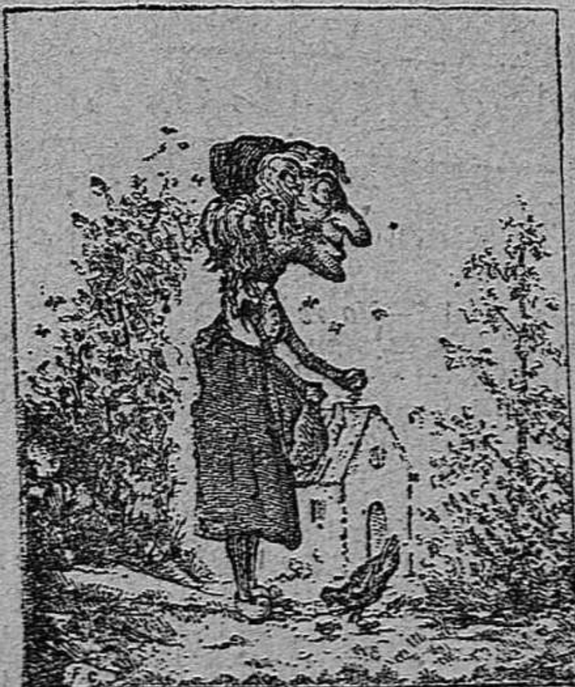
¿Ahont es la seva filla?