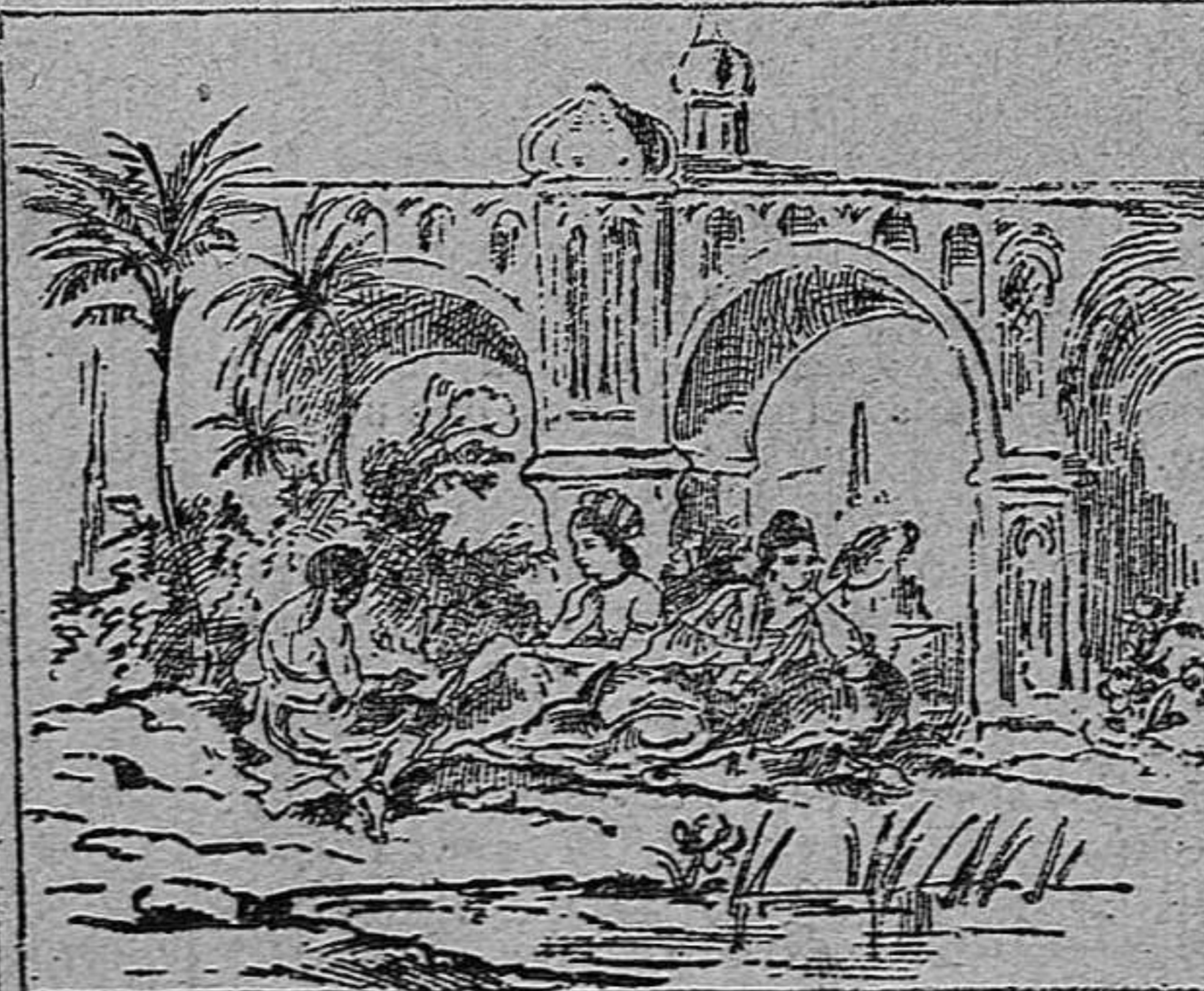
Busqueu al Sultan.