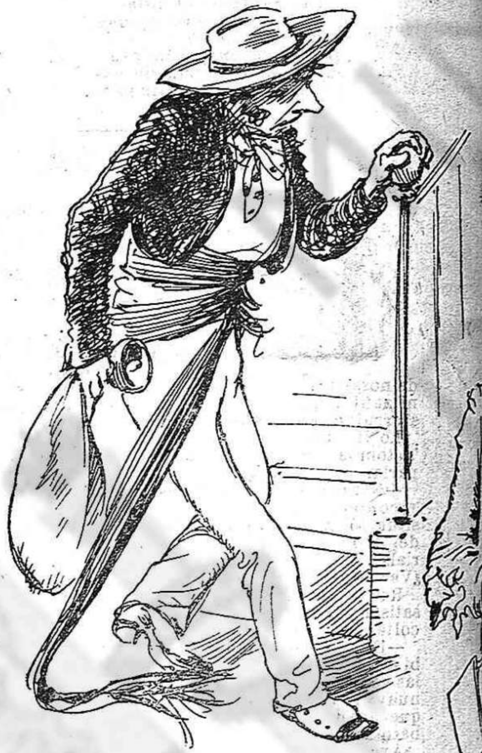
Per... aixó de... la escala alcohólica