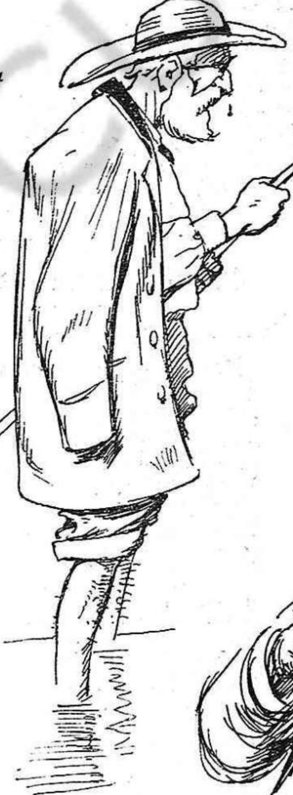
Per questions de marina, res més que de marina