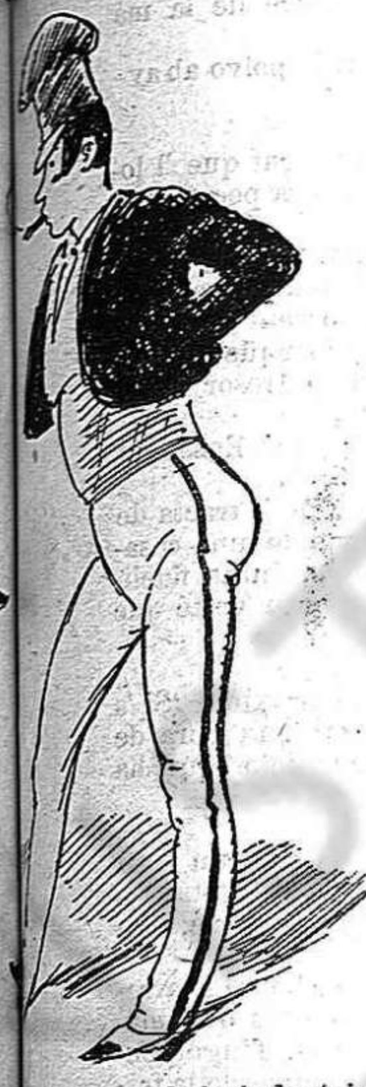
Per certis punts de la industria