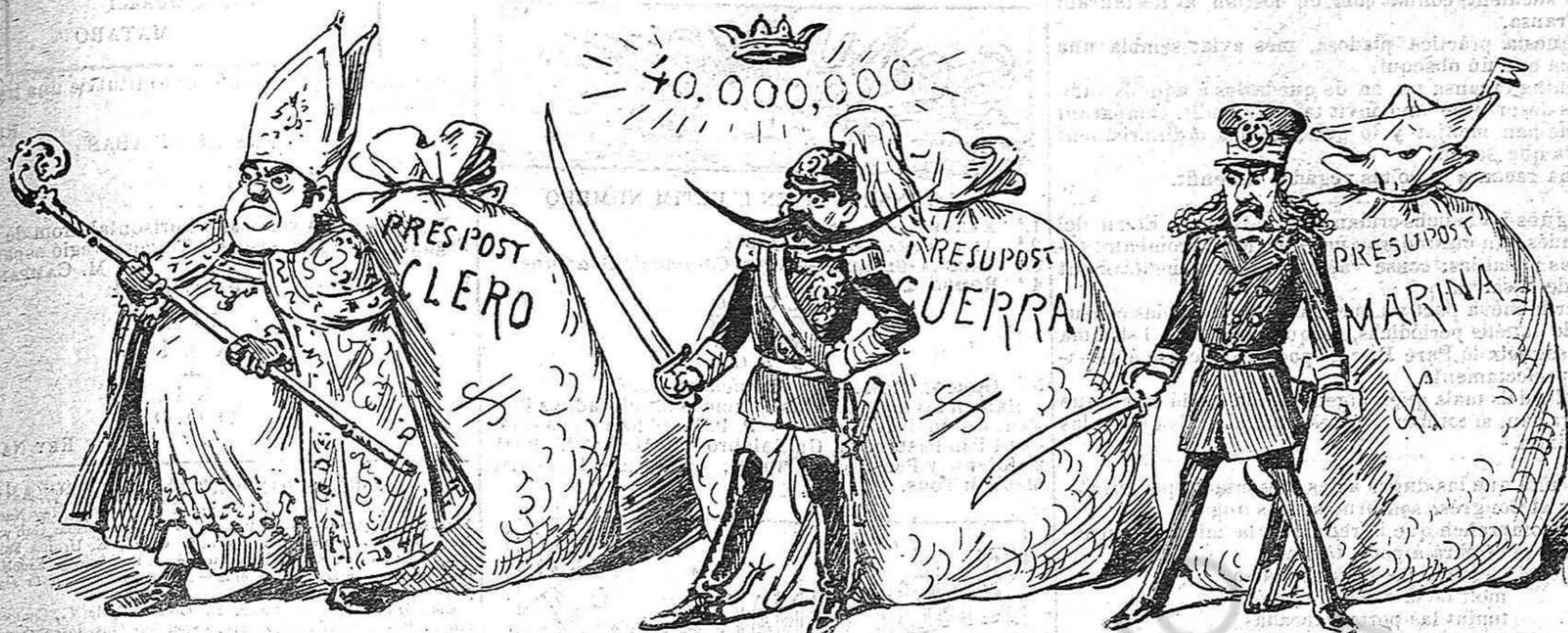
Com que cap dels tres es manco—y fins podrián tornars'hi, — las Corts no 'ls hi dirán res:—¡ja 's guardarán de tocarhi!

damunt de sa veu caurà tot lo pes dels vostres vots. Marxant d' aquesta manera plens de patriòtica fe, jo us juro pel meu tupé que farém molta carrera. Y... prou. He parlat en plata contant ab vostra adhesió: ara aném al menjadó y us servirán xocolata. Es un obsequi frugal que us faig, com ja compendreu, sols perquè saborejéu la teca ministerial.