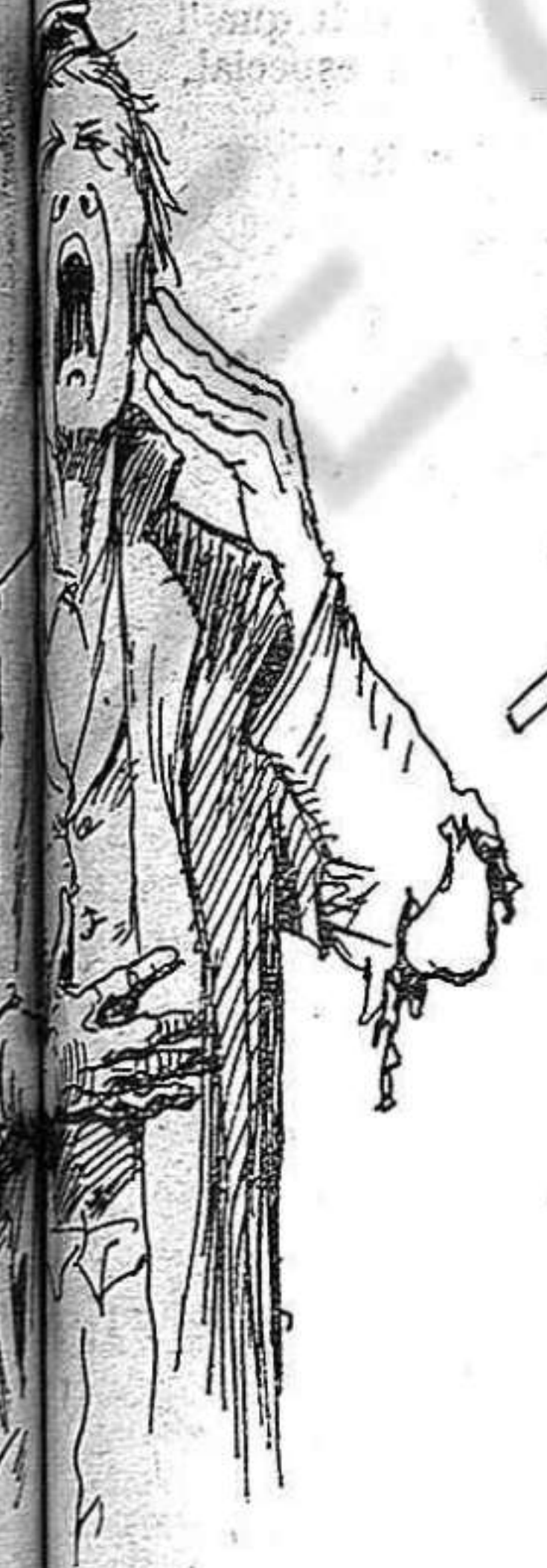
Per l' ensenyansa