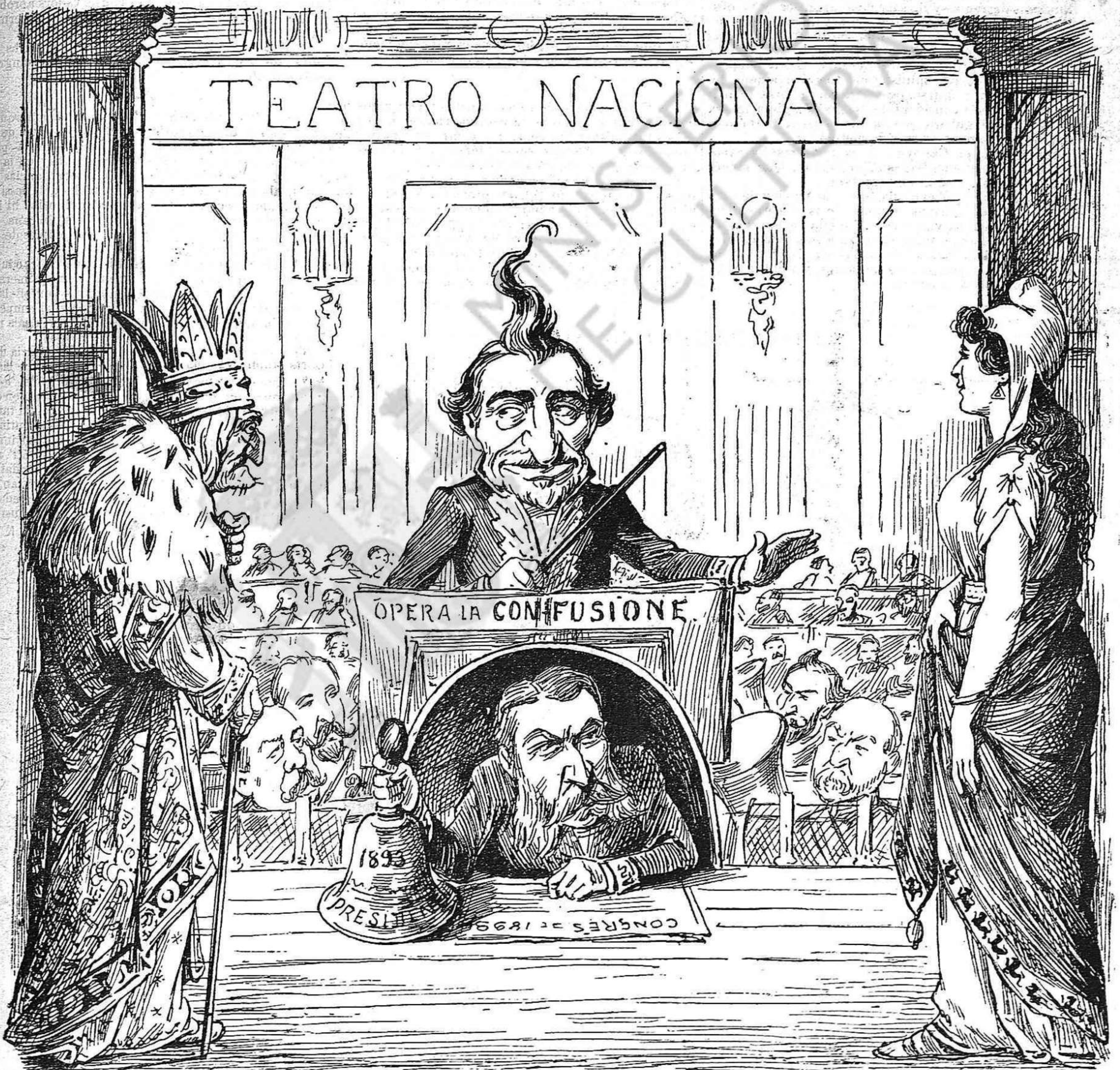
Veyam qui comensará á fer galls, si la contralt ó la tiple