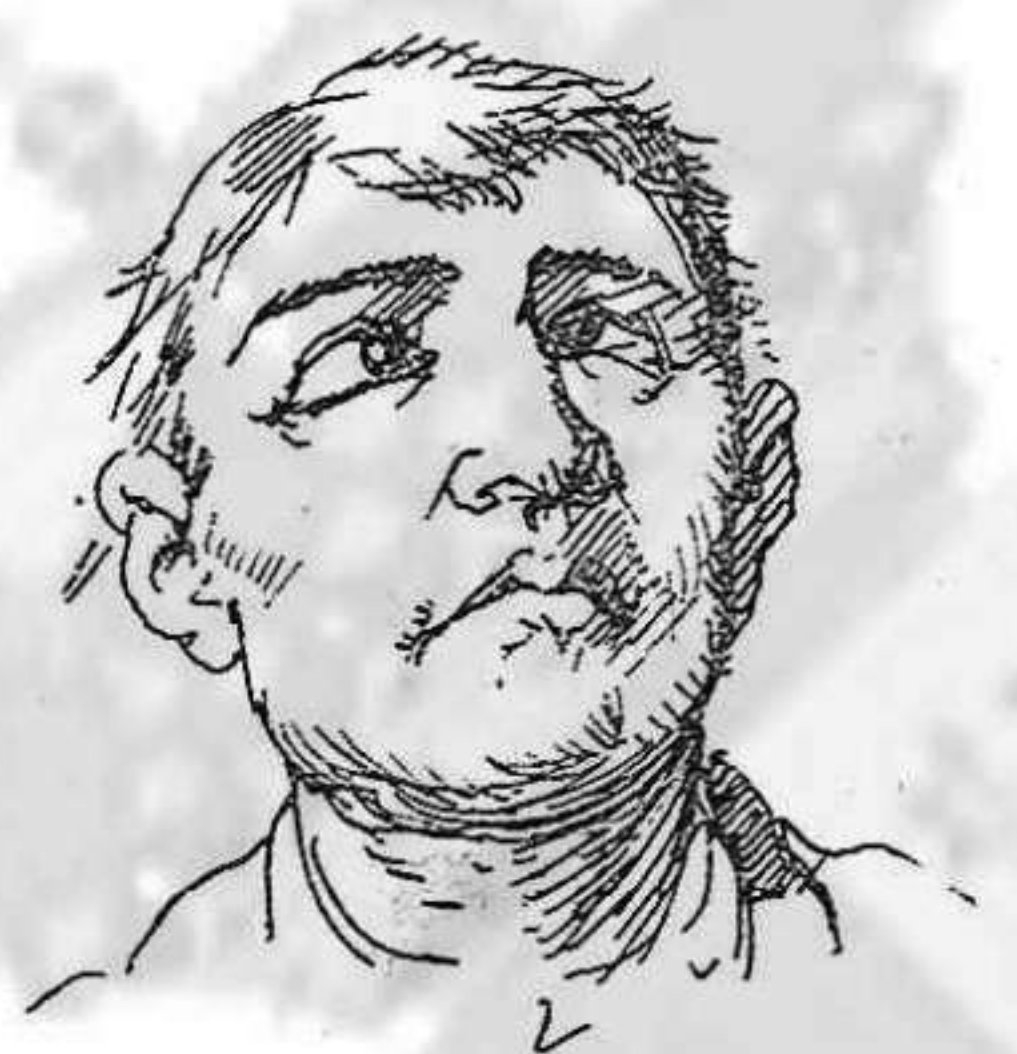
Per dur la contraria al Govern