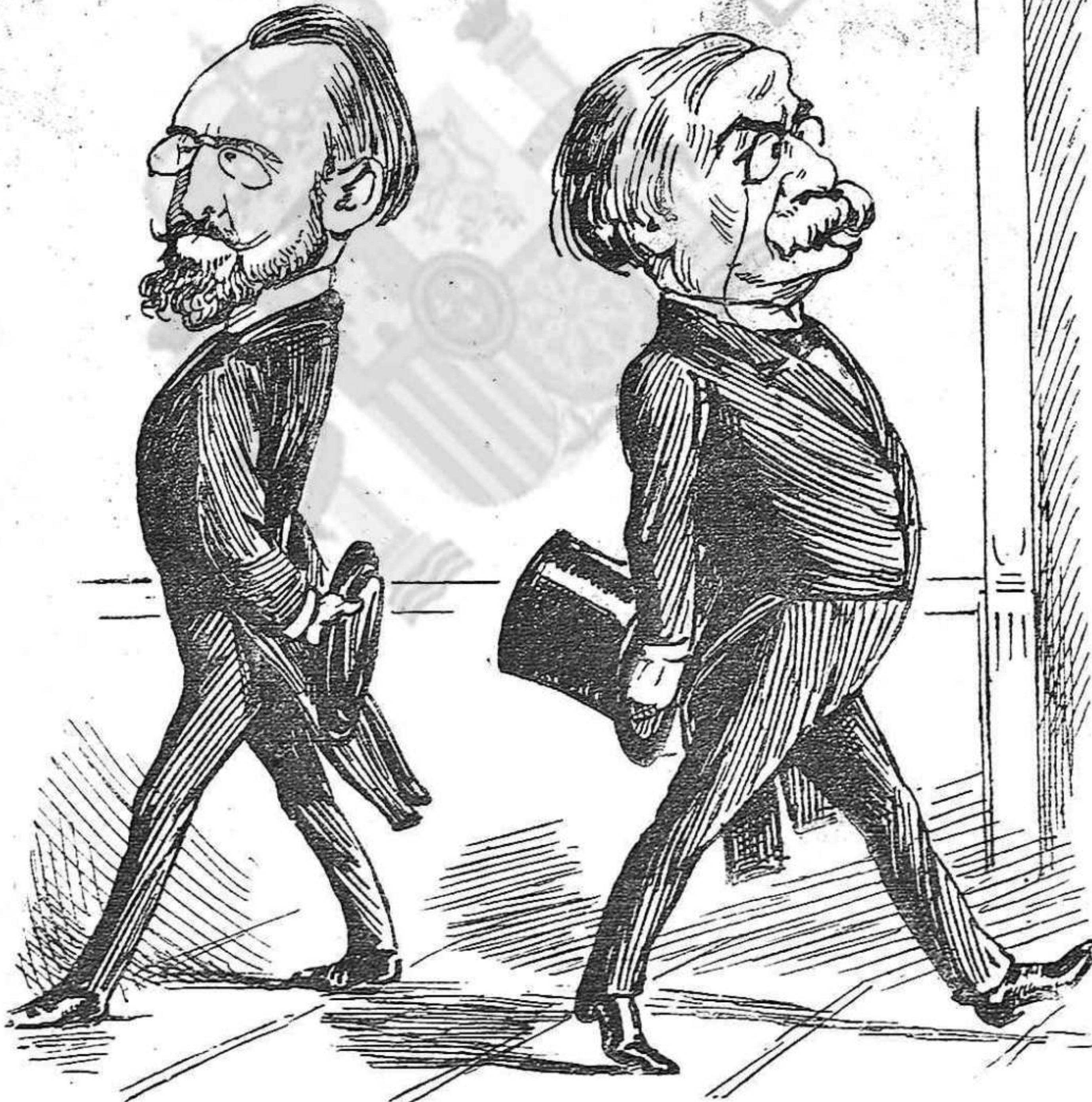
¡Aixís m' ageadan los homes! ¡Aixís tots deurian ser! ¡Si l' un terne, terne l' altre; si l' un tiesso, l' altre més!