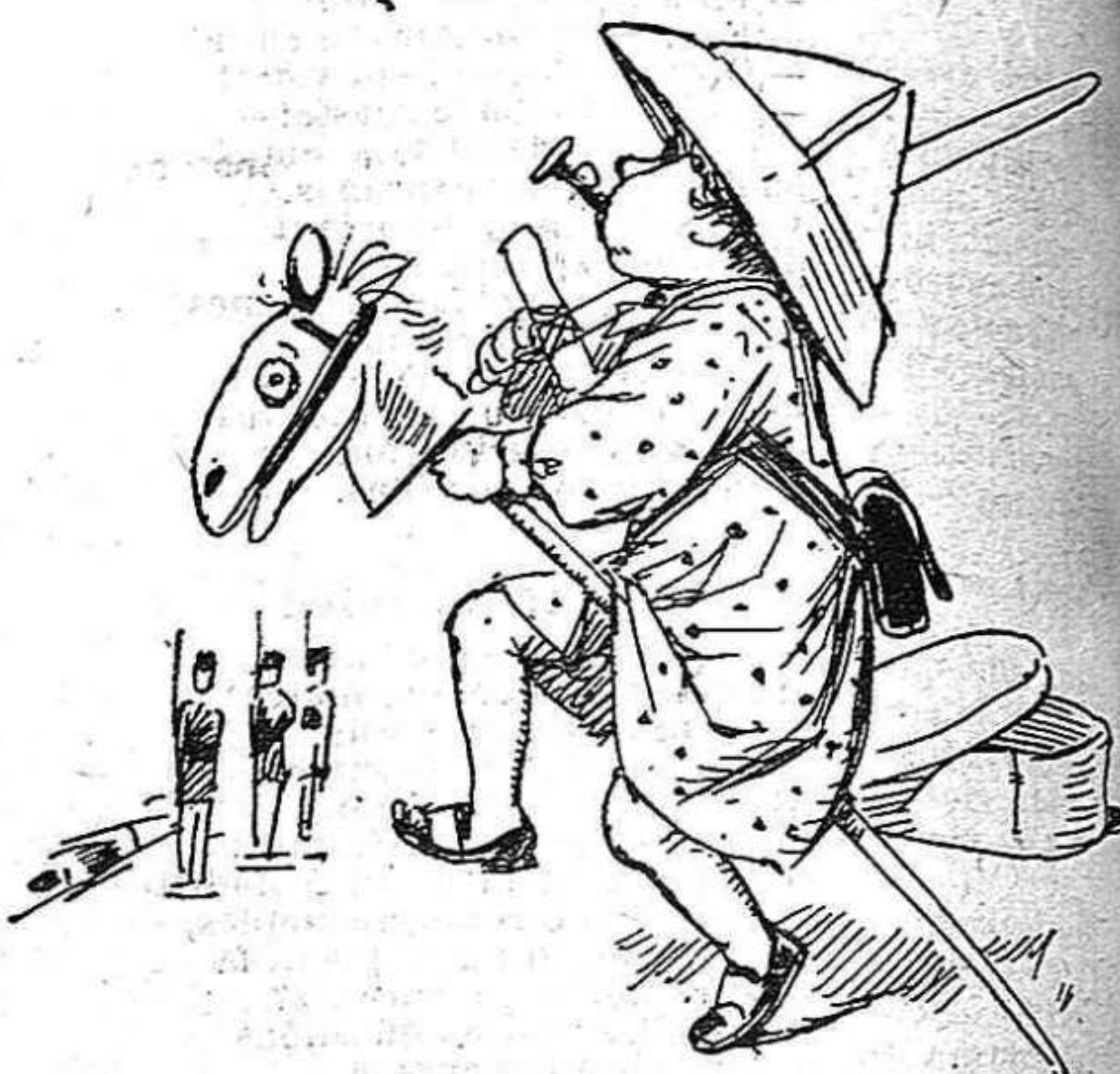
Per rehabilitar lo ram de guerra