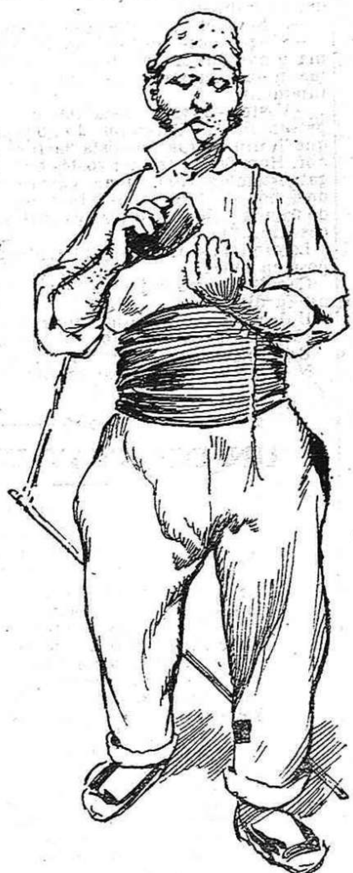
Per extendres sobre las carreteras