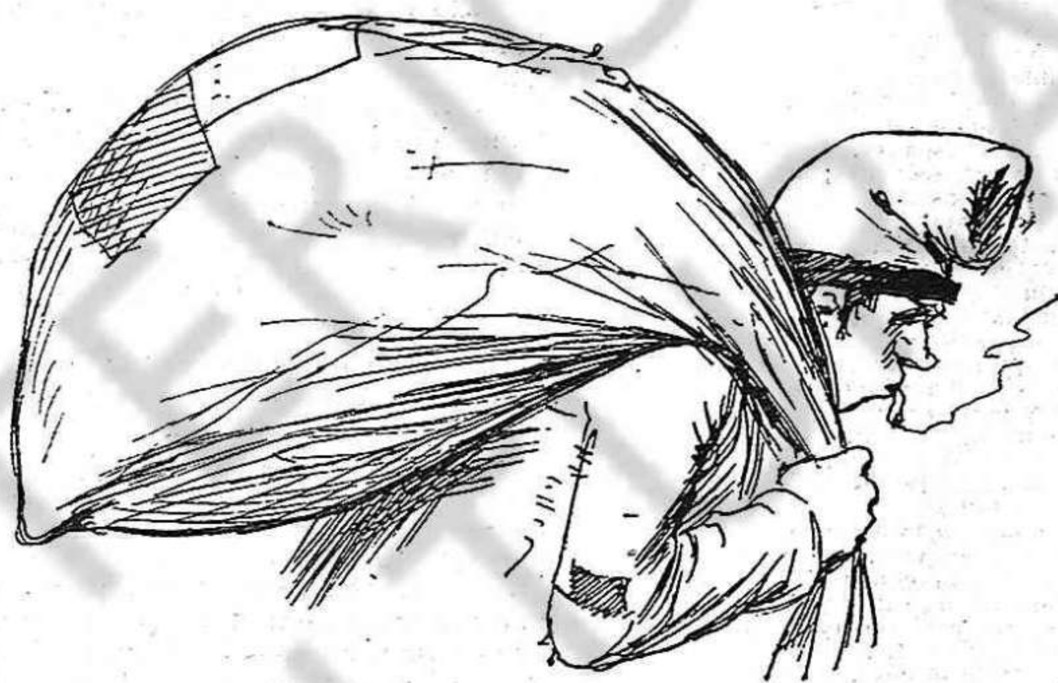
Per descubrir la riqueza oculta