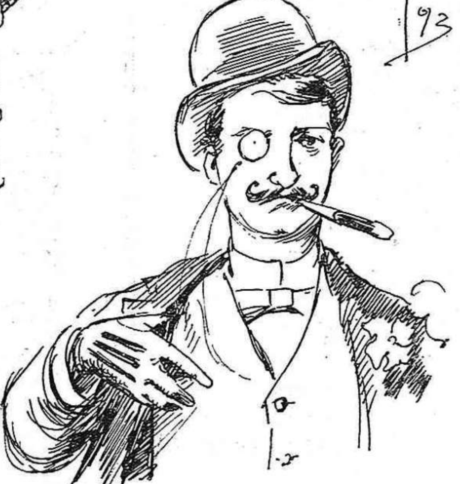
Per fer la guitza als inglesos

Desgraciadament, los governants sembla que més que per la justicia, están per la codicia. Però la codicia romp lo sach.