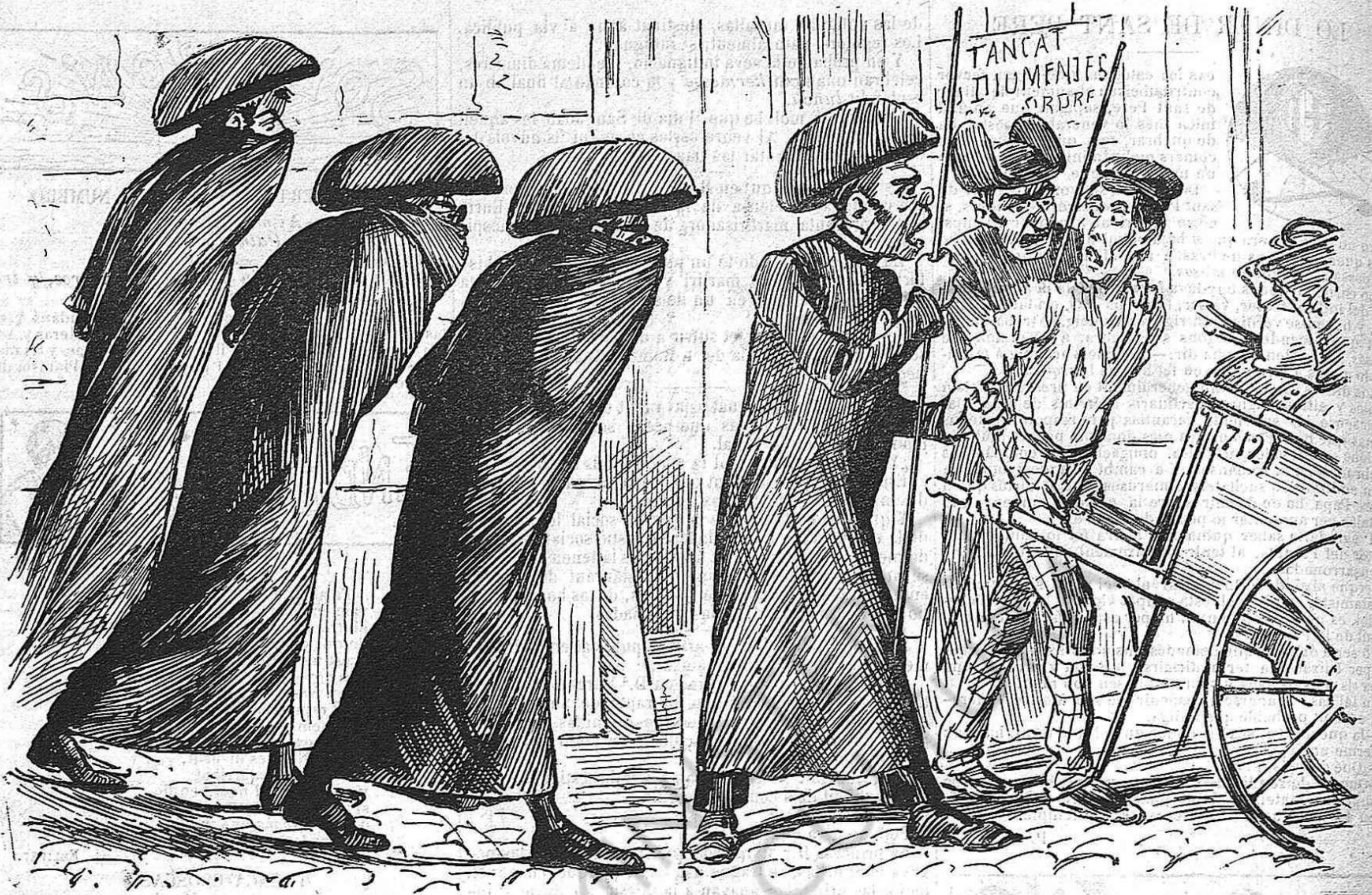
Se montará una policía especial per perseguir als que treballin.