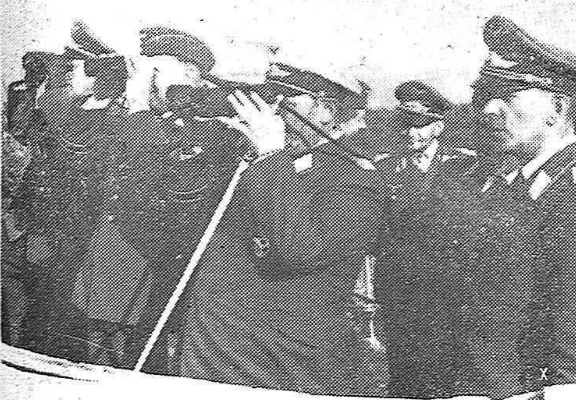
El Mariscal del Reich Hermann Goering dirige personalmente la gran batallita aérea contra Inglaterra. La foto muestra al Mariscal en un puesto de observación de la costa del Canal.