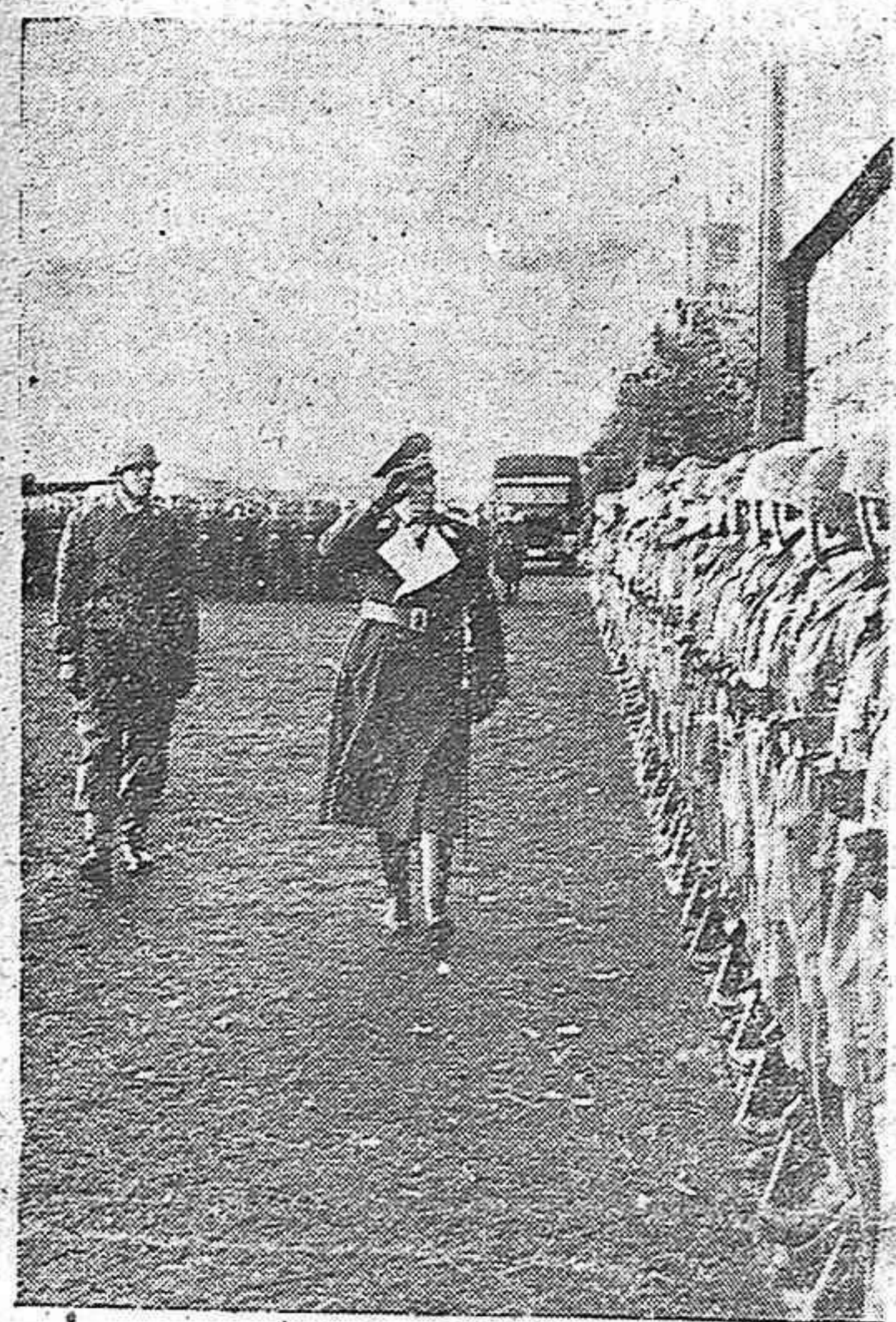
El General de aviación Student, jefe del cuerpo de Paracaidistas alemán, restablecido ya de las heridas que sufrió, revista sus heroicos soldados por primera vez después de terminar las campañas en el Oeste.

Chang-kai-shek no escucha las propuestas de paz de Nankín