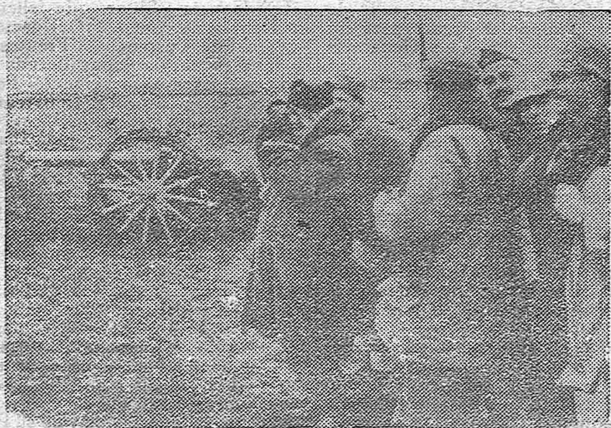
Sobre el terreno preparan la operación nuestros generales, que los bravos soldados de España coronan con éxito superando la exactitud matemática

Pequeños paquetes, 30 cts. cada 50 grs. con id. id. de 1'40 pesetas. Cartas con D. V., 70 id. cada 300 francos oro o fracción. Tarjetas de identidad, 2 pesetas. Sobre porte urgencia, 1'40 pesetas. Derecho de certificado, 70 cts. Petición de devolución, 1'40 ptas. Cambio de señas, 1'40 pesetas. Avisos de recibo, 70 cts. cuando se soliciten en el momento. Derechos de reclamación, 1'40 de la imposición y 1'40 pesetas con posterioridad.