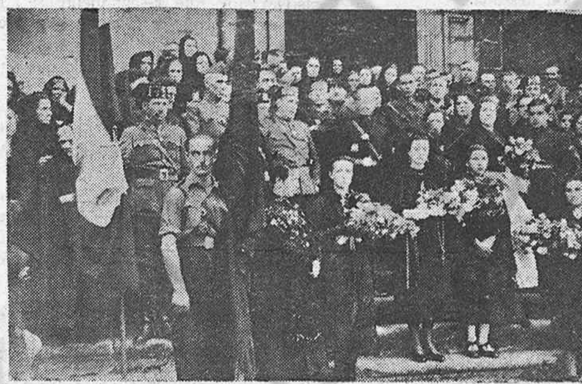
Grupo de autoridades y de bellas visonfinas que concurrieron a la patriótica solemnidad.