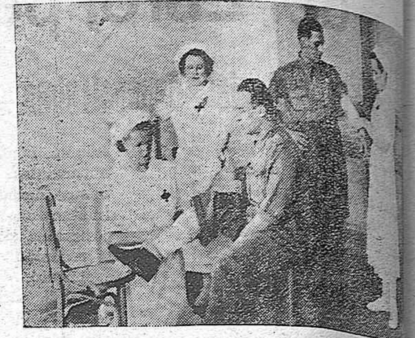
Abnegadas señoritas que, con el espíritu de españolar de nuestra raza, dedican sus mejores horas a cuidar en los hospitales.