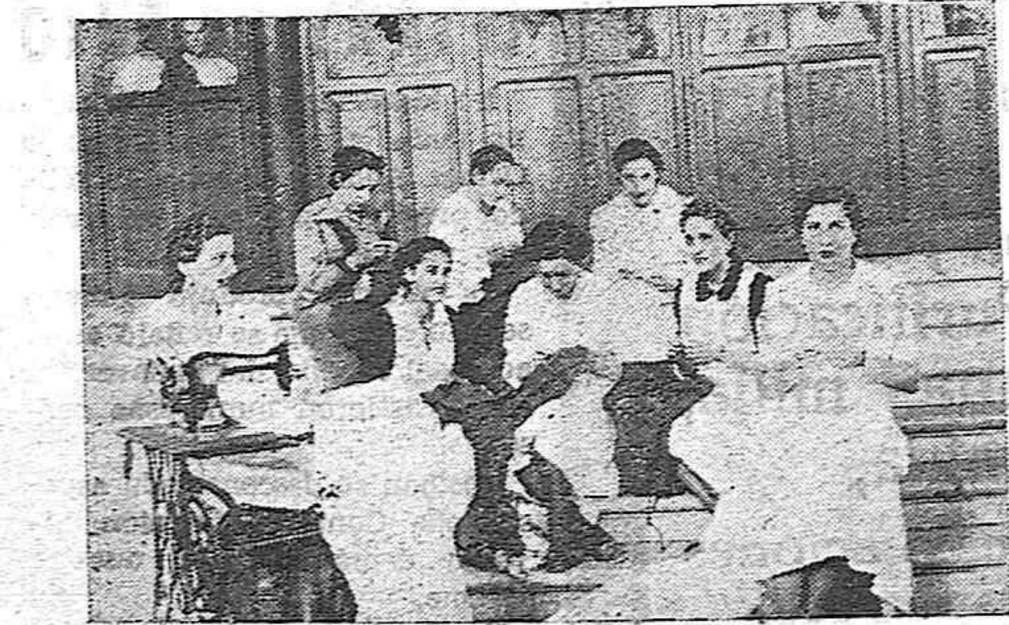
Los ratos de descanso de las enfermeras no se desaprovechan. En locales adecuados cosen y repasan la ropa de los heridos.