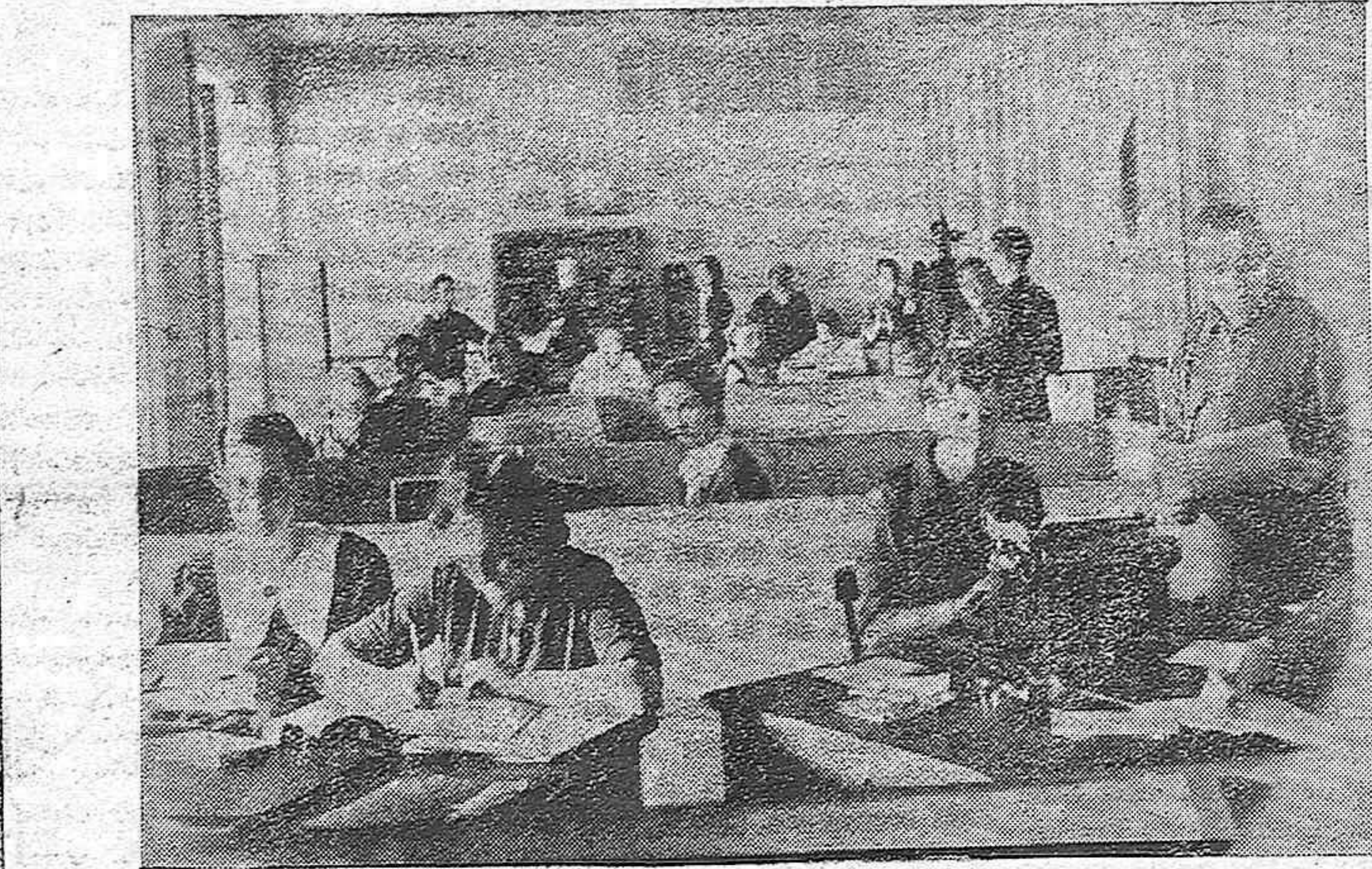
Todo es actividad y constante laborar en la oficina de la Delegación de AUXILIO SOCIAL de Palencia, ya que es tan sublime su misión, que no admite compás de espera.

—A SEIS MIL TRESCIENTAS OCHENTA Y OCHO ascienden las comidas que se reparten