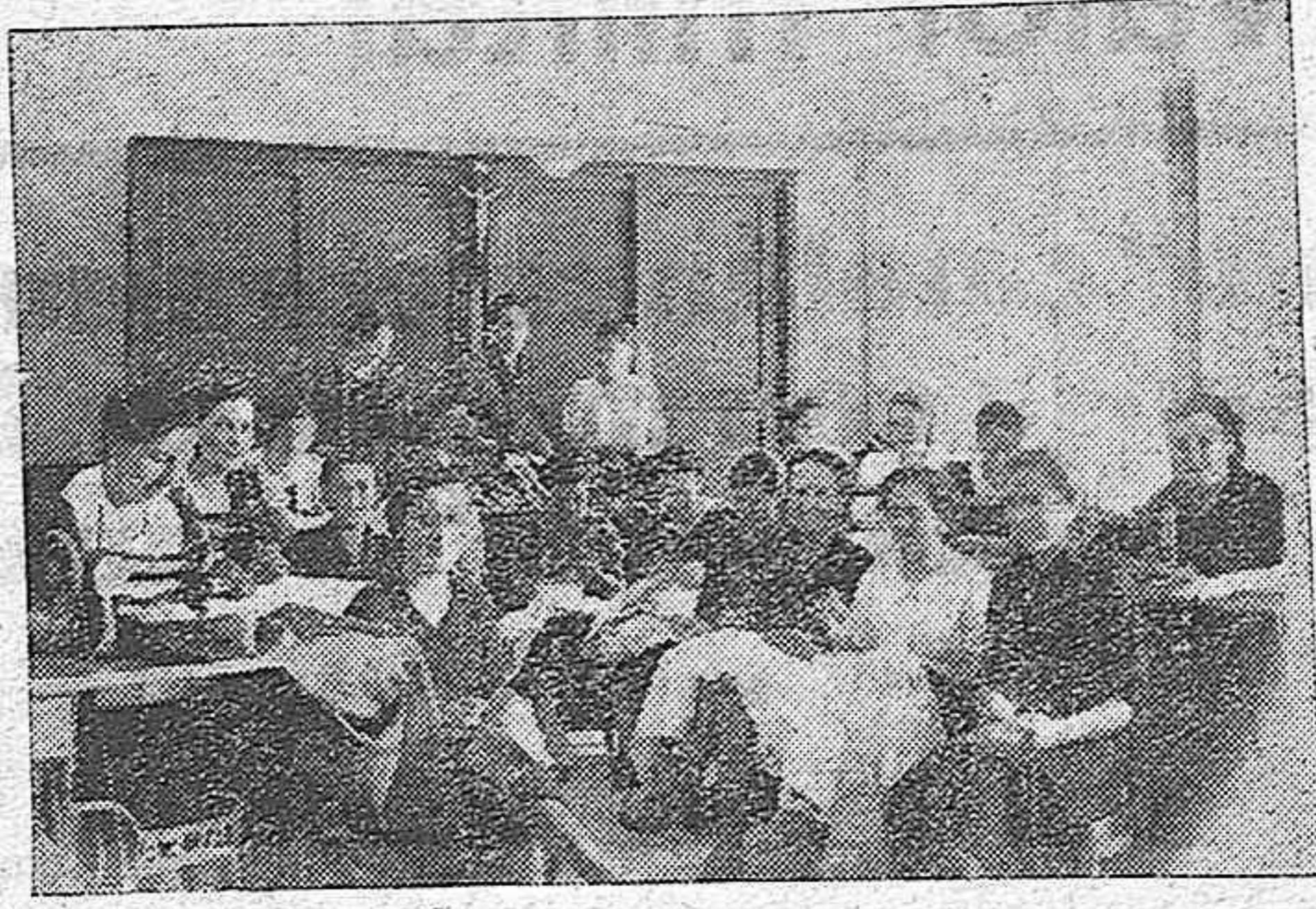
He aquí uno de los roperos de AUXILIO SOCIAL, en el que nuestras mujeres de hoy laboran sin cesar en la confección de prendas para el soldado.

A seis mil trescientas ochenta y ocho ascienden las comidas que diariamente reparte este organismo entre la capital y provincia