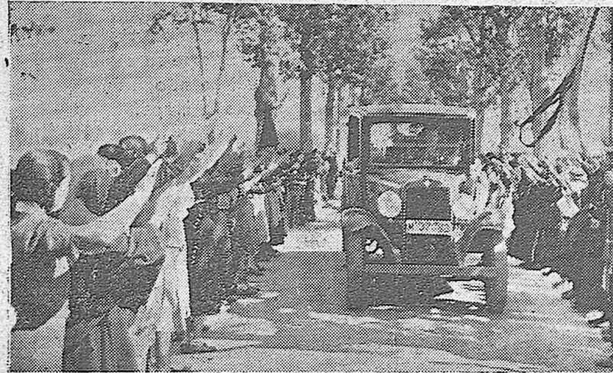
El paso de la comitiva fúnebre por Palencia, entrada en Saldaña, Villanoba de los Nabos, Gañinas y La Serna.