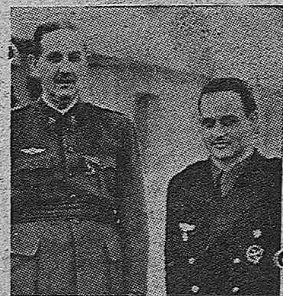
El general Kindelan con García Morato, cuando éste todavía ponía la gallardía de su vuelo sobre nuestros aires.

ROMA, 19 (23 horas).—El subsecretario de Aeronáutica italiana ha entregado al jefe de la Misión aeronáutica española, general Kindelan la medalla de oro, concedida a la memoria del «as» más grande de la Aviación de España, comandante García Morato.