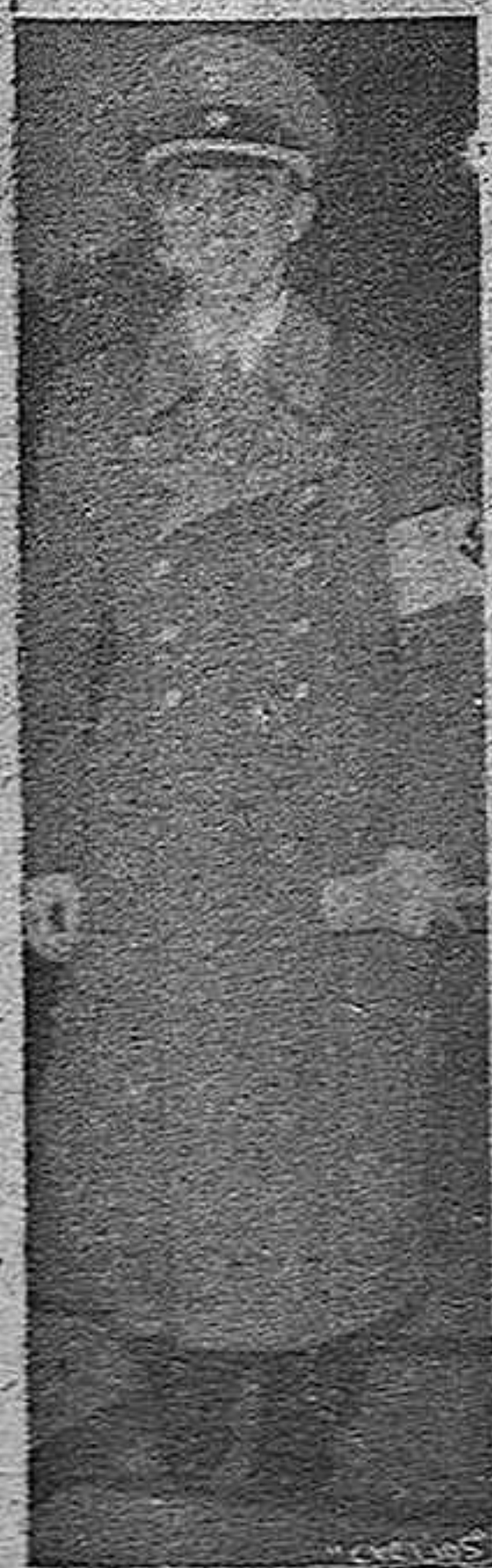
BERLIN, 19 (20 horas). El Dr. Goebbels ha marchado hoy de Dantzig con dirección a Berlín. La ciudad Libre le ha despedido con gran afecto y entusiasmo.