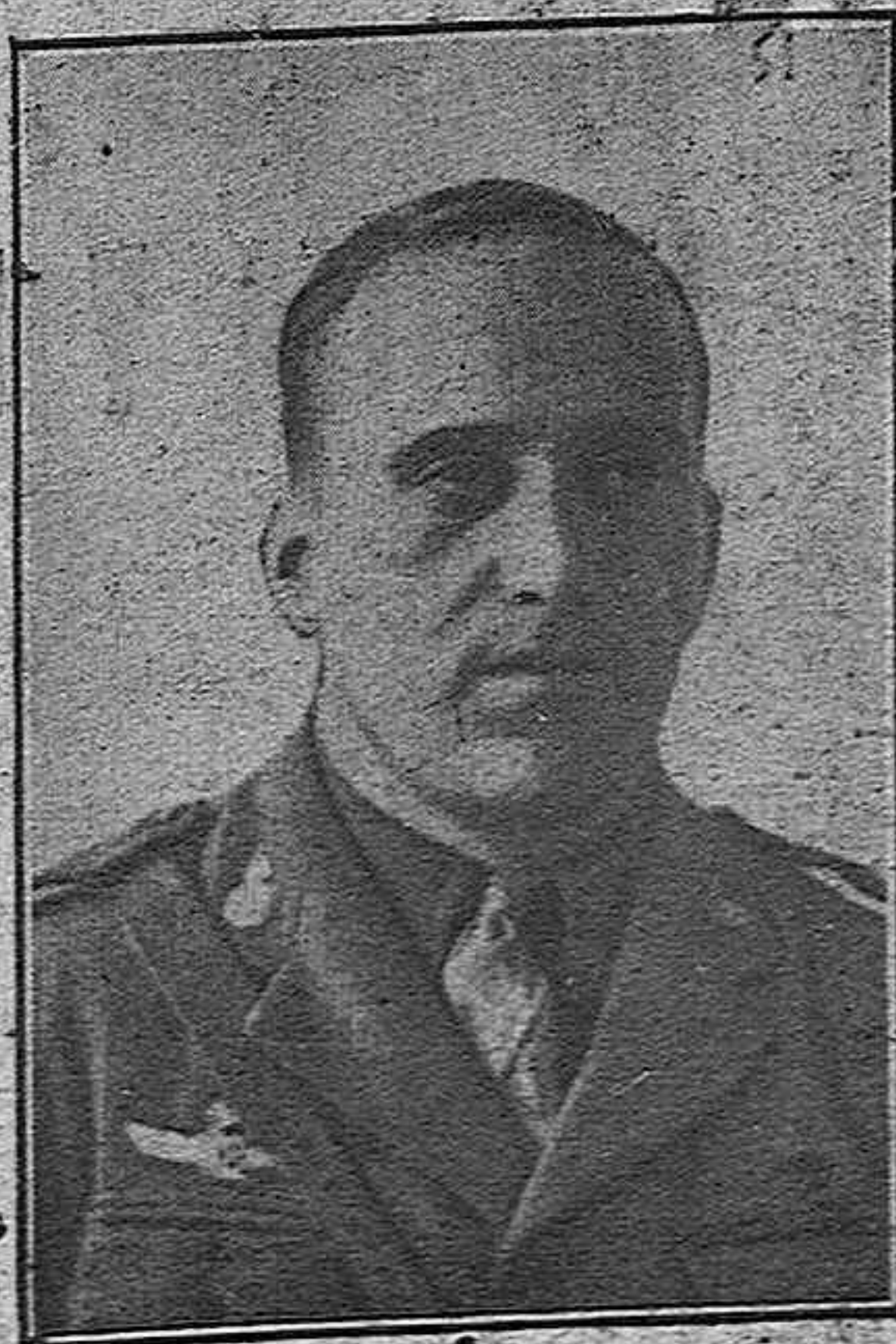
Julio Ruiz de Alda, corazón y nervio al servicio de la Patria, que ha recibido con el postumo homenaje a su heroica figura en tierras de Navarra, la veneración de España entera.