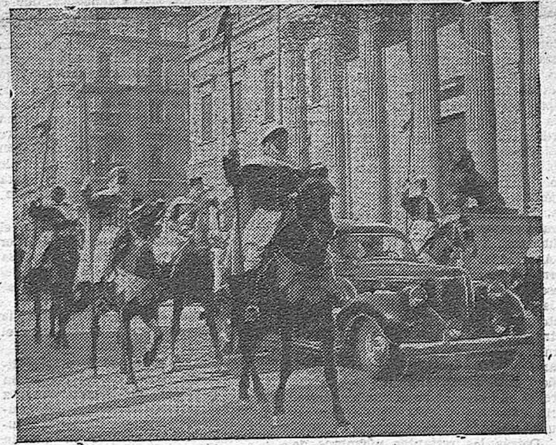
El nuevo embajador del Brasil presenta sus credenciales al Caudillo