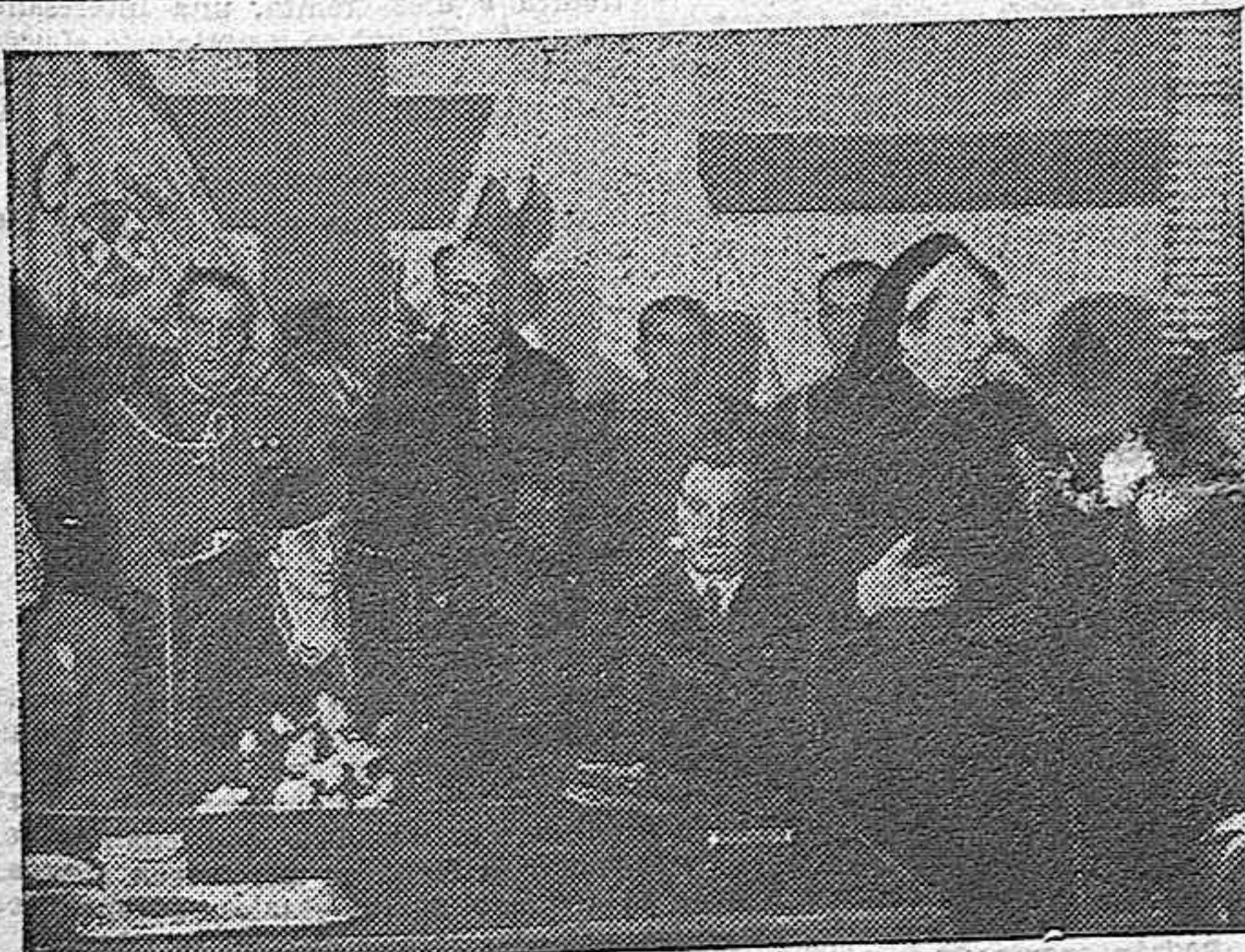
Presidido por la esposa del Caudillo, excelentísima señora doña Carmen Polo, se celebró el acto de la entrega de brazales y di- plomas a las nuevas damas en fermeras y a algunos camilleros