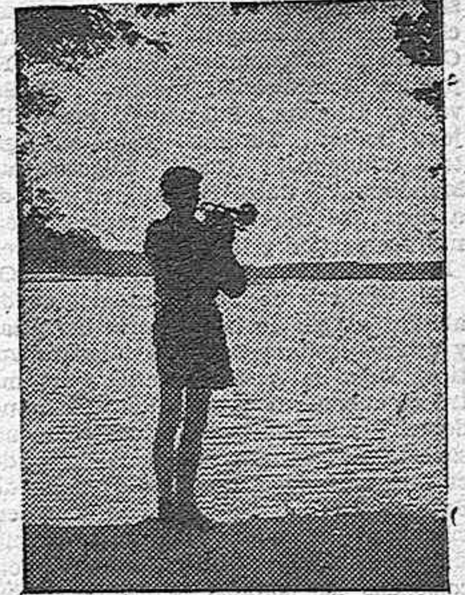
Este corneta de las Juventudes Hitlerianas despierta a sus compañeros del campamento, cara al lago y al sol recién nacido.