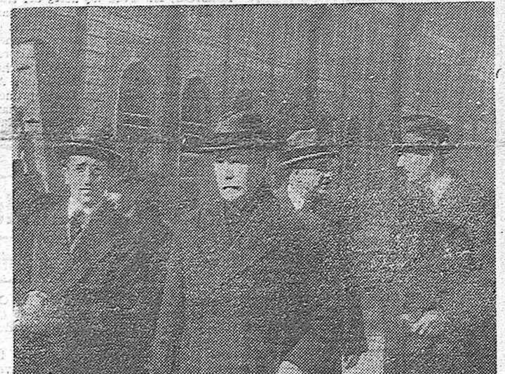
El embajador de Francia en España, mariscal Pétain, en el andén de la estación del Norte, a su llegada a Madrid.