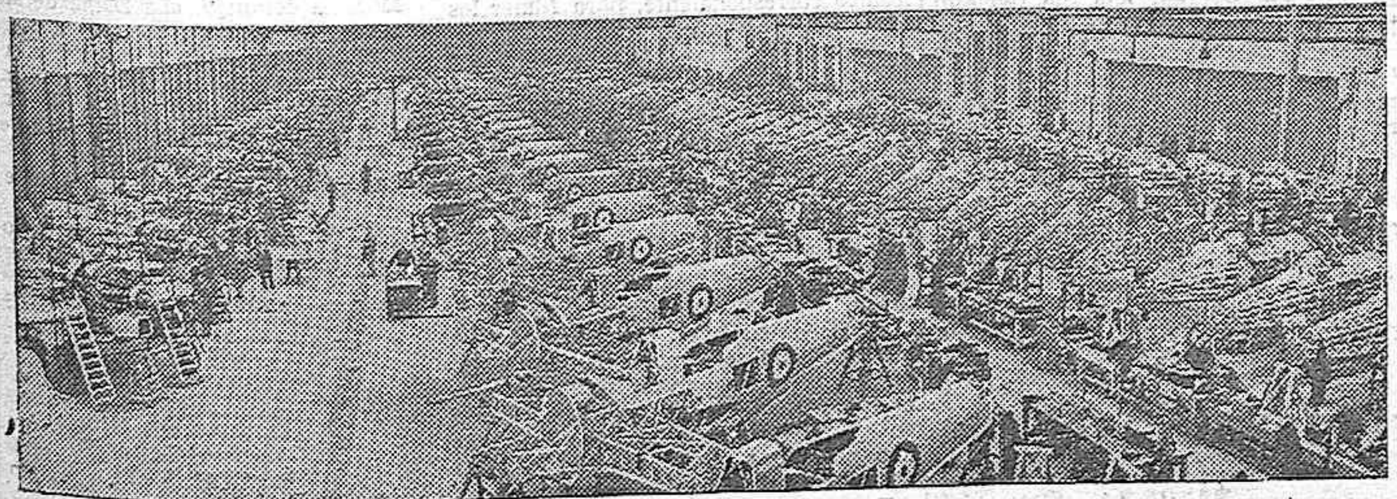
El Gobierno británico, convencido del papel decisivo que juega la Aviación en el actual conflicto, ha transformado en fábricas de aviones, gran número de industrias de estas fábricas en plena producción.