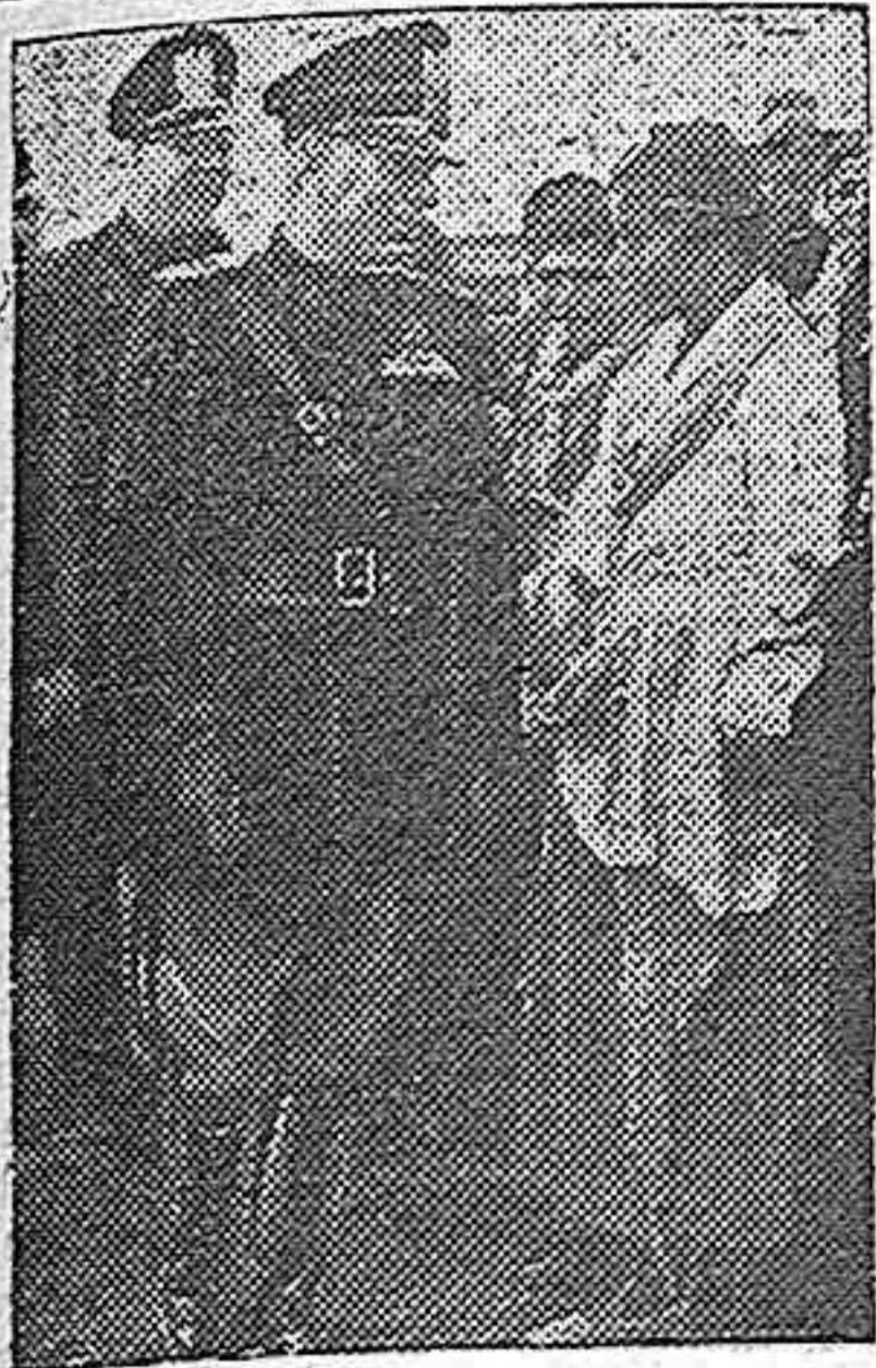
El Duce conversa con los colonos y se informa de sus necesidades, en la inauguración de la Ciudad de Pomezia, en el Agro Pontino.