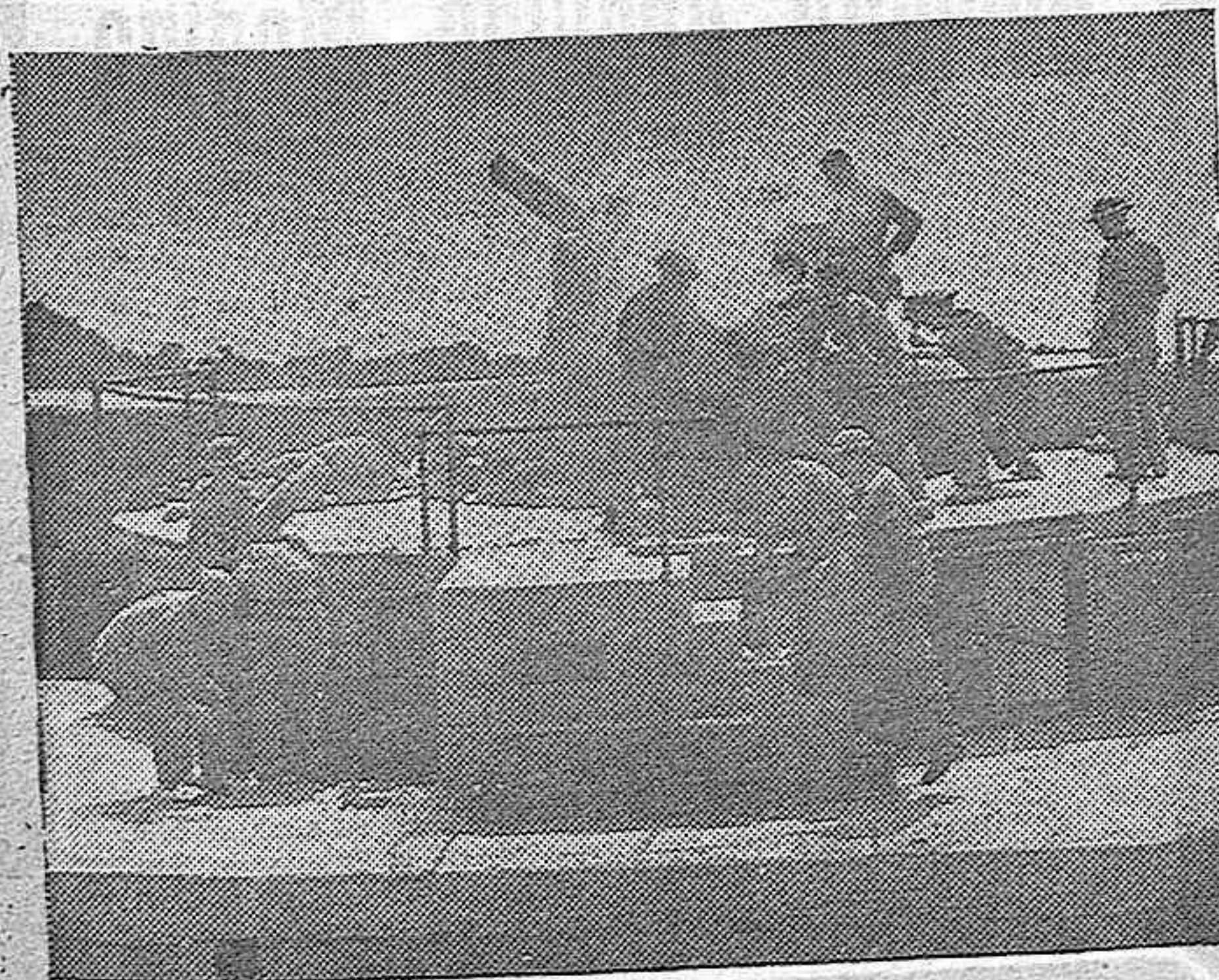
He aquí en plena acción un cañón de grueso calibre de los emplazados en la costa británica, para defenderla de las incursiones aéreas del enemigo.