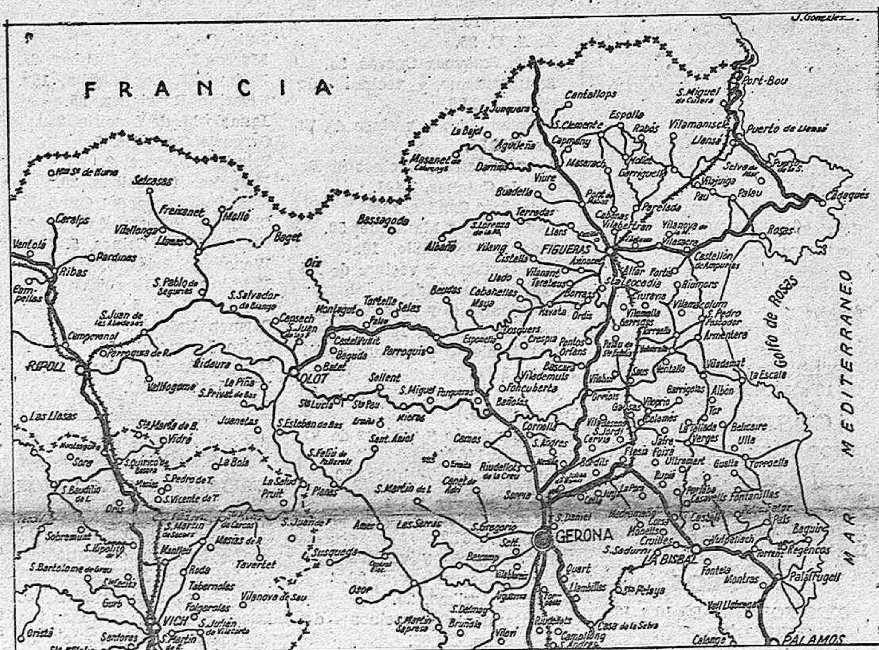
A petición de varios lectores de "EL DIA", repetimos hoy la publicación de este croquis que recoge el sector de Gerona. Nuestros soldados, que se hallaban ayer a 10 kilómetros de esta capital, aumentan también el interés que en estos momentos tiene el presente mapa

Después se celebró un almuerzo en el Club Náutico, con asistencia de autoridades y jerarquías del Movimiento. Después del almuerzo, el señor Berard hizo varias visitas a las más importantes fábricas de esta zona.—LOGOS.