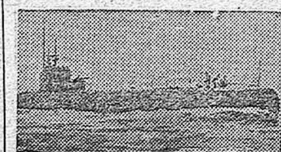
EL SUBMARINO C-1, QUE HA SIDO ENCONTRADO EN BARCELONA DESPUES DE LA LIBERACION DE DICHA CAPITAL

BARCELONA. — SE CONFIRMA QUE, DOS DIAS ANTES DE LA CAIDA DE BARCELONA, EL OBISPO DE TUEL, CON OTROS VARIOS DETENIDOS EN UNA DE LAS CARCELES DE ESTA CAPITAL, FUE SACADO DE BARCELONA EN DIRECCION DESCONOCIDA.