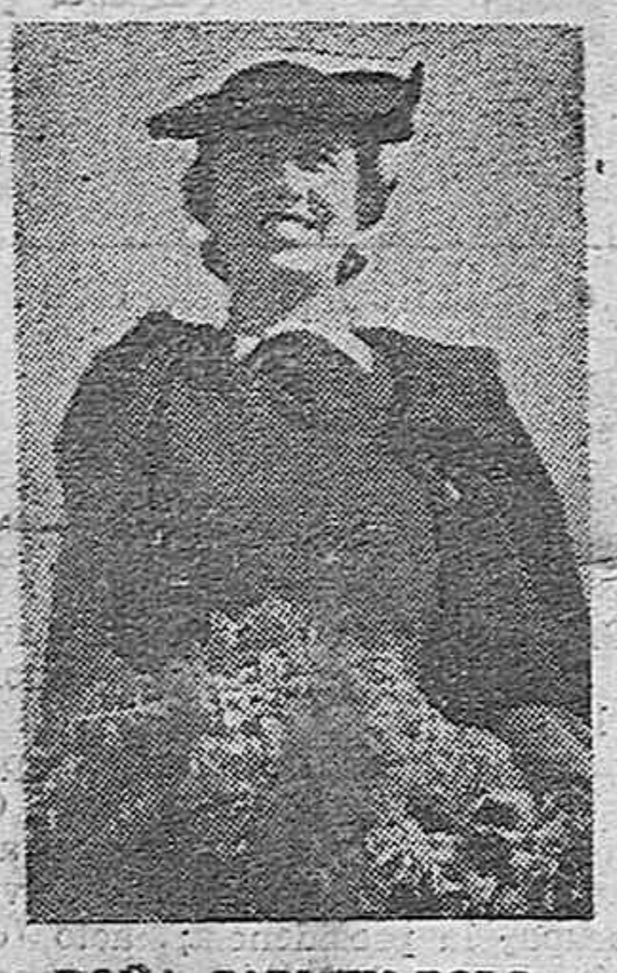
DOÑA CARMEN POLO

Valencia.—A las diez y cuarto de la mañana llegó al Histórico Colegio del Patriarca, S. E. D.ª Carmen Polo, de Franco.