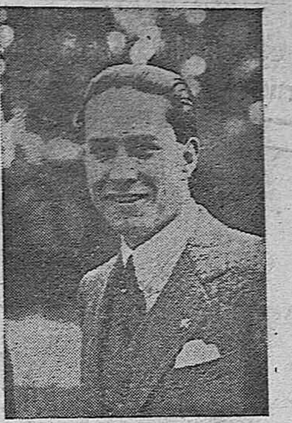
CONDE CIANO que hoy recibirá a Von Ribbentrop para tratar del problema internacional europeo

Bucarest.—Una nota oficiosa publicada en los periódicos, dice que la visita del general francés Weigand, tiene un carácter simplemente amistoso, y está desprovisto de toda significación política.—Stéfani