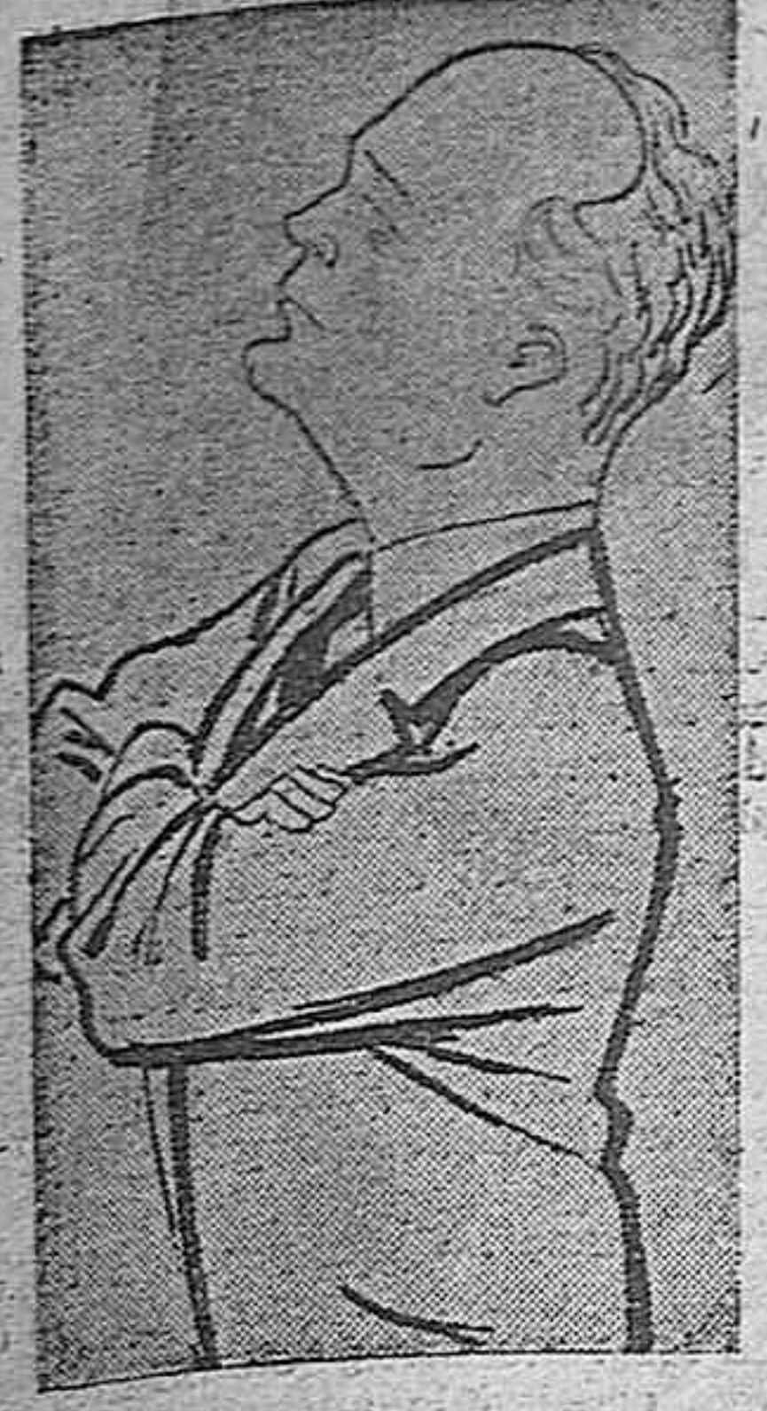
VON RIBBENTROP que hoy celebra una importante conferencia con el Condé Ciano en Italia.