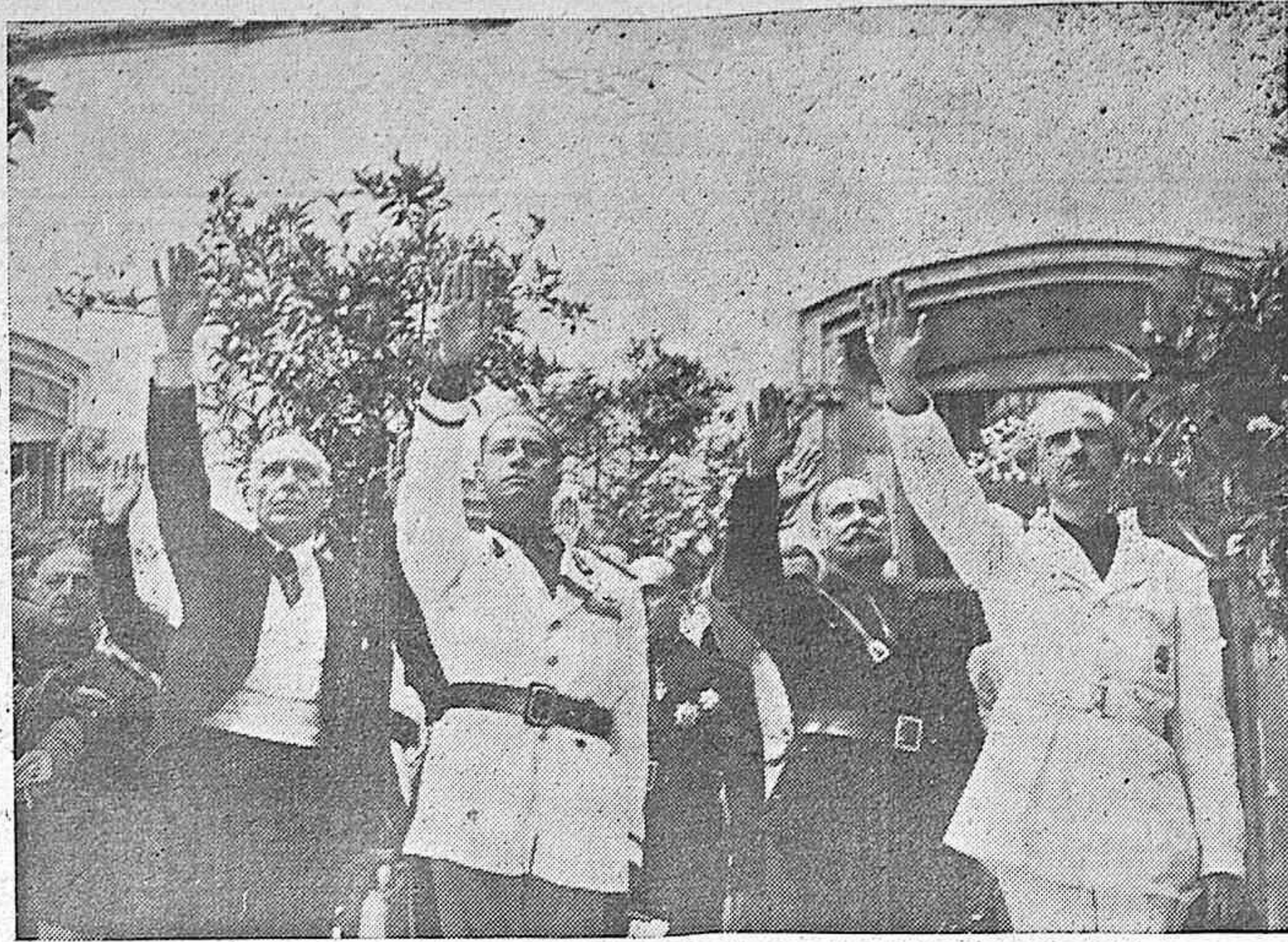
EL CONDE CIANO EN BARCELONA.—El conde Ciano, a quien acompañan el ministro de la Gobernación y el presidente de la Diputación de Barcelona, en el patio de los Naranjos del Palacio provincial.

MARTIN GABANES, CAMISAS, CORBATAS Mayo, 76, y 86.