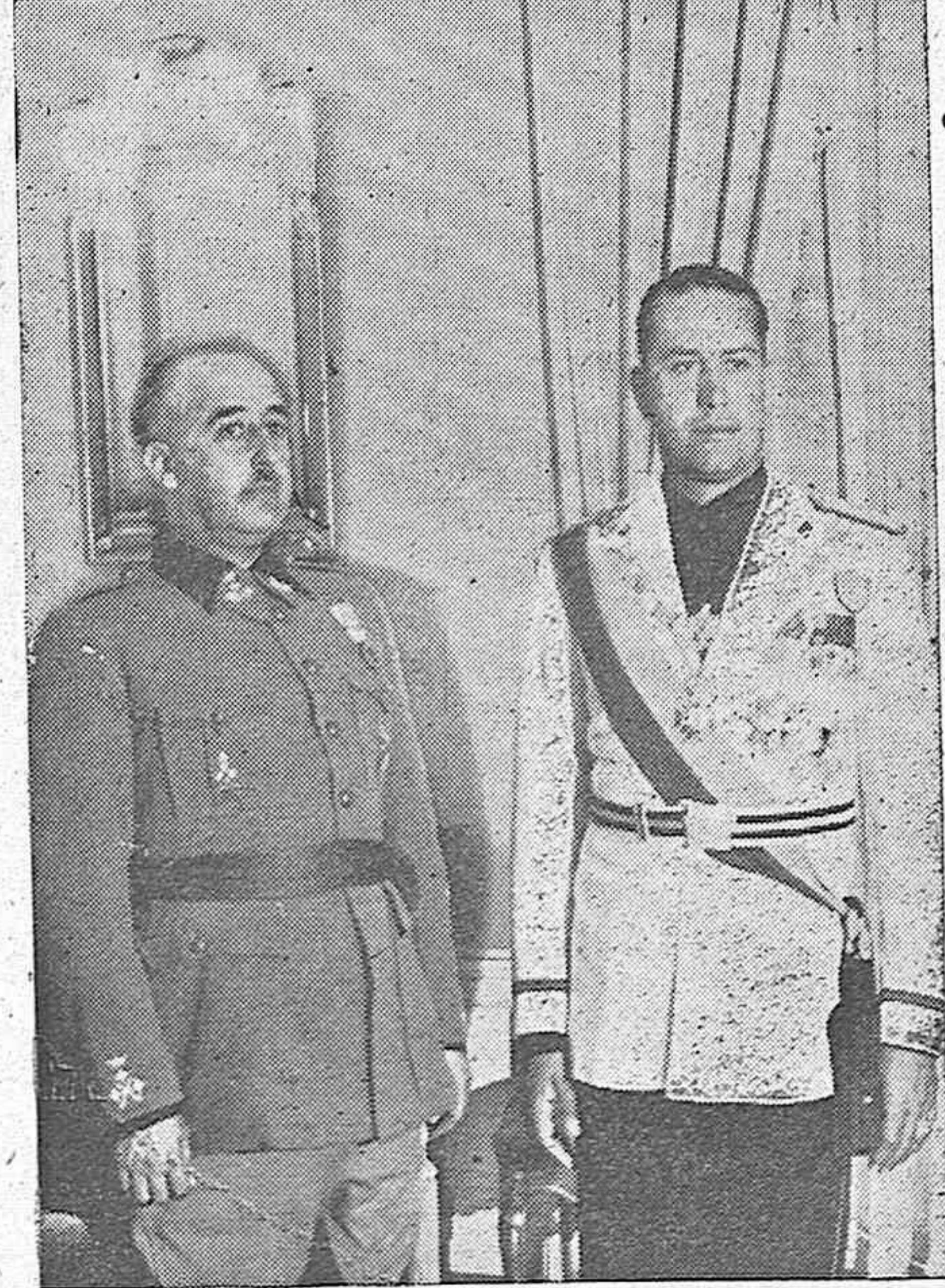
El Caudillo y el conde Ciano durante la entrevista que celebraron en San Sebastián.

PRÓXIMOS FUNERALES. Madrid, 18 (4,30 t).—El próximo día 21 tendrán lugar en la Iglesia Catedral solemnes funerales en sufragio del alma de seis caídos miembros de Acción Católica de Madrid.—Mencheta.