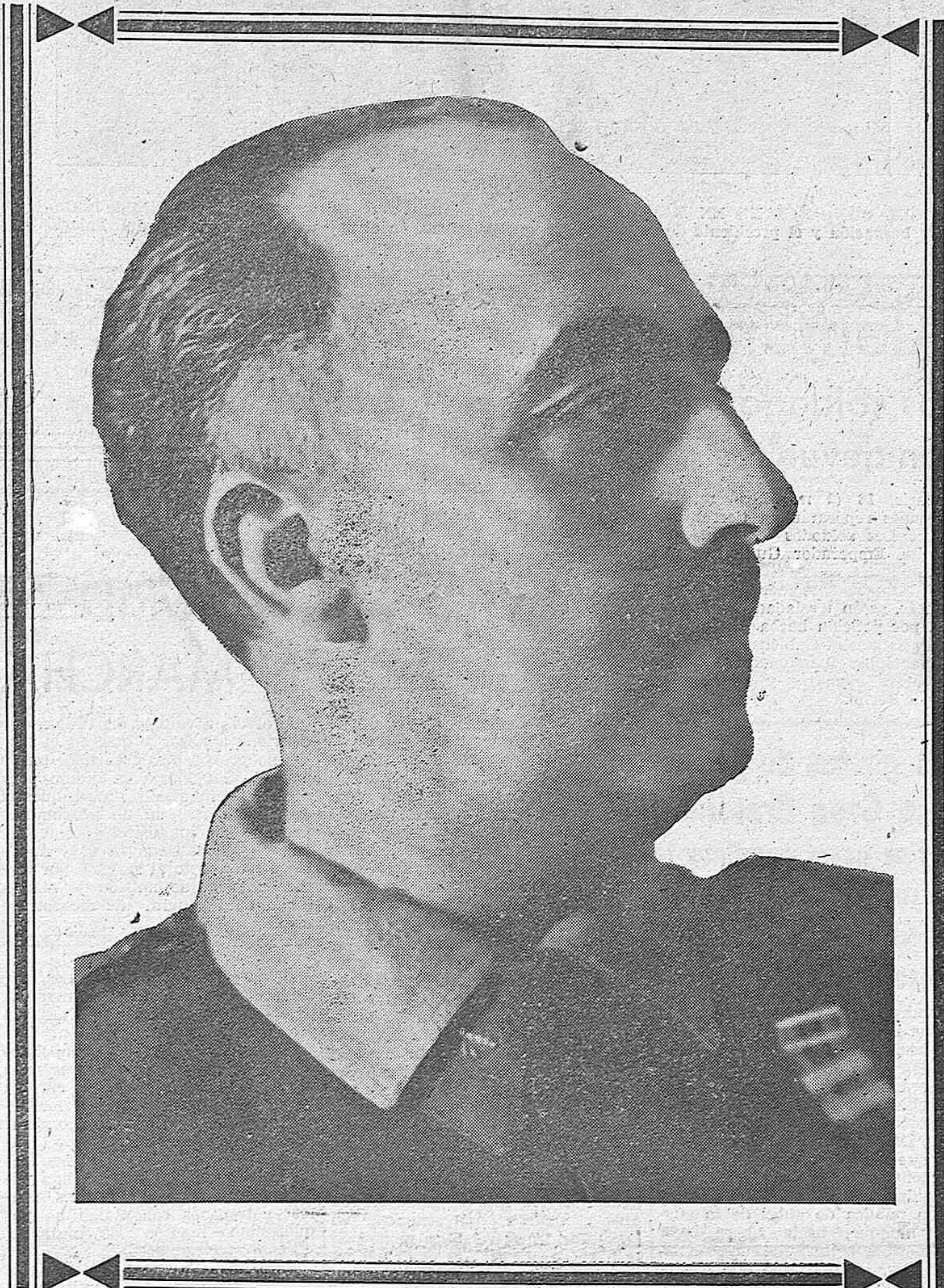
Fecha triunfal, fecha histórica, grabada indeleblemente en el corazón de todos los españoles y esculpida con caracteres de sangre y juego en la carne viva de la Patria: 18 de julio de 1936. ¡Tres años ya de aquella laborada histórica, en la que el sol del Imperio se levantó sobre el horizonte de una España que quería redimirse a sí misma, con el sacrificio y el dolor de una guerra!

FUNERARIA HONTIYUELO Casa fundada el año 1880 Mayor Pral., 186. Teléfono, 94 PALENCIA