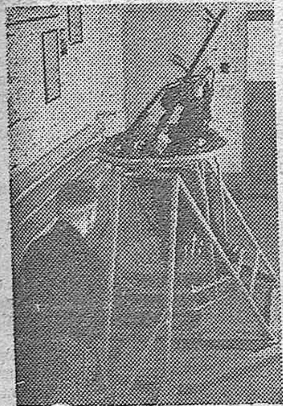
Utilizando este dispositivo especial, dos armeros del Ejército alemán examinan detenidamente una ametralladora antiaérea