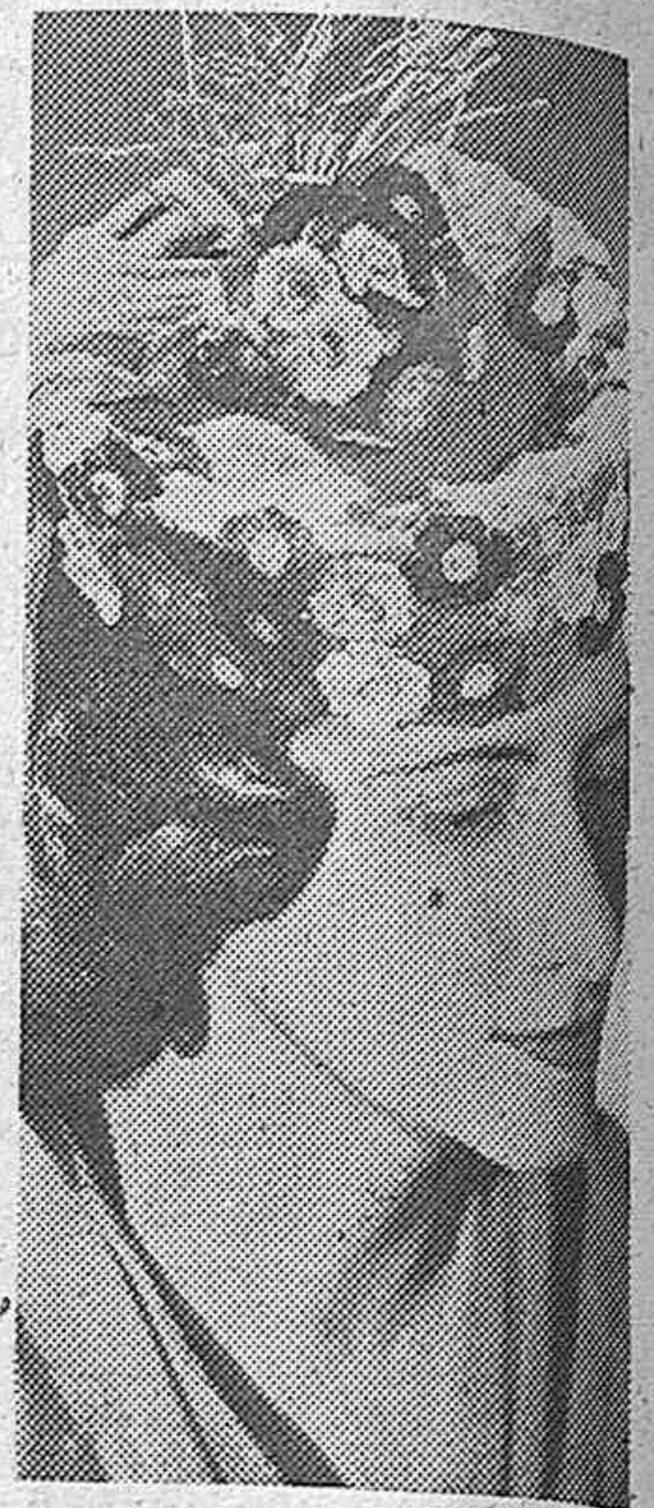
La última creación parisina en sombreros femeninos es este modelo con florecillas de colores naturales, llamado «Morisco».

OSLO, 17.—El capitán del vapor «Altmark», ha hecho las siguientes declaraciones: «El día 16 de febrero, el «Altmark», navegaba a lo largo de la costa noruega, a milla y media de Stavanger y Christiansund; tres aviones ingleses del tipo «Blenheim», volaban desde el comienzo de la jornada sobre el vapor unas veces, sobre la costa noruega otras, el vuelo era en ocasiones muy bajo. Los aviones estaban, sin duda, en comunicación telegráfica,