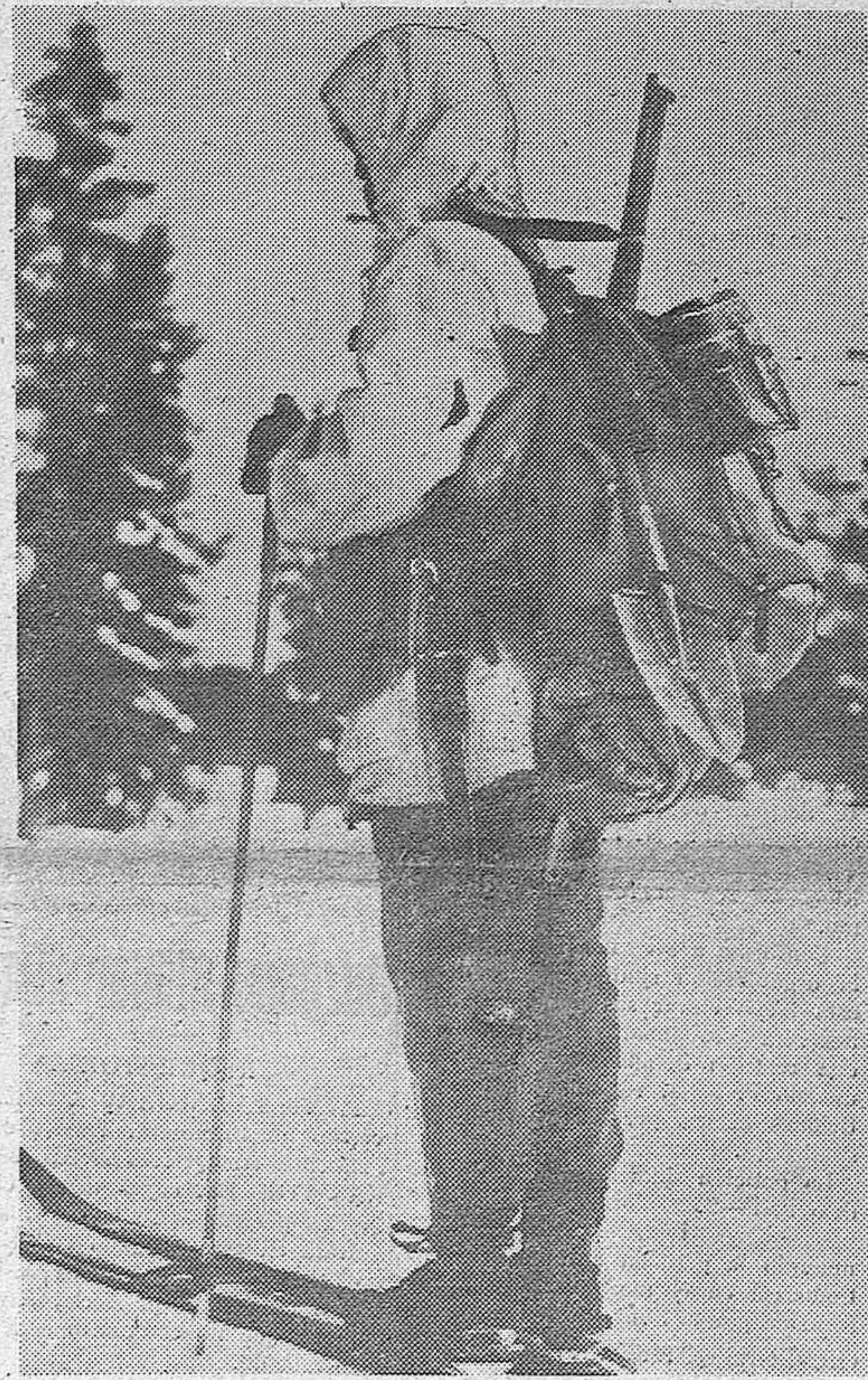
Este soldado sueco, perfectamente equipado para la lucha en las nieves, vigila en las líneas fronterizas de su país (F. Ortiz)

Aire. — Anoche, nuestras fuerzas aéreas bombardearon varias veces las concentraciones de tropas soviéticas. Hoy han continuado estos bombardeos, alternados con vuelos de reconocimiento y protección. En la zona de operaciones, la aviación enemiga ha efectuado bombardeos nocturnos, especialmente en el istmo de Carelia. Sin embargo, durante el día, la actividad de los aparatos soviéticos ha sido menos intensa que hasta ahora. En el curso de la jornada han sido derribados dos aviones enemigos: uno seguro y otro probable.—EFE.