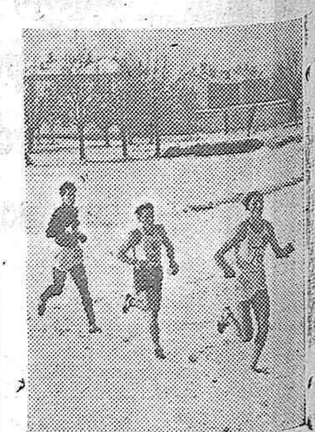
El triunfador Baila se aproxima a la meta en la dura prueba de destre sobre campos nevados, corrida recientemente en Milán.