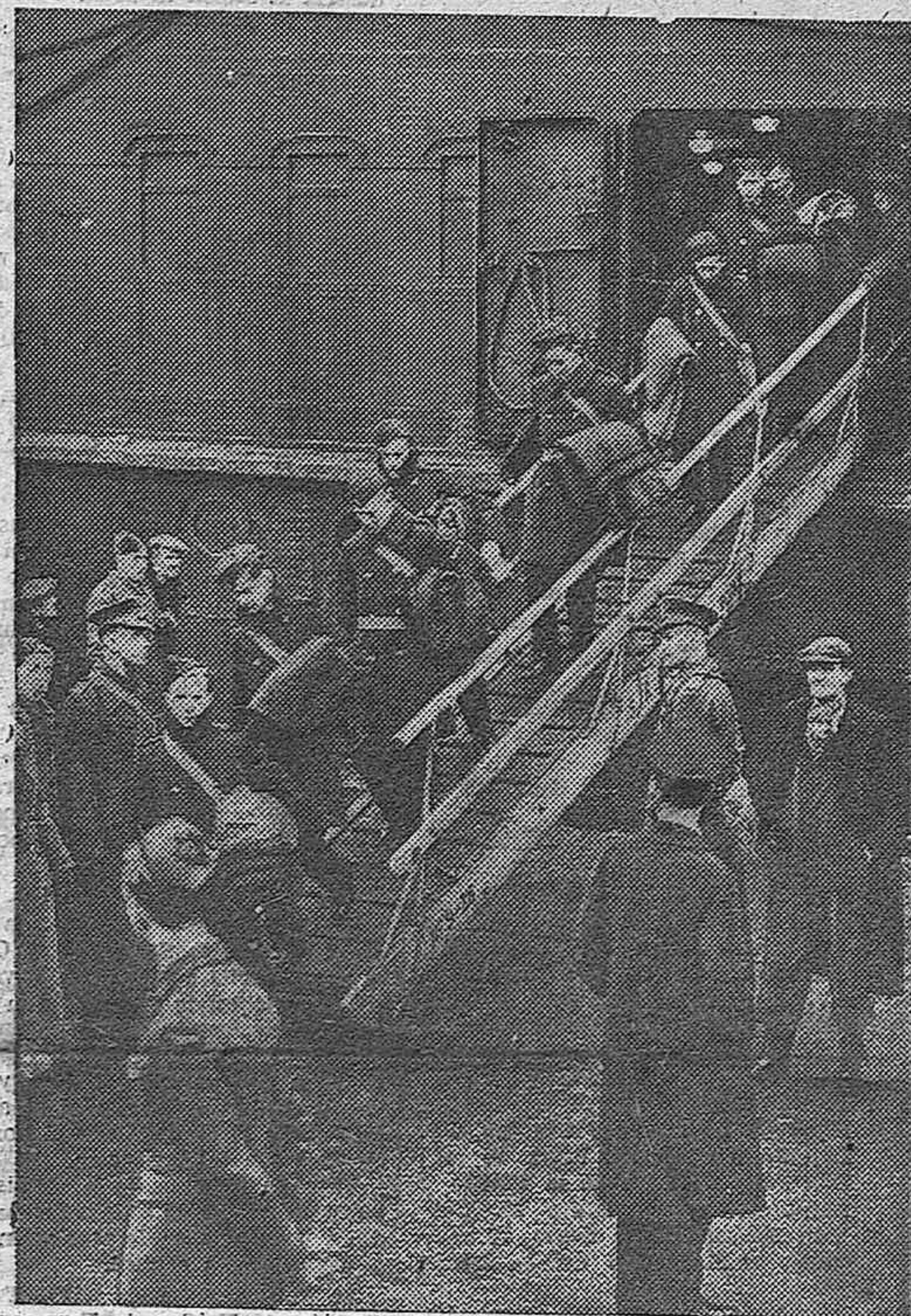
DE AUSTRALIA LLEGAN A GRAN BRETANA CONTINGENTES DE AVIADORES COMO ESTOS QUE APARECEN RETRATADOS AL DESEMBARCAR EN UN PUERTO ENGLÉS