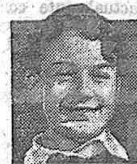
ya que tiene los pequeños.

Para ellos, especialmente ha sido creado el "Vegetal Richelet" el cual combate las dolencias y enfermedades propias de la infancia como: Enfermedades de la Piel, vegetaciones, usagre, erupciones, colores pálidos, etc., etc. El Vegetal Richelet da solidez a sus huesos, facilita el crecimiento y desarrollo, combatiendo el linfatismo. Es además un excelente regenerador de los niños, y adolescentes raquíticos y enfermizos. Reemplaza con ventaja el aceite de hígado de Bacalao, un sabor delicioso que no puede repugnar a los niños.