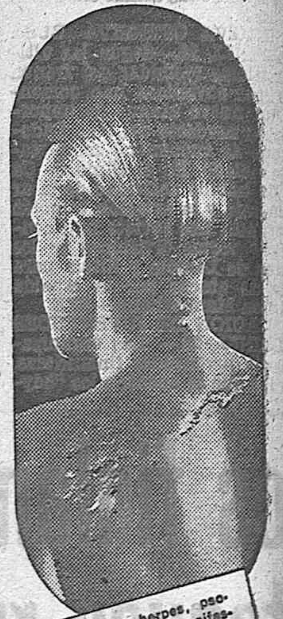
El eczema, herpes, psoriasis, etc., son manifestaciones de una sangre viciada que se debe purificar con el DEPURATIVO RICHELET

El Depurativo Richelet, es más que nada el "rectificador" por excelencia de la sangre viciada, ya que bajo su acción la masa sanguínea se purifica completamente. La sangre vuelve a