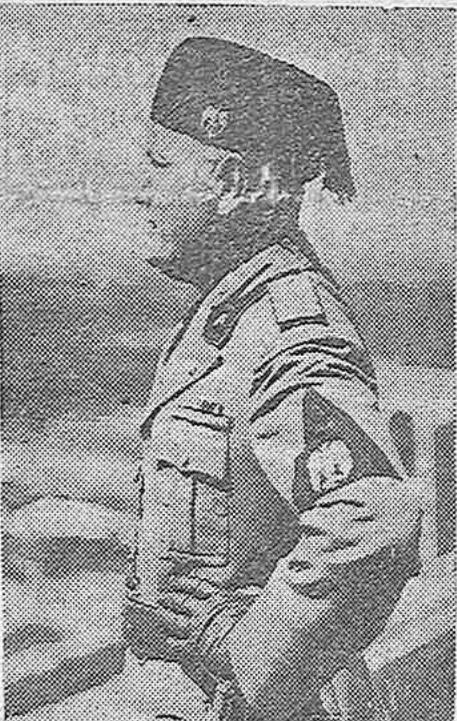
Y Balbo, el Almirante Thaon de Ravel y varios generales.

Roma.—Ayer se reunió por primera vez el Comité Consultivo de Derecho de Guerra, constituido por un decreto dado en diciembre de 1938. La reunión fue presidida por Mussolini, el cual pronunció una alocución, subrayando los puntos siguientes: Al preparar la nación para la guerra, hay que tener en cuenta el hecho de que los acuerdos internacionales relativos al Derecho de Guerra y a las antiguas disposiciones del Ejército, ya no corresponden al actual Estado de cosas creado por los nuevos y numerosos decretos y por la nueva misión que incumben al ejército aéreo. Ha sido, pues, necesario elaborar un sistema completamente nuevo, habiendo creado una Comisión y constituido en 1936, las bases para el nuevo Derecho de Guerra. Esta comisión acaba de presentar unas proposiciones detalladas, por lo cual, Italia dispondrá en breve de una legislación enteramente nueva en cuanto a los problemas referentes a la guerra y a la neutralidad. La Comisión consultiva debe terminar ahora la mencionada legislación y dar fin también a la reforma del Código militar. AHORA QUIEREN TENER UN REPRESENTANTE