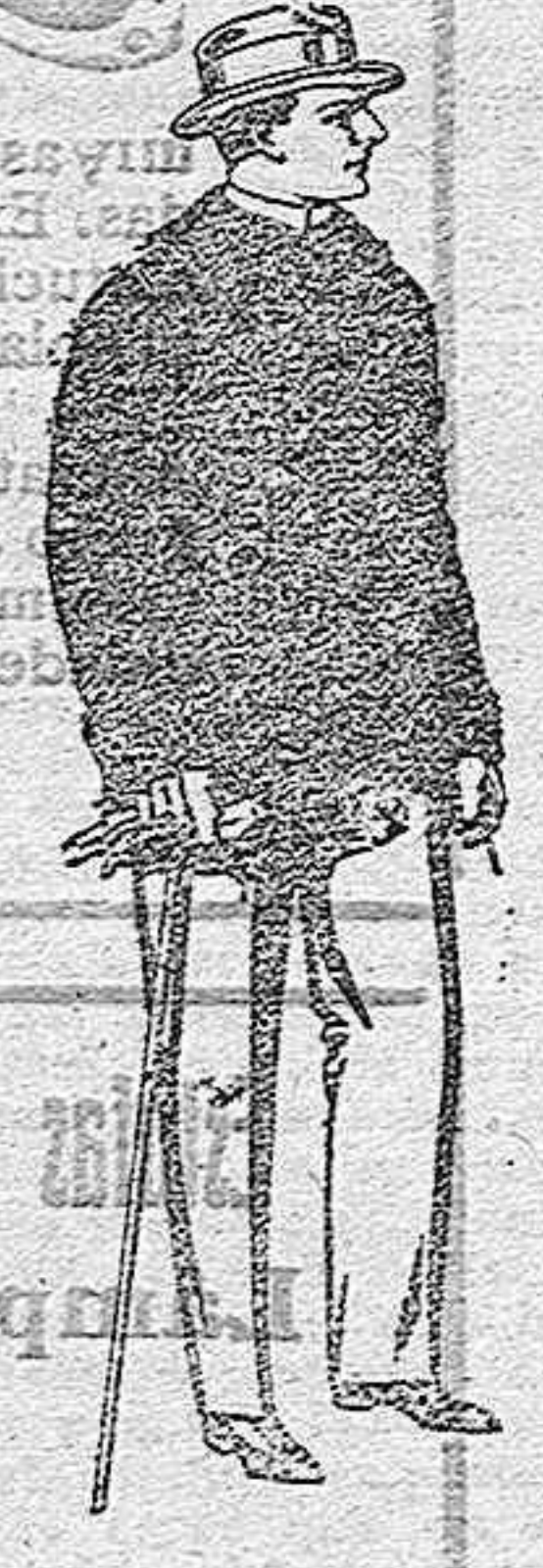
Pelliza de ratina con cuello del mismo género y con astrakan, de pesetas 38 a 110