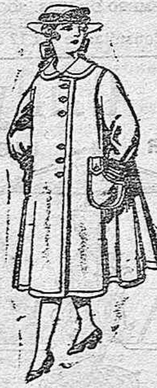
Abrigos de lana para jovencitas de 11 a 15 años, de ptas. 35 a 40