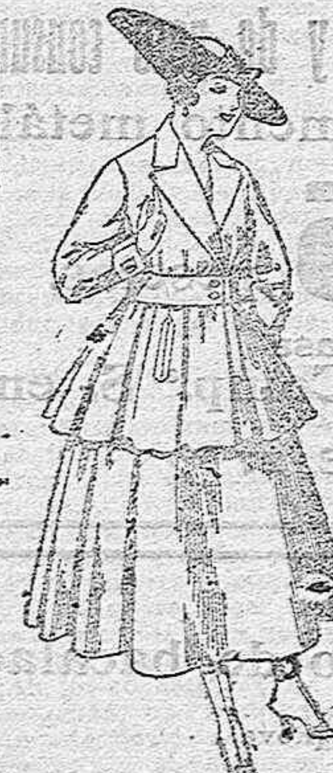
Traje de lana, en negro, azul y color, para señora, de pesetas 95 a 105.