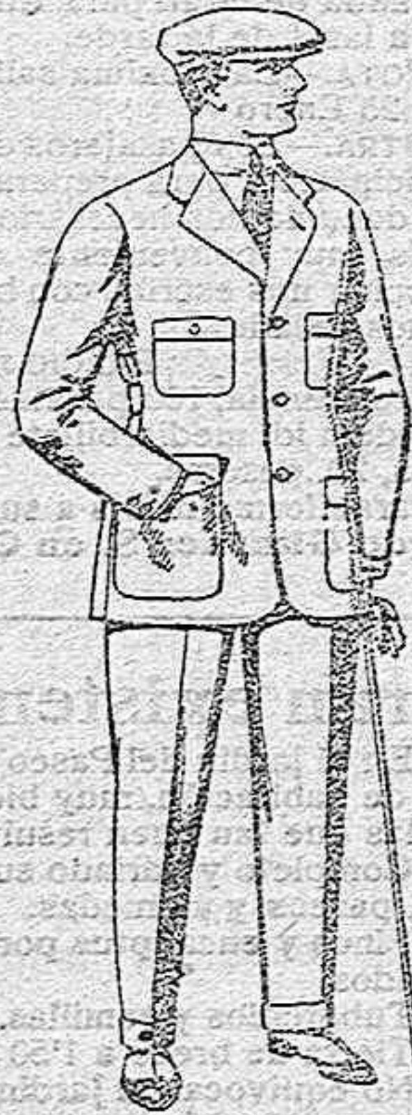
Trajes de cheviot, corte elegante, para sportman, de ptas. 45 a 55.