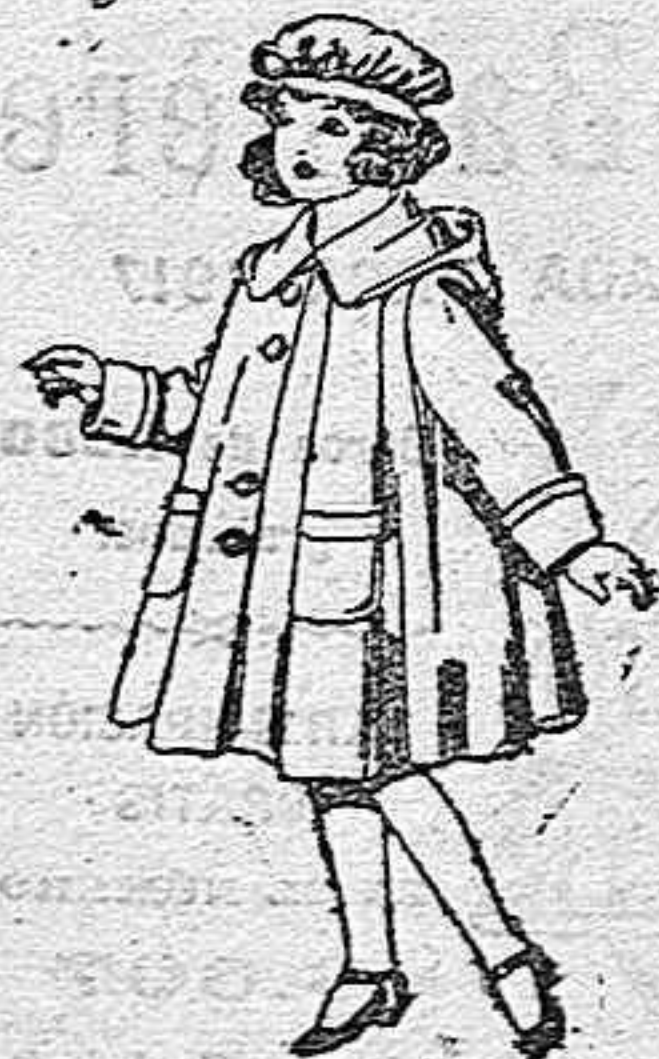
Abrigos de paten, para niñas de 4 a 9 años, de pesetas 22 a 33.