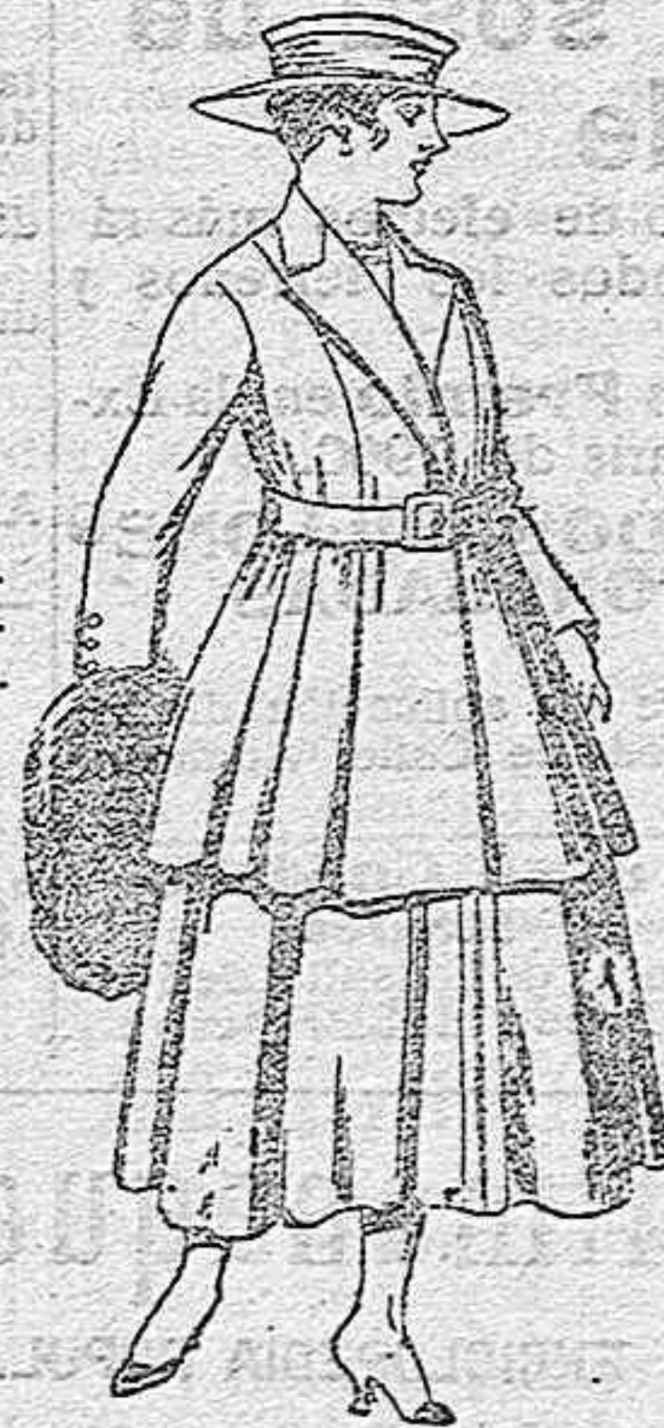
Traje de lana para señora, en color negro y azul, de pesetas 85 a 100.