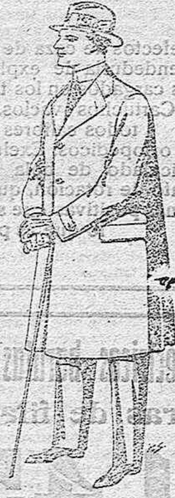
Gabanes de tejido pluma o ratina, de pesetas 33 a 100.