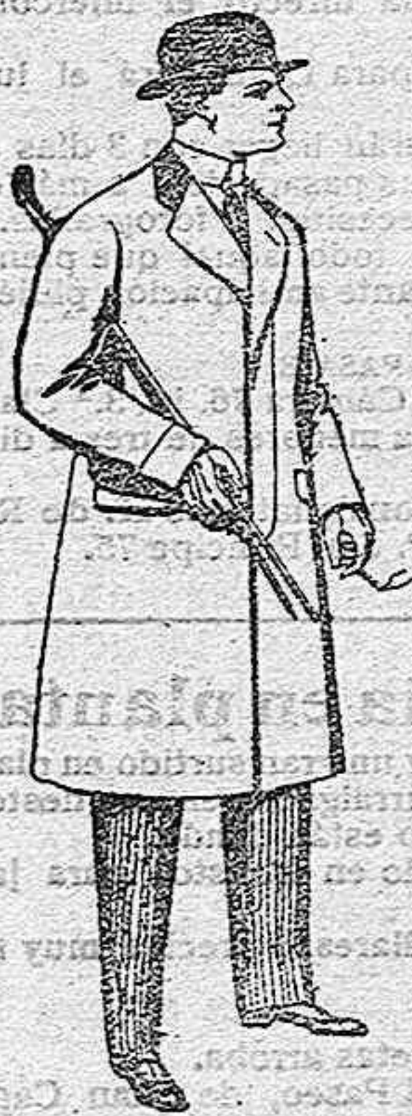
Gabanes de paten, melton y cheviot, con forros seda, saten o escocés, de pesetas 33 a 100.