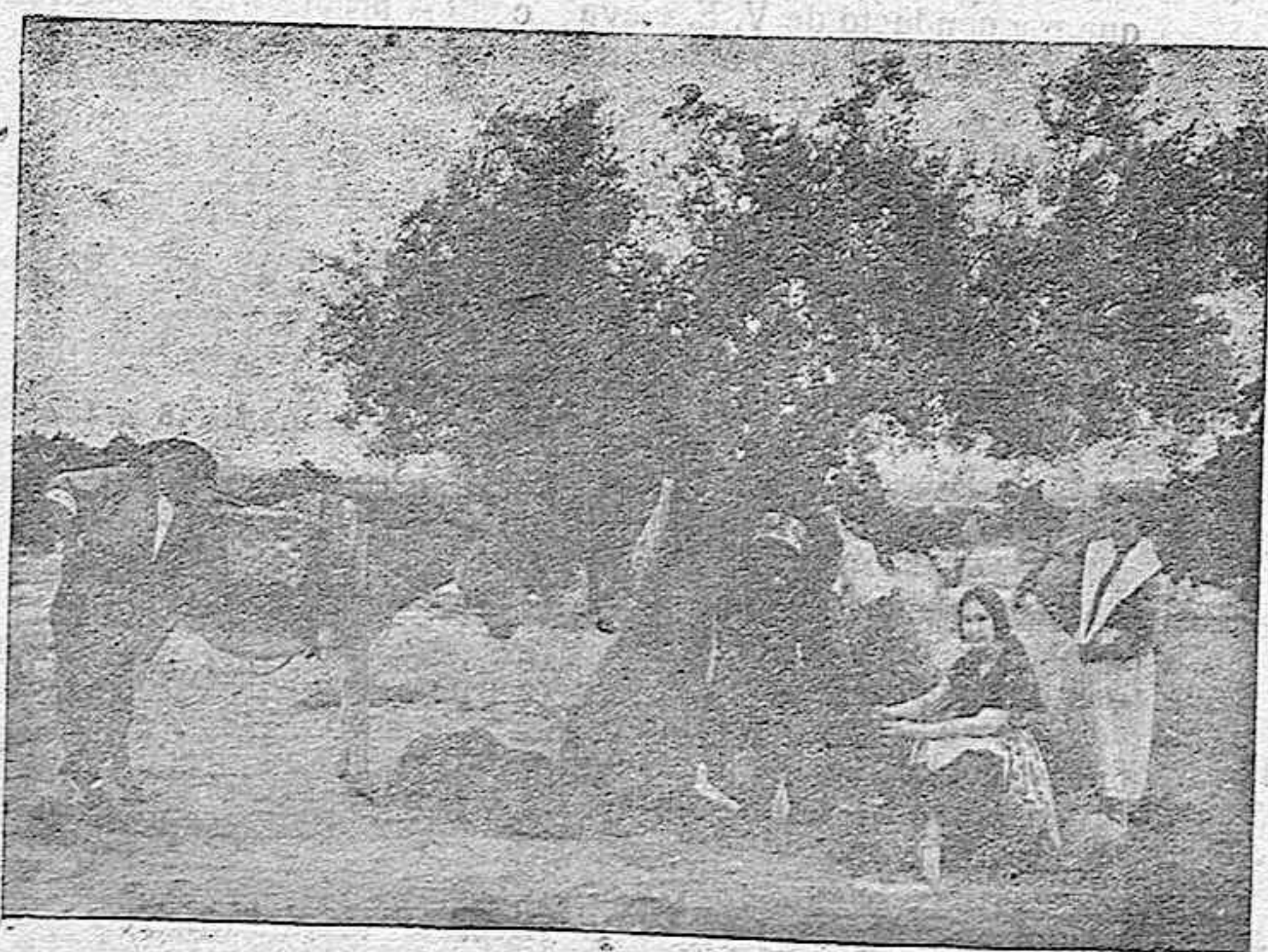
Recogiendo los típicos albaricoques

Naturalmente que la legitimidad proclamada quedase reducida solo al nombre. Los toledanos y los que vivieron en aquella ciudad saben que no hay tal «toledanismo», sonriéndose ante los citados anuncios, aunque hay algunos que se molestan y protestan airados del descaro de los vendedores: ¿Pero cómo de Toledo, si allí están aún sin madurar? Los legítimos verdaderos, son mucho más tardíos, no estando en condiciones de recolectarse normalmente hasta fines de Junio. Más sigue la farsa, la eterna y justificadísima en este caso, ya que Toledo apenas produce este fruto.