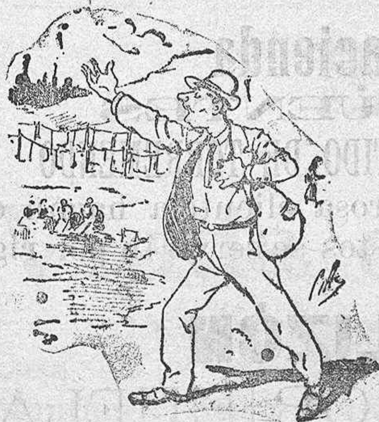
(La estatua de D. a Inés toma el olivo, la de D. Gonzalo se estremece y

De azares mil á través llena mi vida futura si tú tuviste la holgura de que hoy disfruta D. Juan, contéplale que barbían viene hoy á tu sepultura. ¡Oh! D. a Inés de mi vida, si el mando con que deliro es el postrimer suspiro que huele ya á despedida; si en Madrí el poder anida, que mande desde la altura esta vara que perdura en mis manos con afán, haz permanente á D. Juan alcalde en tu sepultura.