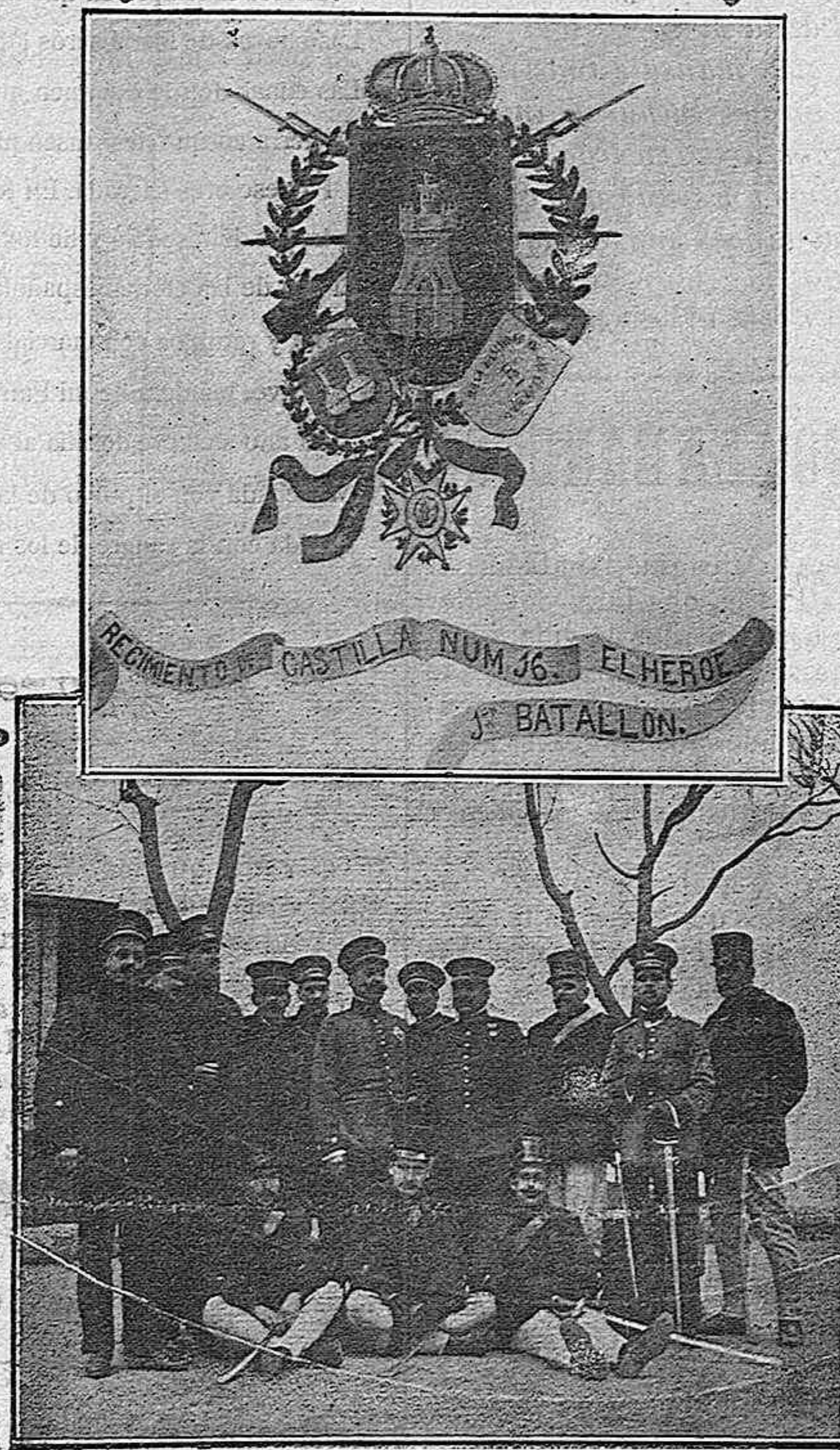
Escudo del Regimiento de Castilla y Jefes y oficiales del primer Batallón que guarnece esta plaza.