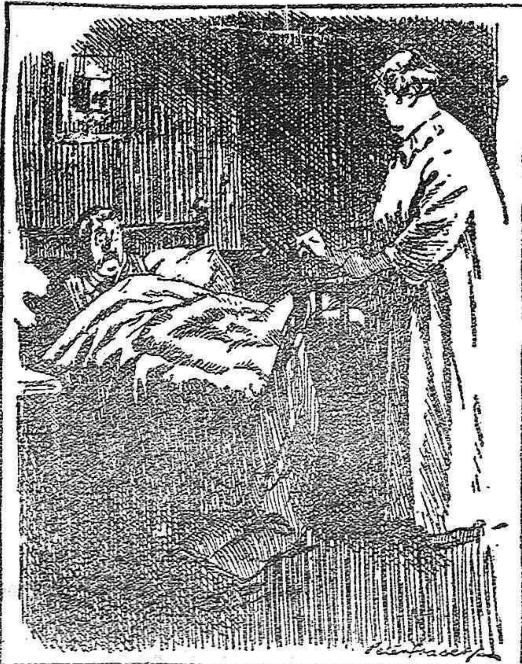
El marido (despertándose).—Noto que siempre caminas en sueños hacia mis pantalones.