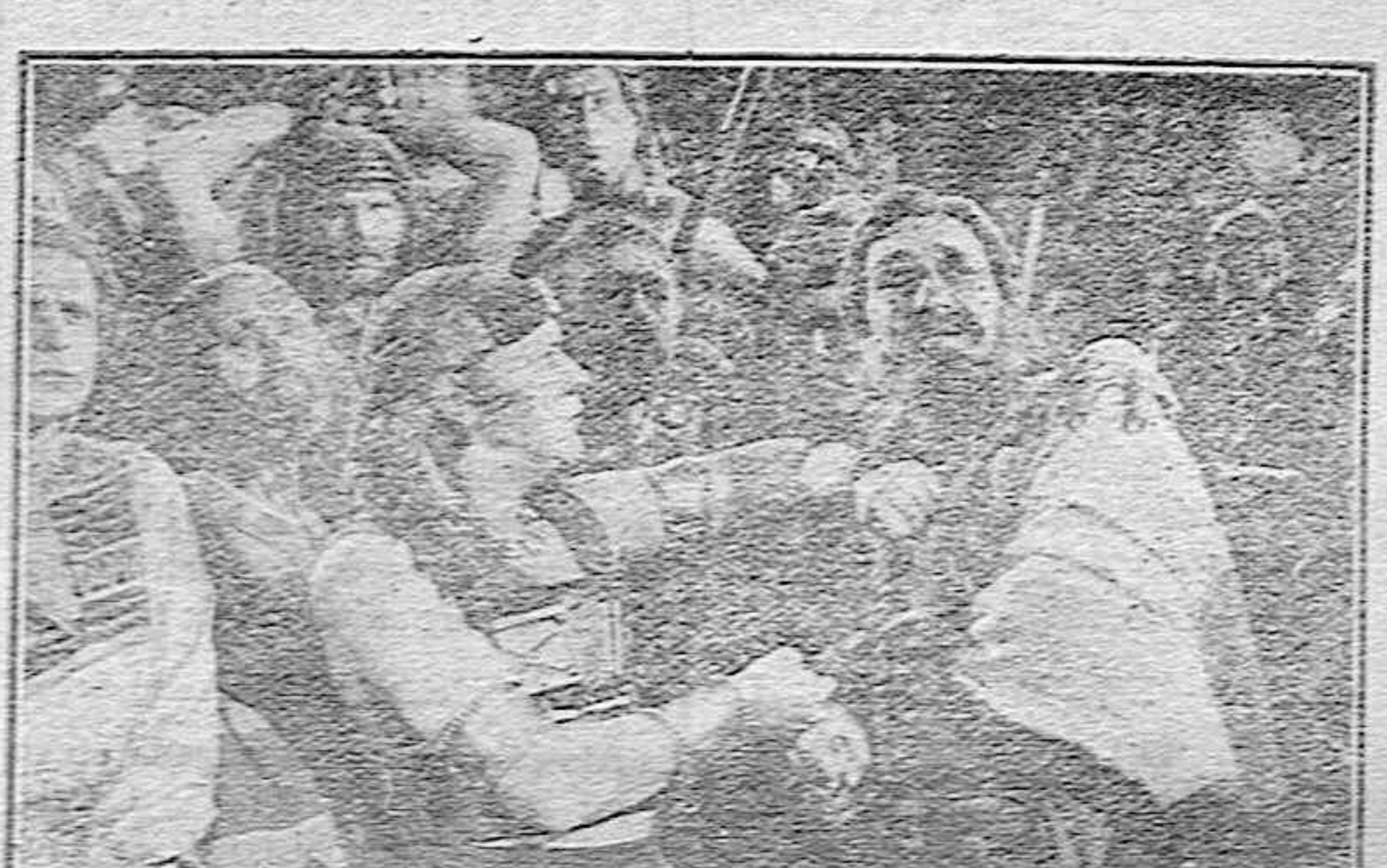
Tres interesantes escenas de la película, REV DE REYES