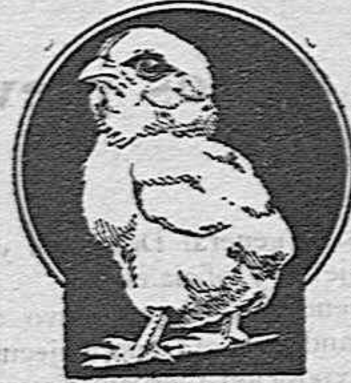
Polluelos de razas puras GRANJA PARAISO Arenas de Mar (Barcelona)