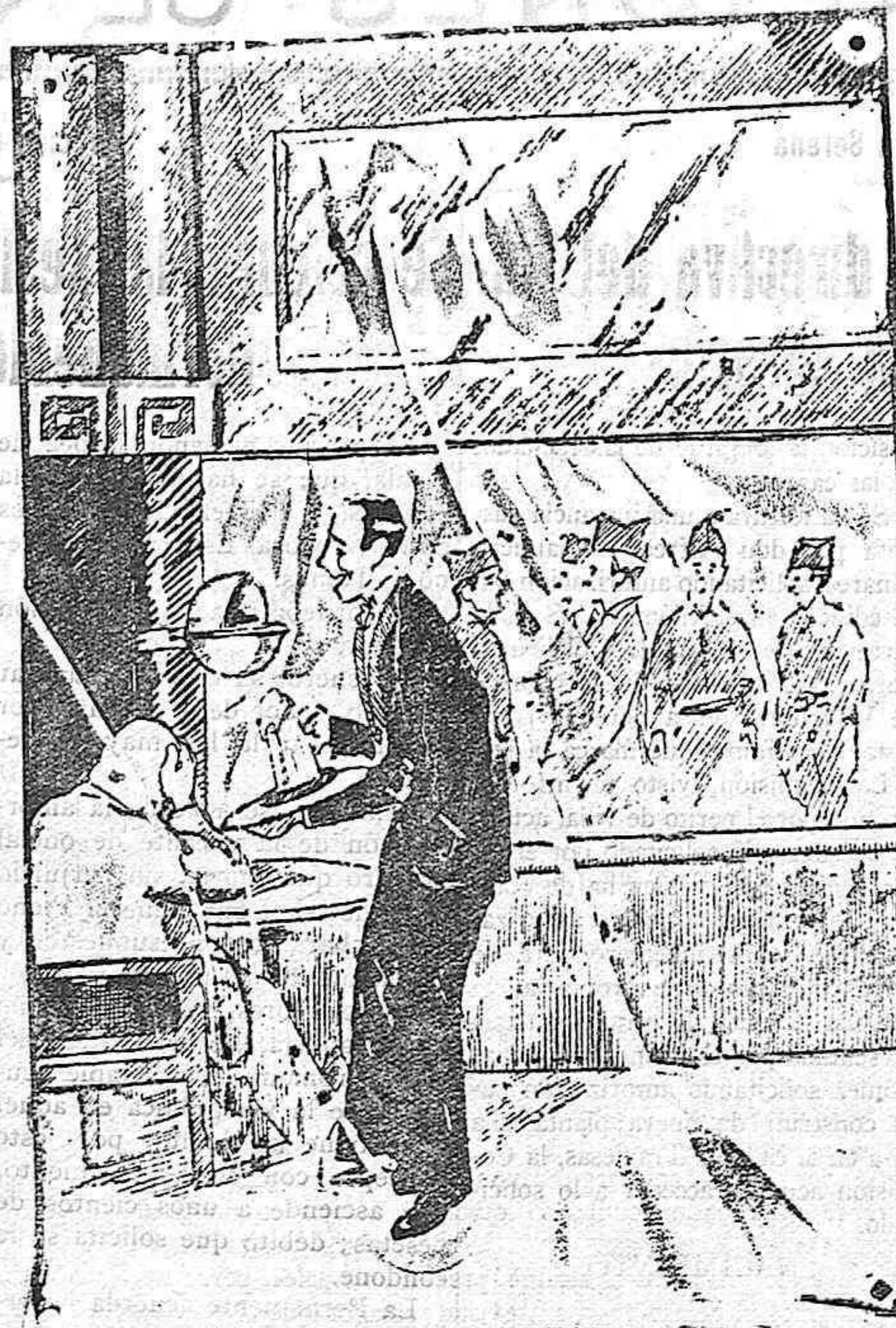
El parroquiano.—Ese tercio está muy sucio. El camarero.—Es que no tiene "la... bandera".