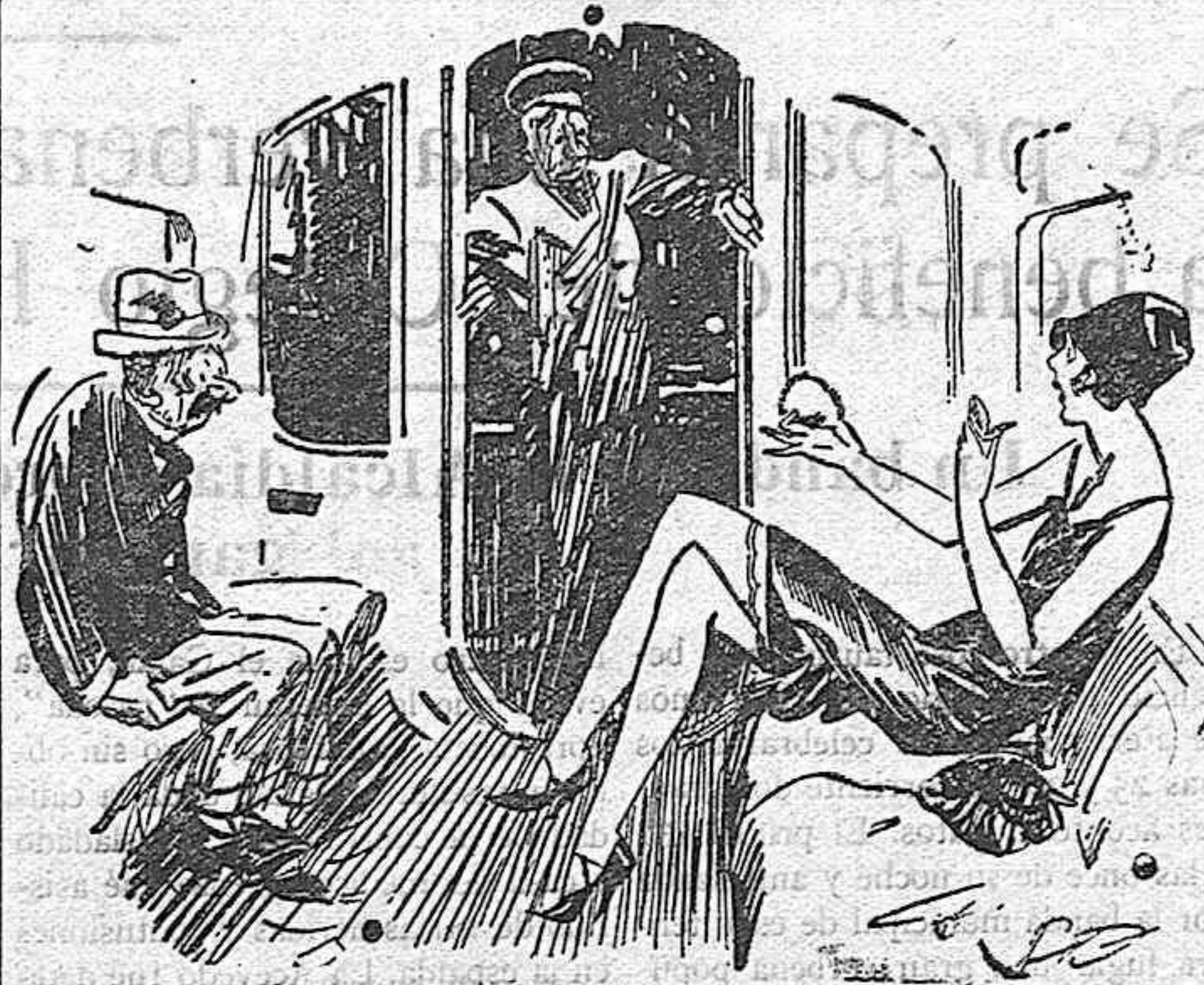
La señorita.—Conductor, haga el favor de llamar a un policía. Este hombre no deja de mirarme.