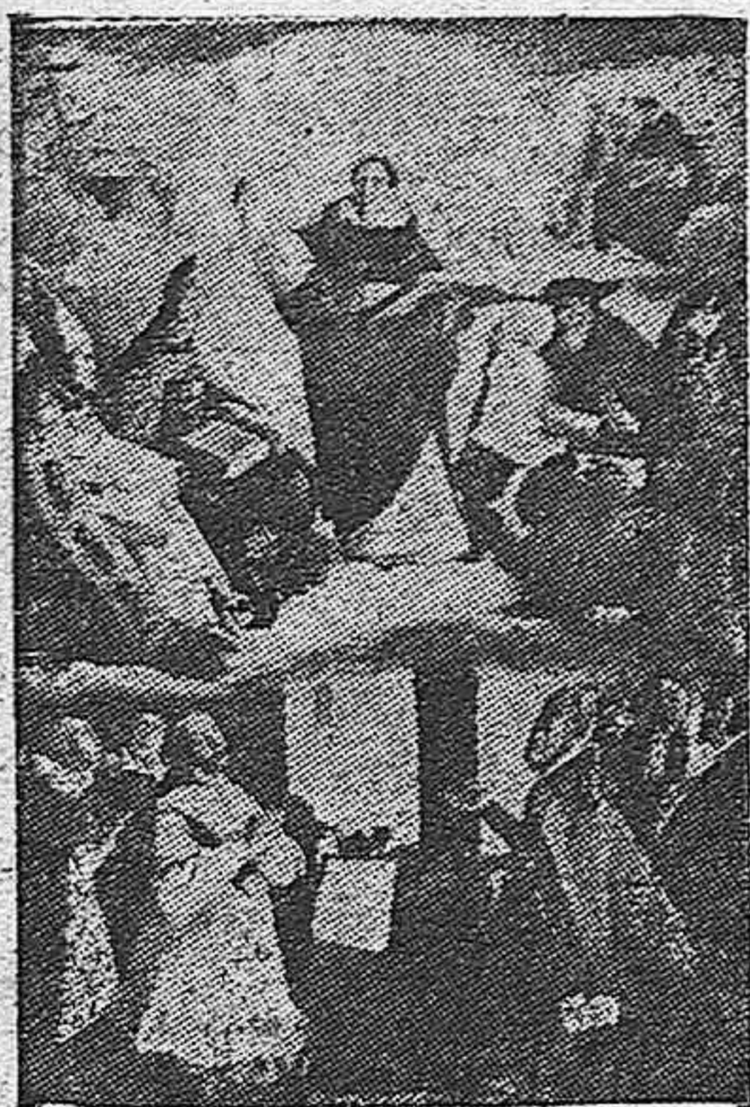
TOMAS DE AQUINO ES PARA NO- SOTROS VOLUNTAD DE CULTURA Y EJE DE CATOLICISMO

en sentido profunda- español. Está encaja- radición y en cami- s de triunfo.