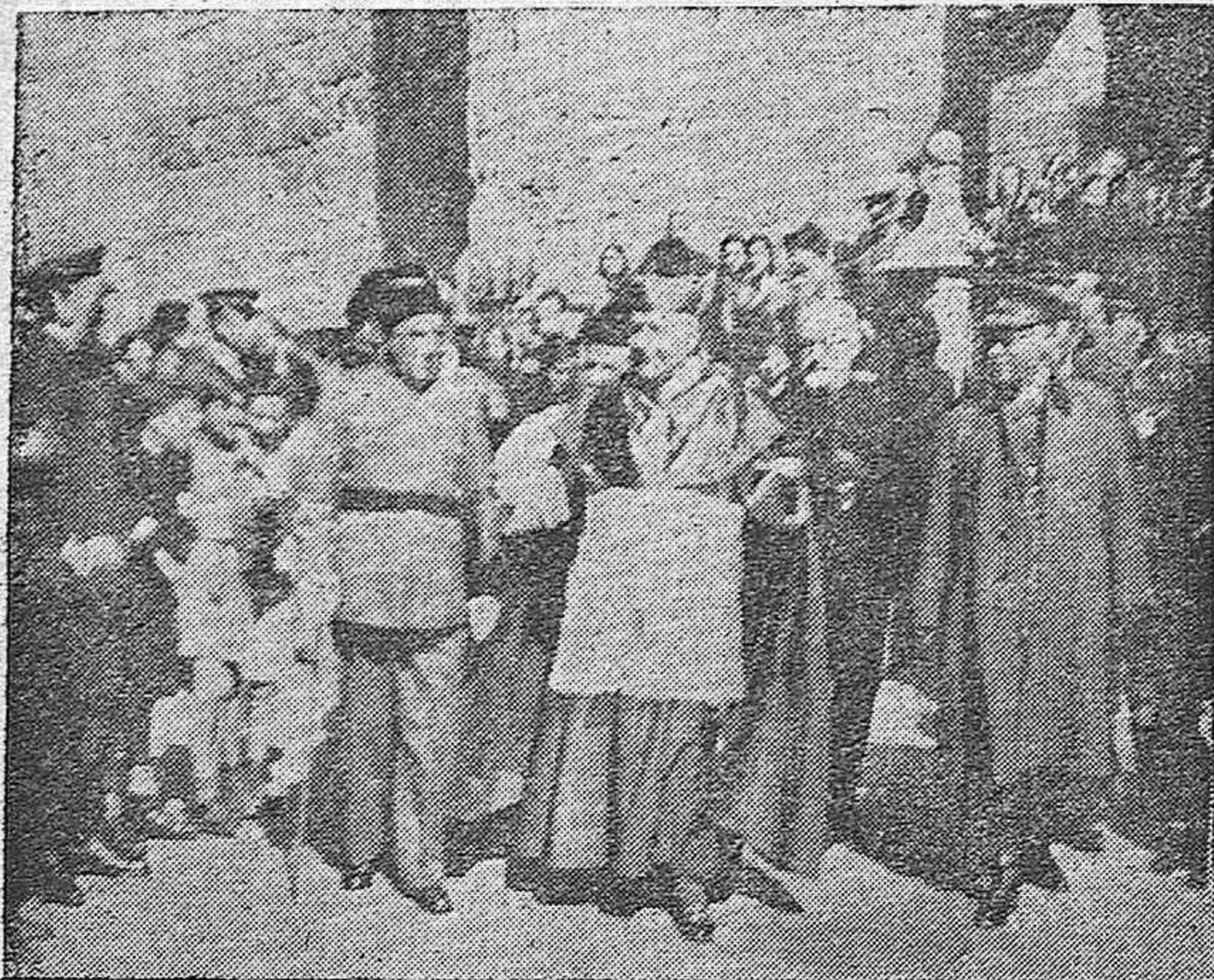
El Excmo. Sr. Obispo de la Diócesis, acompañado de las autoridades locales, al salir del Te-Deum celebrado en la Catedral.