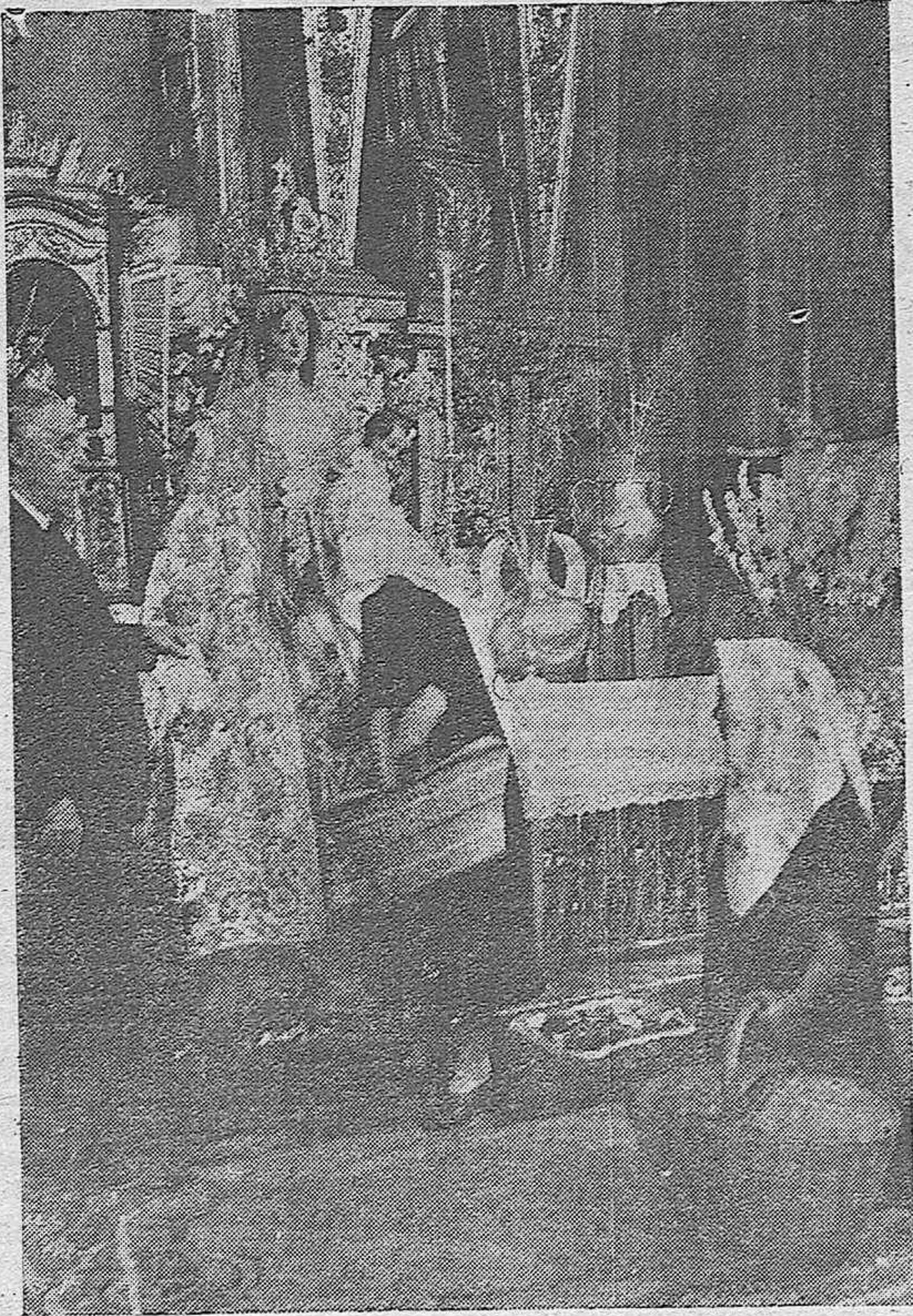
La devoción popular se exteriorizó en el Besamanos de la Santísima Virgen del Socorro. Un momento de la ceremonia.