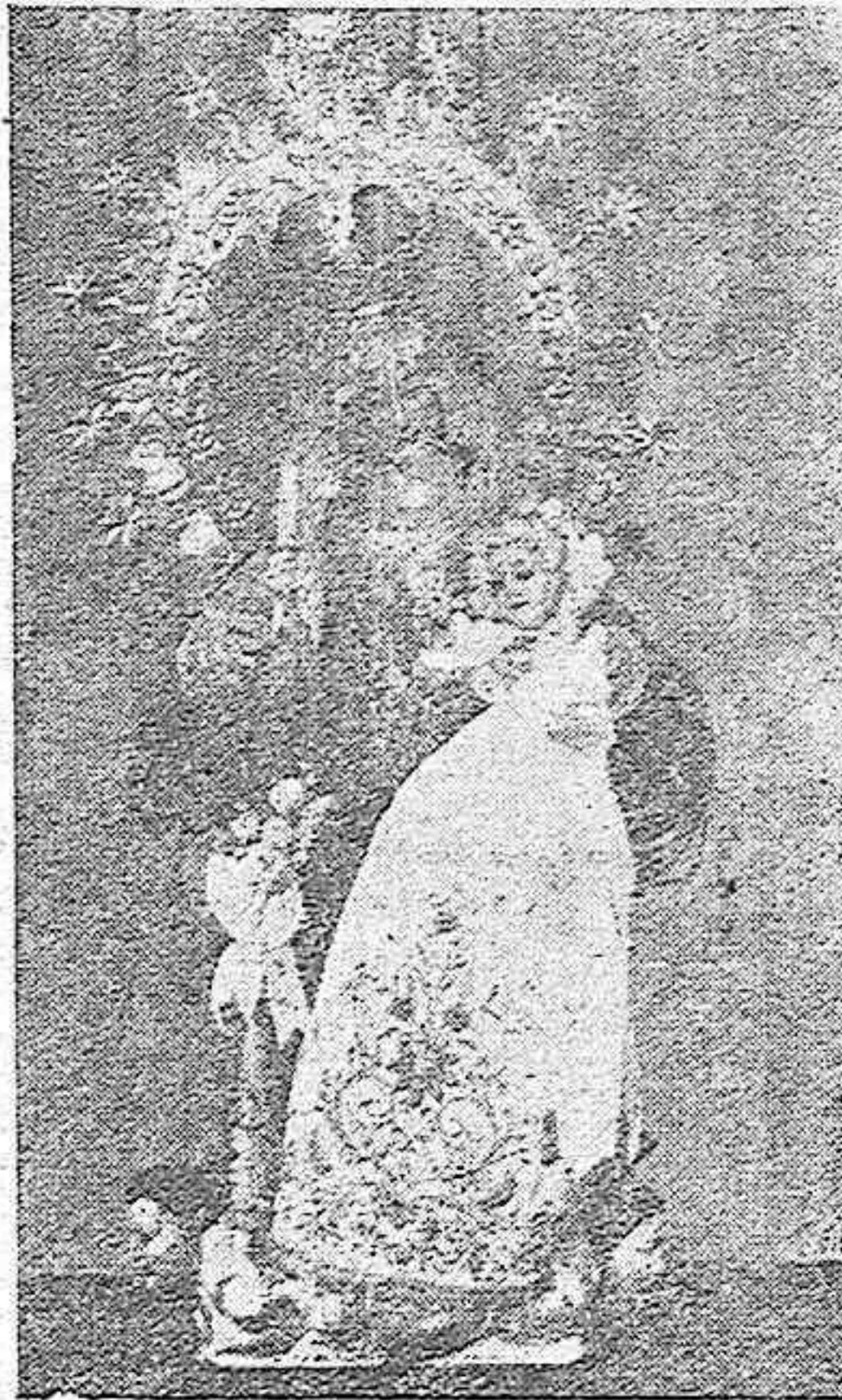
La bella imagen de la Virgen de la Luz, en cuyo honor celebra hoy solemne fiesta y procesión el barrio de Santa Marina.

Merced a tan noble rasgo del Hermano Mayor, que mereció los más calurosos elogios de cuantos le conocieron, la Virgencita de Santa Marina se reintegró a su altar, reanudando, anualmente,