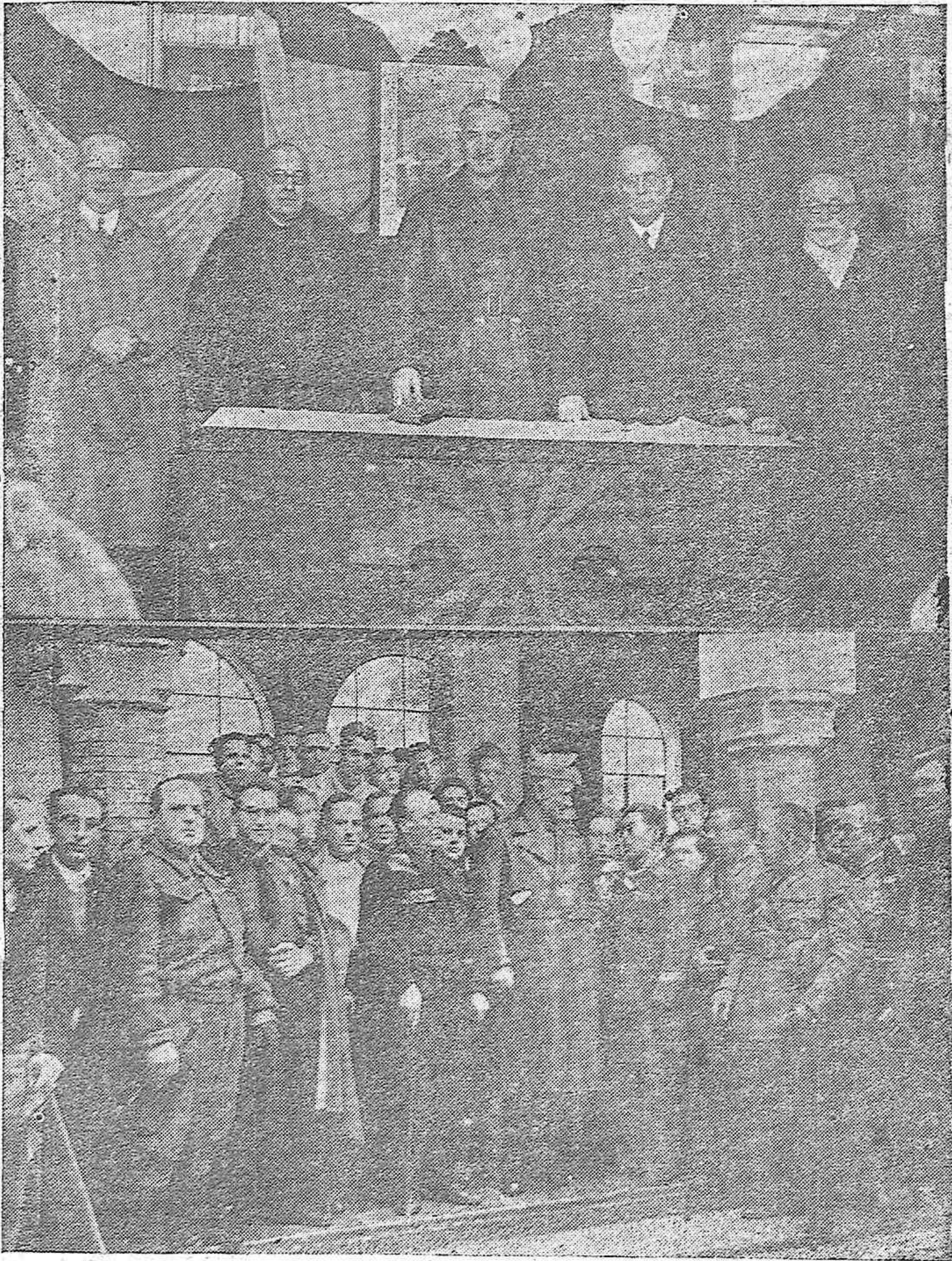
INAUGURACION DE LA ACADEMIA DE CABALLEROS MUTILADOS POR LA PATRIA.-Presidencia del acto celebrado en el Instituto de Córdoba.-El General Queipo de Llano conversando con los mutilados.