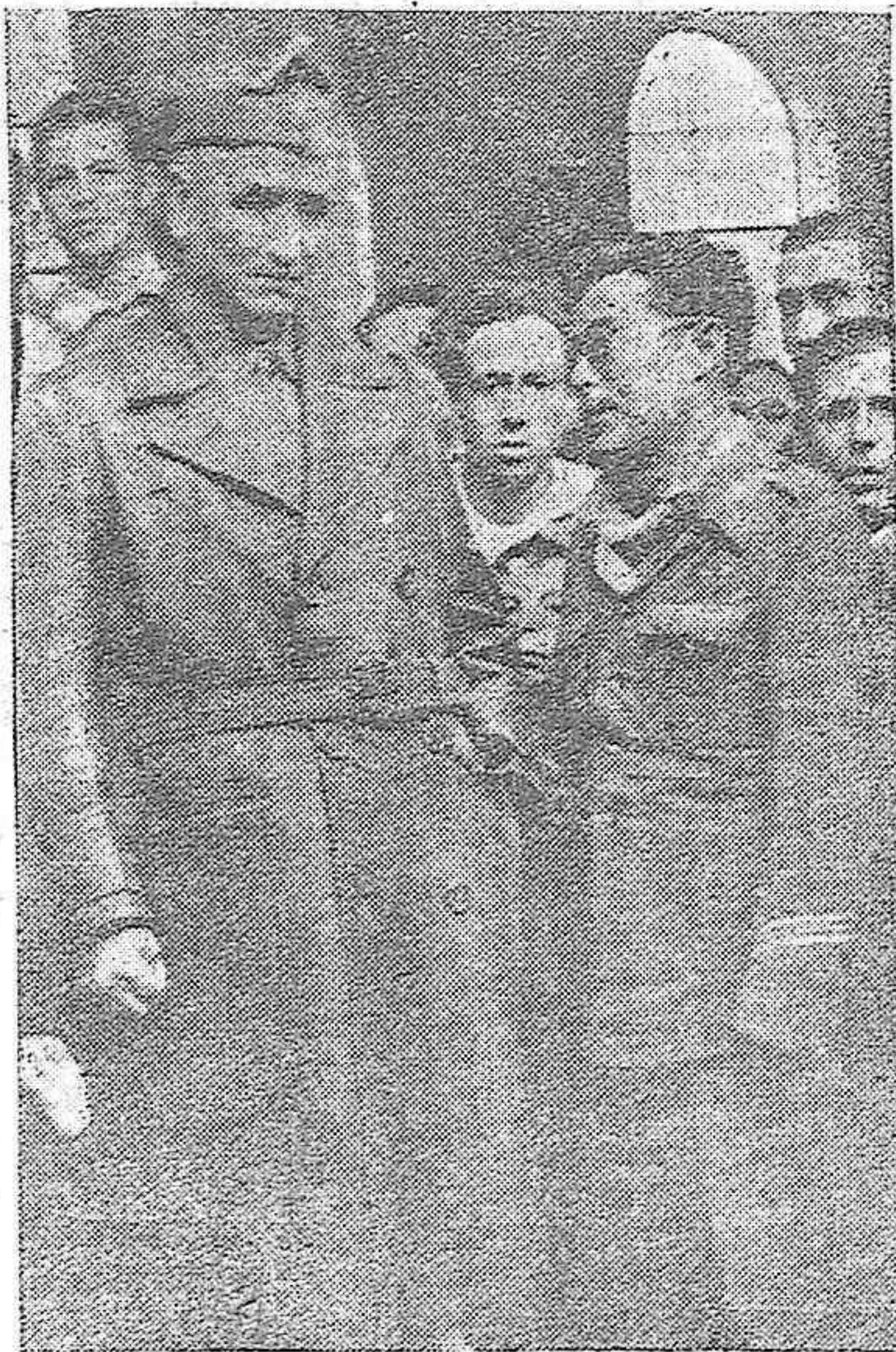
El General Queipo de Llano, en el acto de la inauguración de la Academia de Caballeros Mutilados por la Patria, habló con uno de los heroicos defensores de España, inválido a consecuencia de la guerra.

Por último, el Asesor nacional de Sanidad de las Organizaciones Juveniles, pronunció unas palabras trazando las normas que en materia sanitaria, han de ser base de la labor a desarrollar por las Organizaciones.