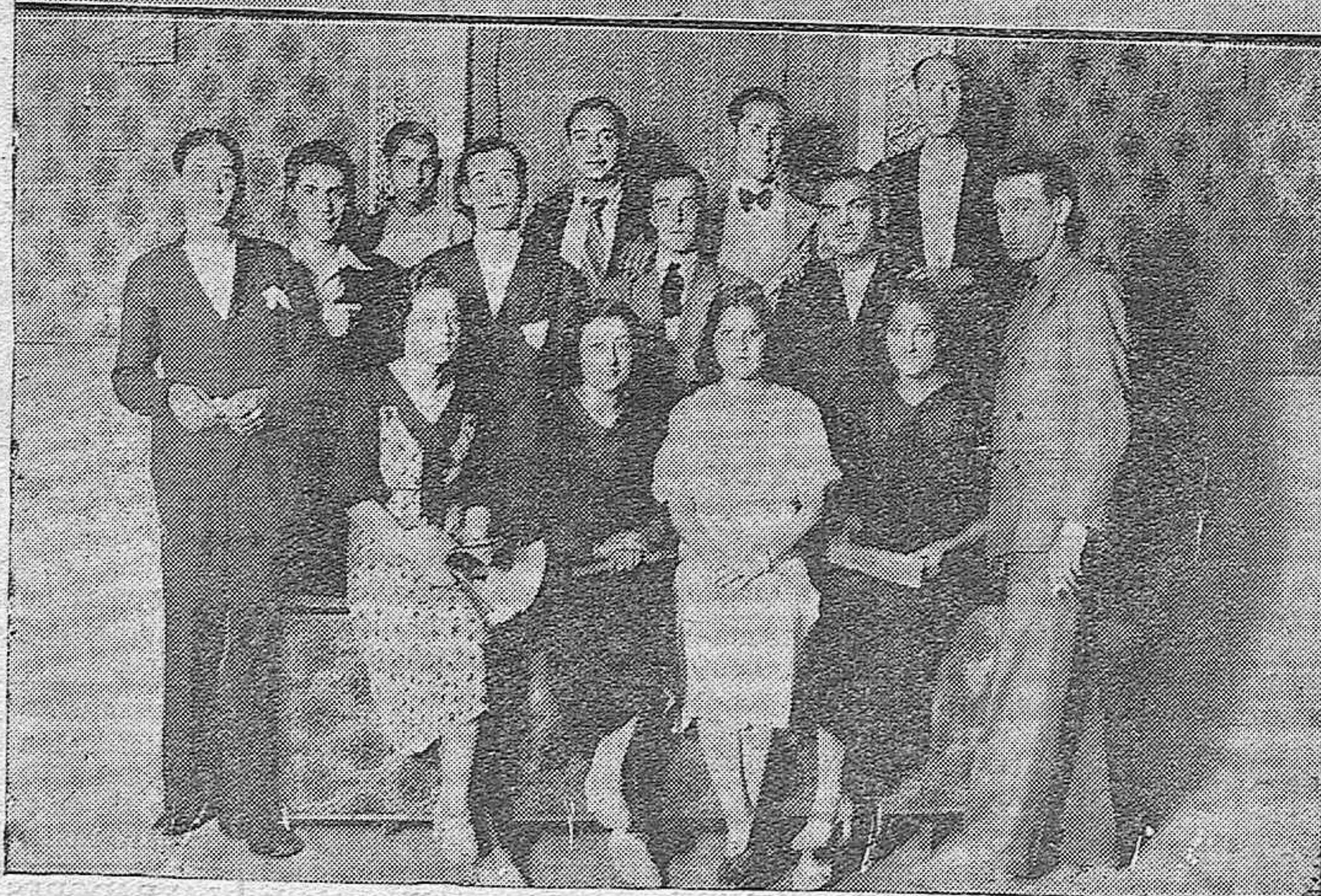
ARRIBA: Los señores que forman la Comisión Gestora de la Diputación Provincial al terminar la última reunión a la que asistieron en pleno.—ABAJO: Algunos de los jóvenes que forman la nueva agrupación teatral, titulada Guerrero Mendoza.