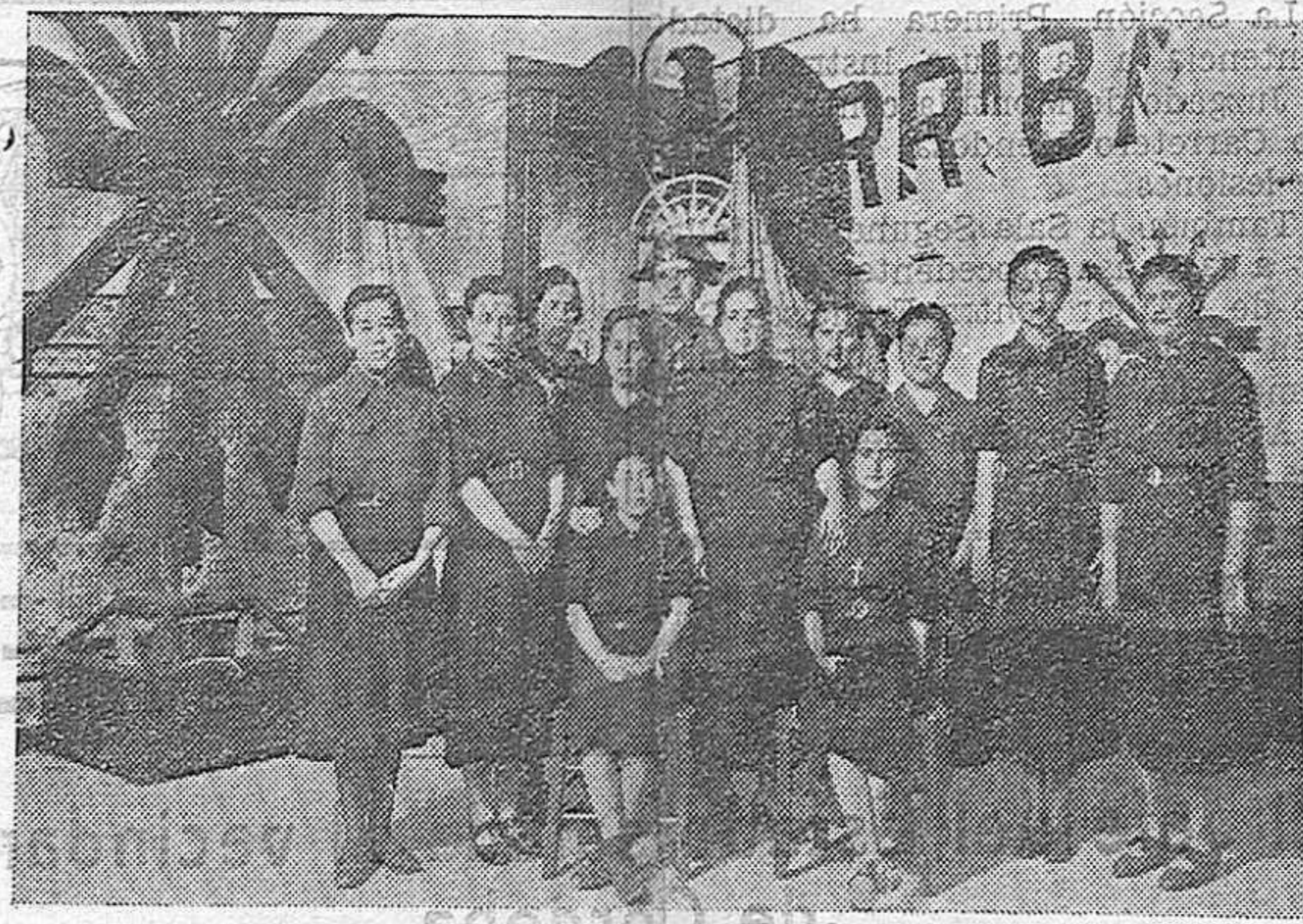
La representación de la Sección Femenina de Falange de La Carlota que llegó a Córdoba, acompañada del Alcalde de dicha población, para entregar un donativo con destino a la "Asistencia a Frentes y Hospitales".