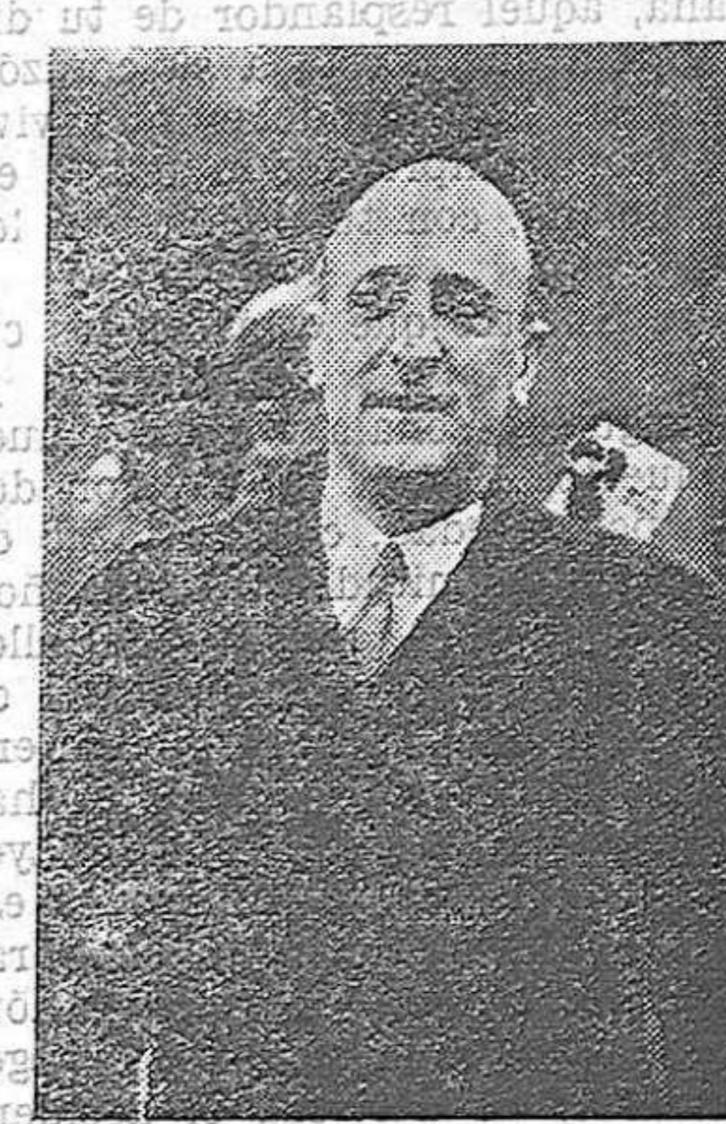
El ministro de Hacienda del primer Gobierno del nuevo Estado español don Andrés Amado.

El Servicio Social se reserva la facultad de contrastar estos certificados con los datos de la Caja de Previsión y otras instituciones, así como acudir a los demás medios de investigación.