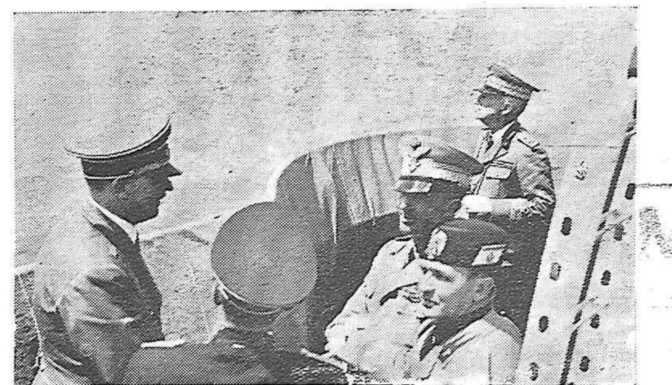
EN LAS MANIOBRAS MAS IMPORTANTES DE LA ARMADA ITALIANA, CELEBRADAS EN EL GOLFO DE NAPOLES, SE REUNIERON EL REY EMPERADOR VICTOR MANUEL III; PRINCIPE HEREDERO HUMBERTO; MINISTRO ALFIERI; MINISTRO VON RIBBENTROP Y EL FUHRER A BORDO DEL "CONTE DI CAVOUR".

Si ves que alguien burla, o intenta burlar el Subsidio Pro-Combatientes, declárale la guerra. Es un enemigo encubierto, que es el peor de los enemigos.