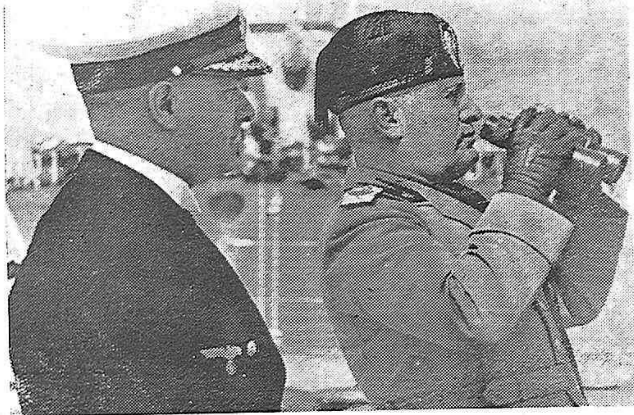
El Duce siguiendo las maniobras de la flota italiana a bordo del "Conte di Cavour"