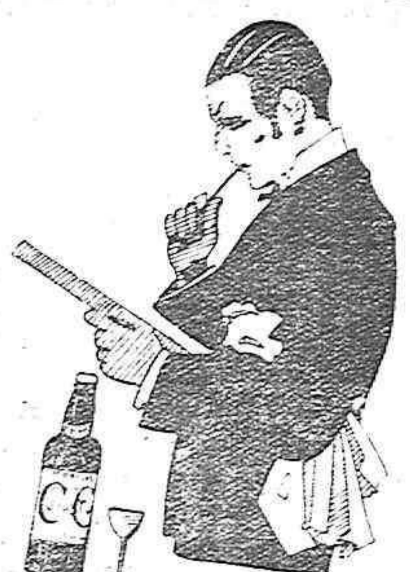
MONTILLA, siempre Cruz Con Le

Lo que para conocimiento general y el más exacto cumplimiento se hace saber por medio de la presente nota.