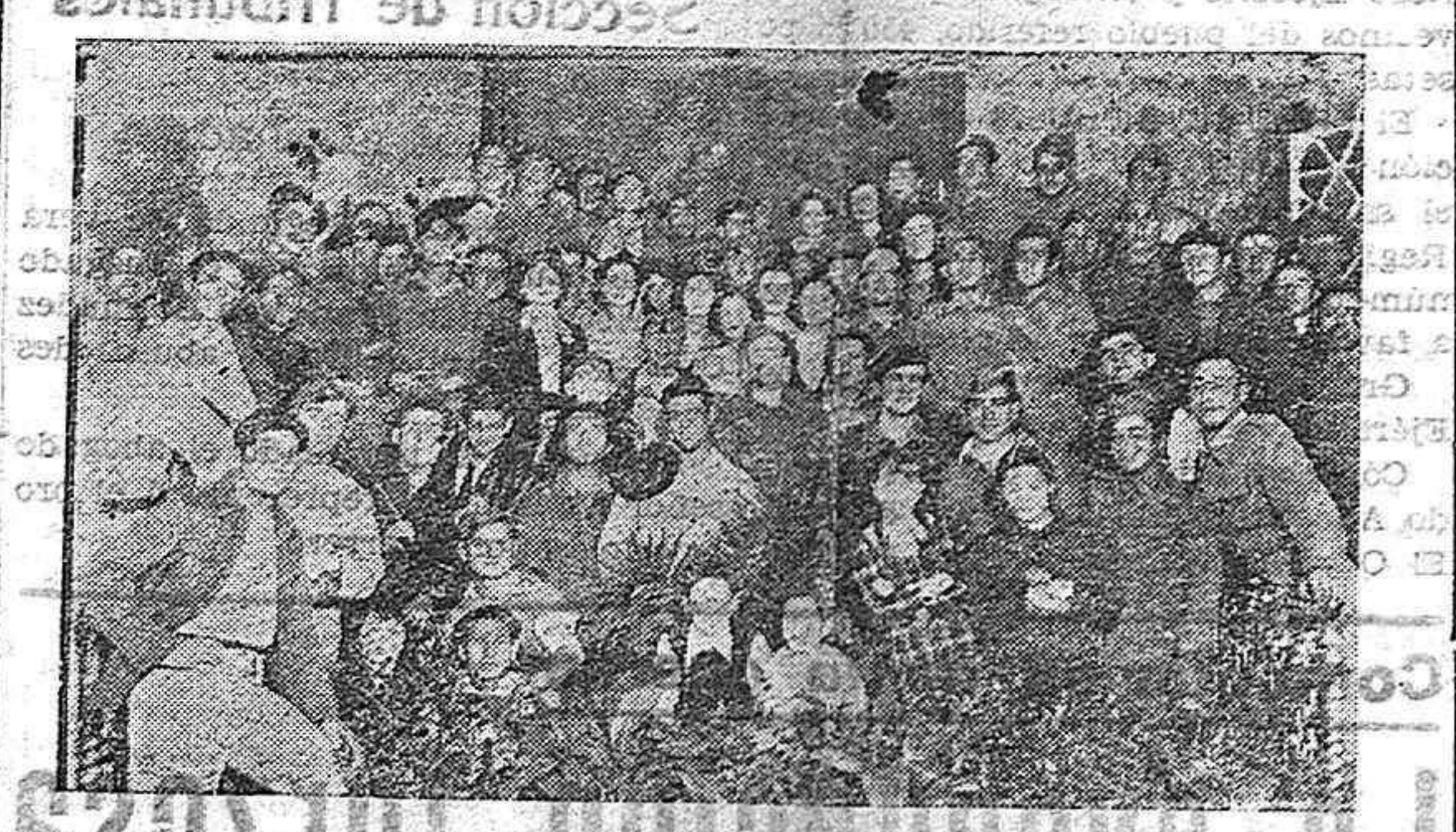
Los alumnos del Conservatorio que tomaron parte en el Concierto, rodeando a los heridos