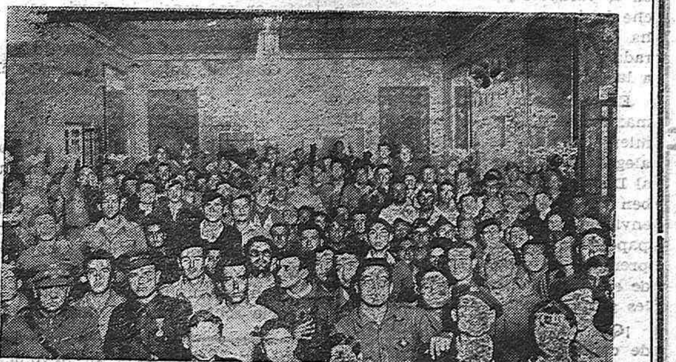
Aspecto del Salón del Conservatorio de Córdoba, durante el Concierto en honor de los heridos