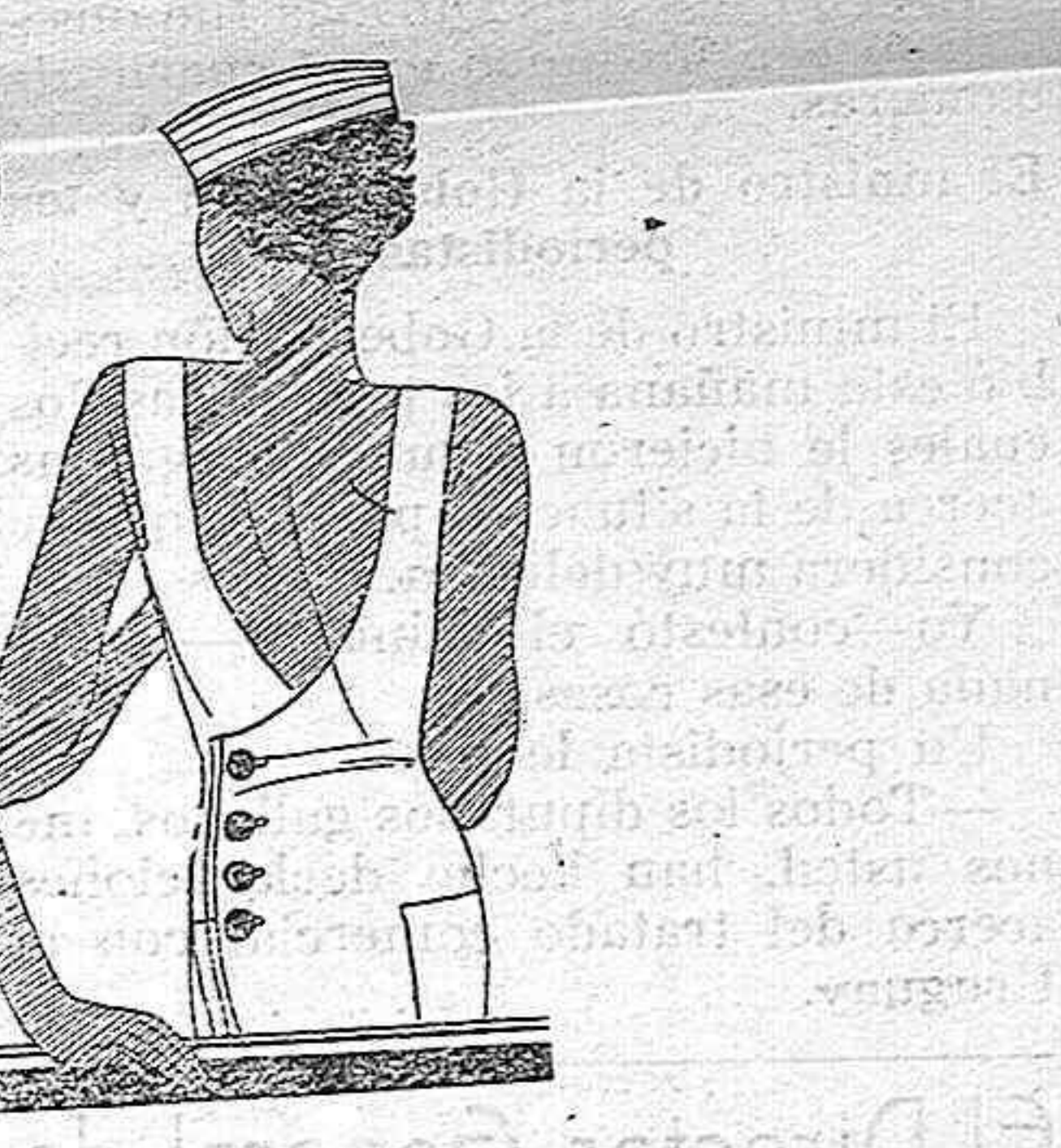
cantos de estas sirenas de tierra adentro.

Esa vela clavada en tierra, ¡debe sentir tanta nostalgia del mar... Es como una desterrada del agua! Y el mástil, con sus jarcias y sus cofas, tiene un gesto de melancolía. Cuando los estaban haciendo, el mástil y la vela también, soñaban con embarcaciones llenas de cantos marineros, con las largas travesías, los puertos amplios y la algarabía de las lenguas diversas y extrañas. Pero una mueca burlesca de la vida, los trajo a los dos a esta playa de tierra adentro, y seguramente, en las noches castellanas, cálidas, pesadas, el mástil y la vela se dicen la tristeza de su fracaso inicial.