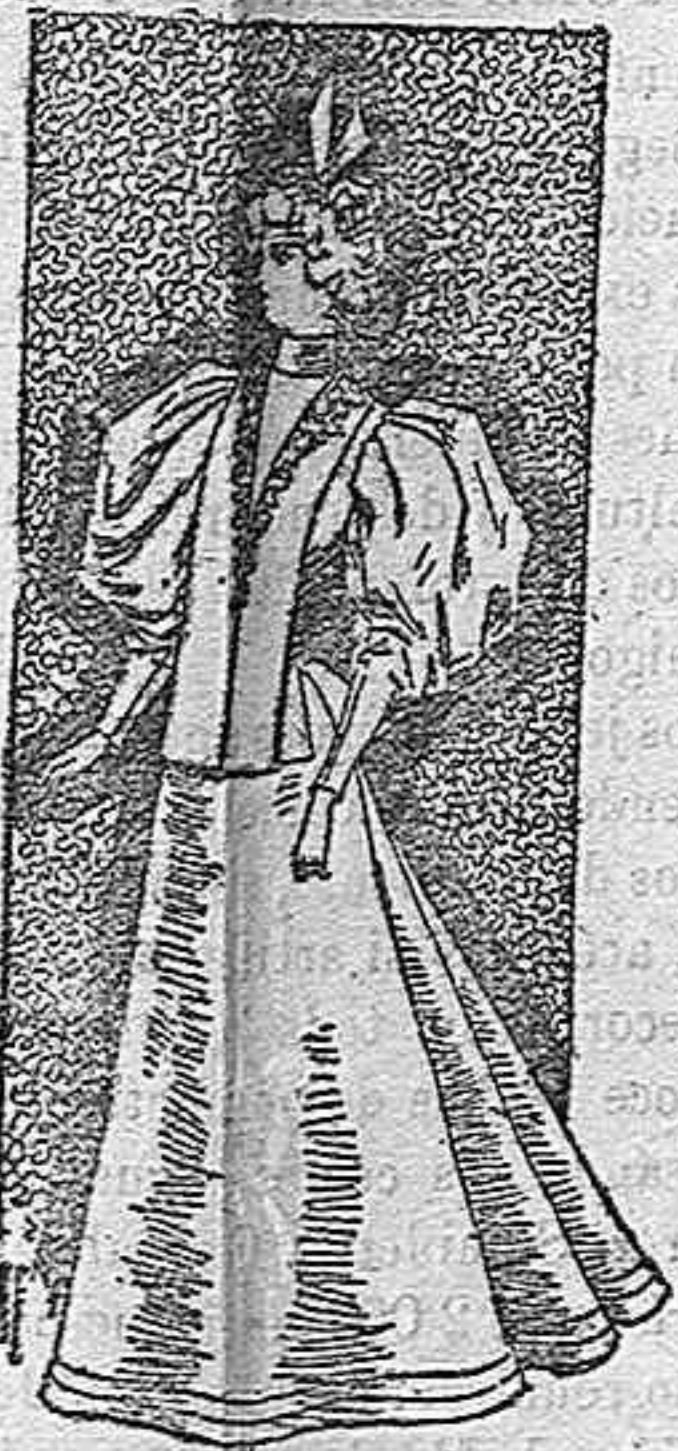
Traje de entretiempo, para paseo.

De seda adamsada, forma princesa; el cuerpo es entallado abierto en el delantero sobre un plastrón de muselina de seda abullonada, y un gran lazo de cinta de raso hasta el borde de la falda; el cuello es alto y ovalado; mangas cortas, forma bullon, recogidas con una cinta.