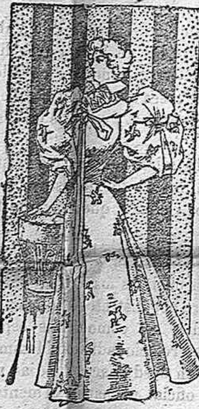
Traje para casa.

Modelos exclusivos para nuestras lectoras, de los grandes almacenes de «El Siglo», Barcelona. (1)