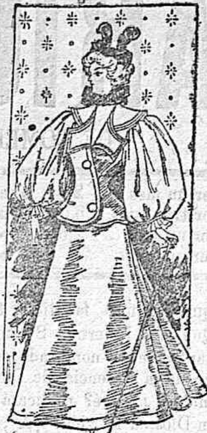
Traje para calle.

(1) Las señoras que deseen detalles respecto de los modelos de esta revista pueden dirigirse a la «Sección de confecciones» de estos almacenes y recibirán gratuitamente inmediata contestación.