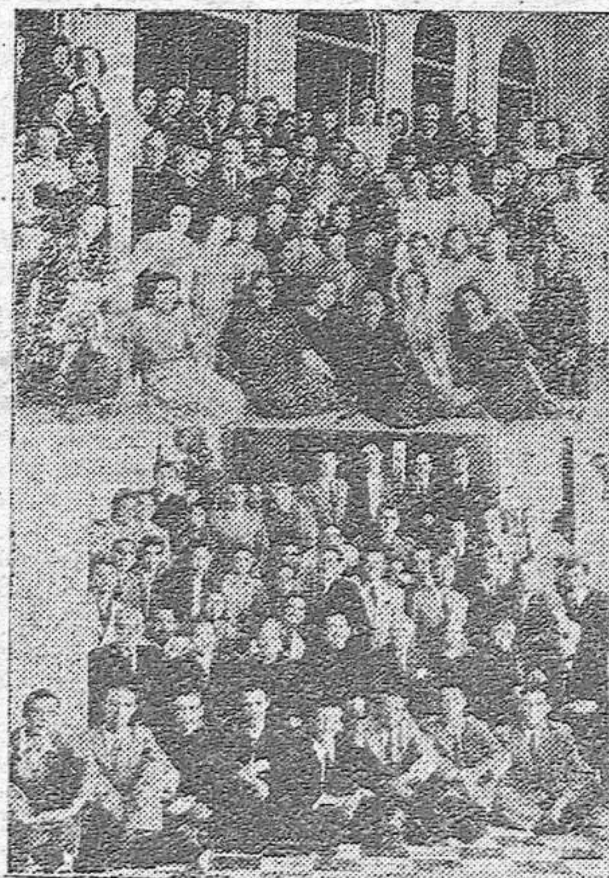
Las alumnas y alumnos de la Escuela Normal de Córdoba que han terminado su carrera en el presente curso. Les acompañan en la fotografía sus profesores.

En un plano de igualdad y dentro de un ambiente cordial se está llevando a cabo sencillamente en las conversaciones de Salzburgo nada menos que la organización de una parte de Europa, bajo bases más justas en lo político, en lo económico y en lo social, habiéndose llegado a un perfecto entendimiento entre los negociadores alemanes, italianos, rumanos, búlgaros y yugoeslavos.