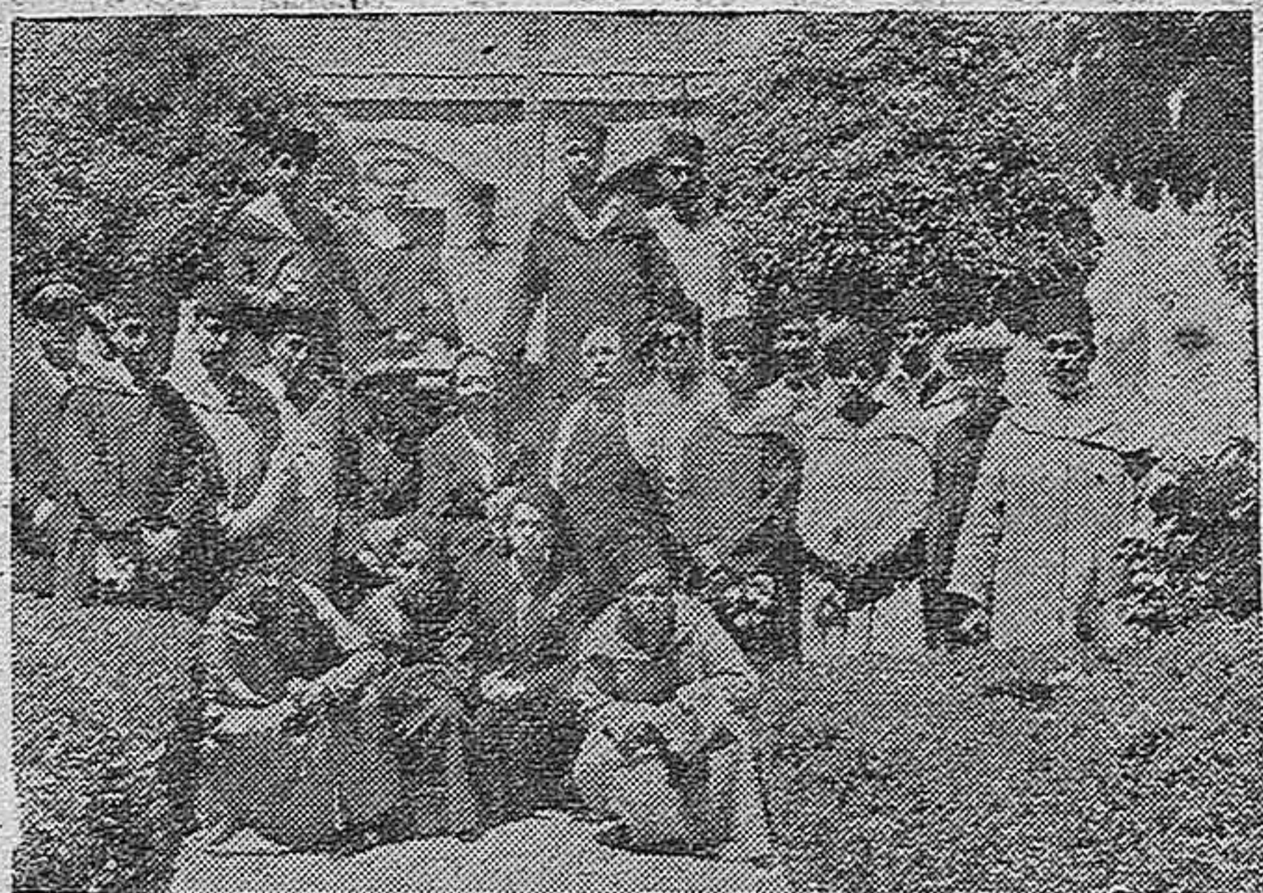
Profesores y maestros de los centros culturales de Marruecos que se encuentran en Granada practicando cursillos. Los excursionistas durante su visita de anteaer al Museo Romero de Torres