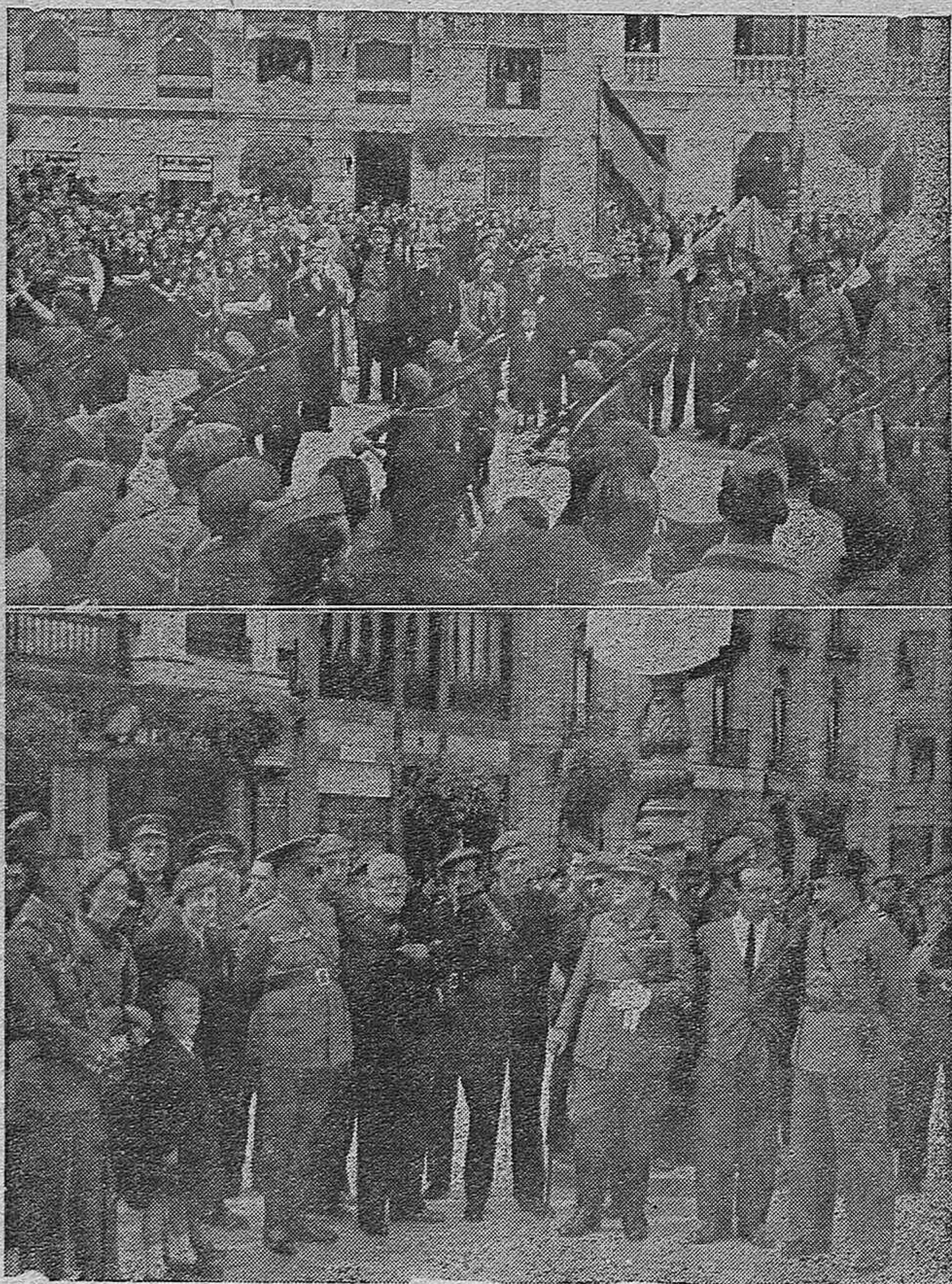
ARRIBA.—Pelayos, flechas y cadetes, desfilando ante las autoridades civiles, militares y del Movimiento, con motivo de la Concentración para conmemorar el Dos de Mayo de 1808.—ABAJO: Las autoridades que asistieron al acto, presenciando el desfile.