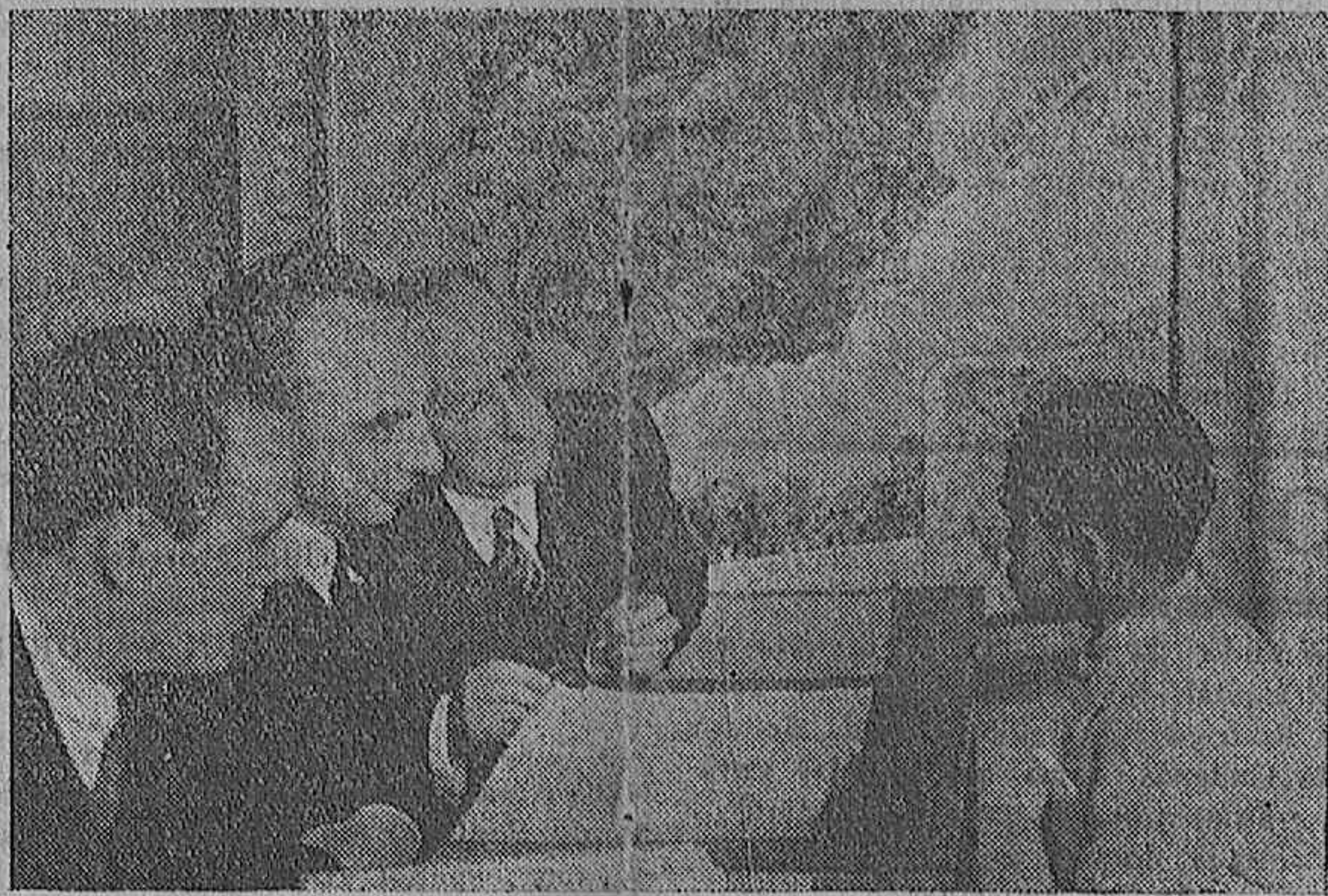
MADRID.—En el Instituto Ramiro de Maeztu se ha examinado, brillantemente, de ingreso en el Bachillerato, el hijo de S. A. el Jefe.—He aquí un momento del examen ante el tribunal.

El ministro estuvo luego inaugurando el puente del Caudillo tendido sobre el río Ter en el mismo sitio en que existía el que fué volado por los rojos. El puente ha sido reconstruido en 130 días y se ha gastado en la obra 400.000 pesetas.