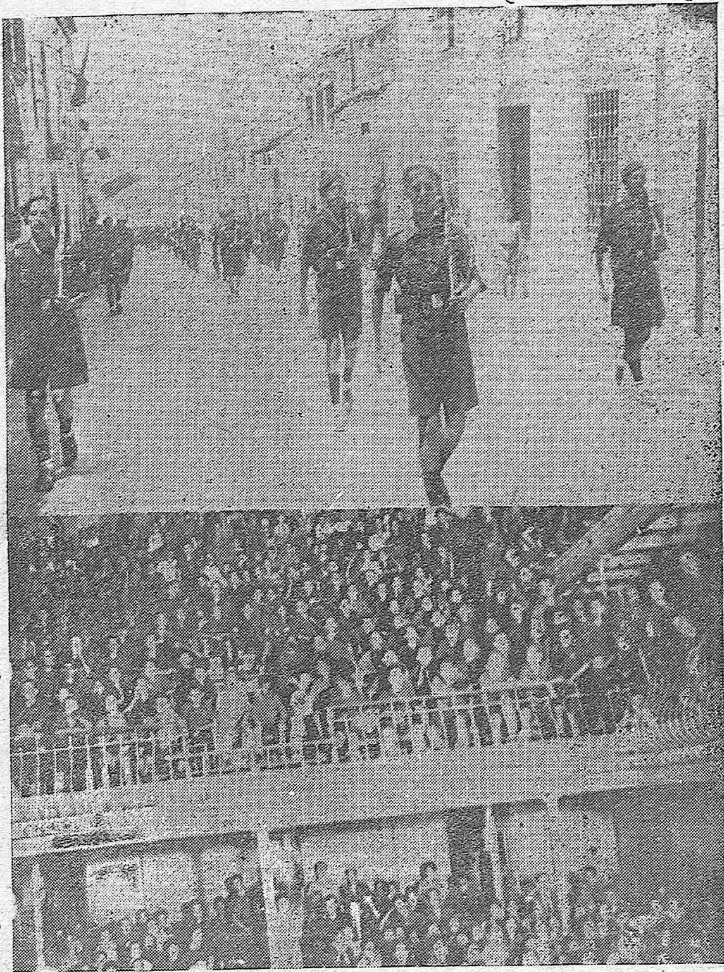
LA «CENTURIA JOSE ANTONIO» EN VILLANUEVA DE CORDOBA.—La Centuria desfilando por las calles del pueblo.—Aspecto del Teatro durante el acto celebrado en el mismo.