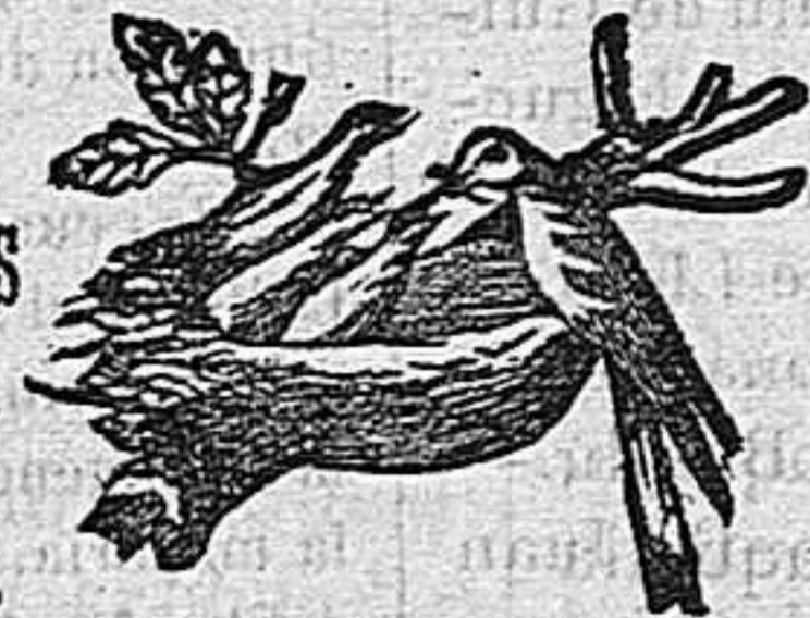
(Marca de garantía.)