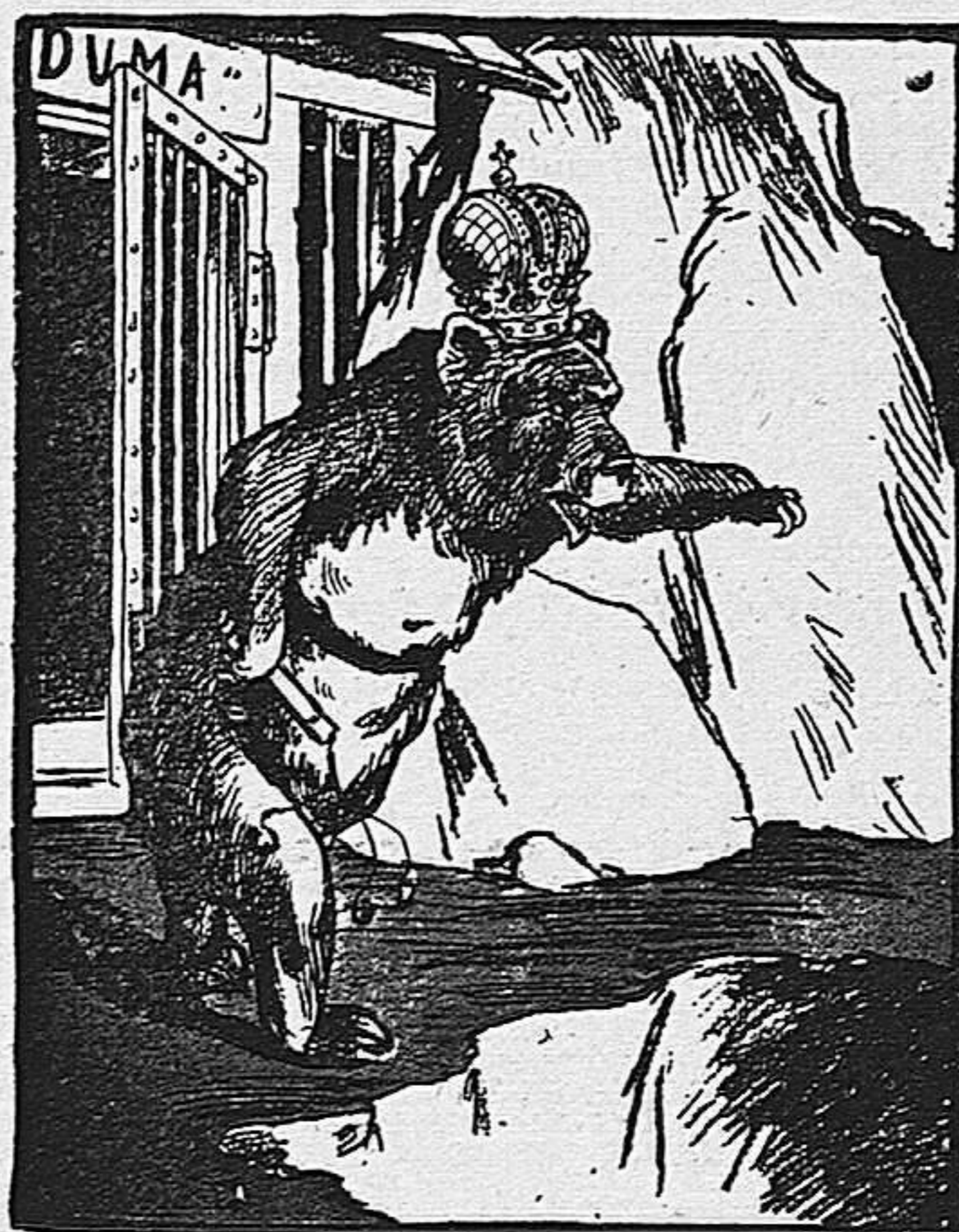
El oso habiendo salido de su guarida, no ve el abismo donde va á caer.

La fatal resolución del Zar disolviendo la primera Duma, conmovió á toda la Rusia y aumentó los partidarios de la revolución sangrienta y los afiliados á los terroristas. Mientras duró la Duma no se registraron atentados; pero ahora, por todas partes se vé la influencia terrorista. El atentado contra Stolypine; la muerte del general Minn, la del gobernador de Varsovia, la del cruel Trepoff, que, según afirma la prensa, fué envenenado, son pruebas de la acción de los comités terroristas, los cuales no cesarán hasta llegar al