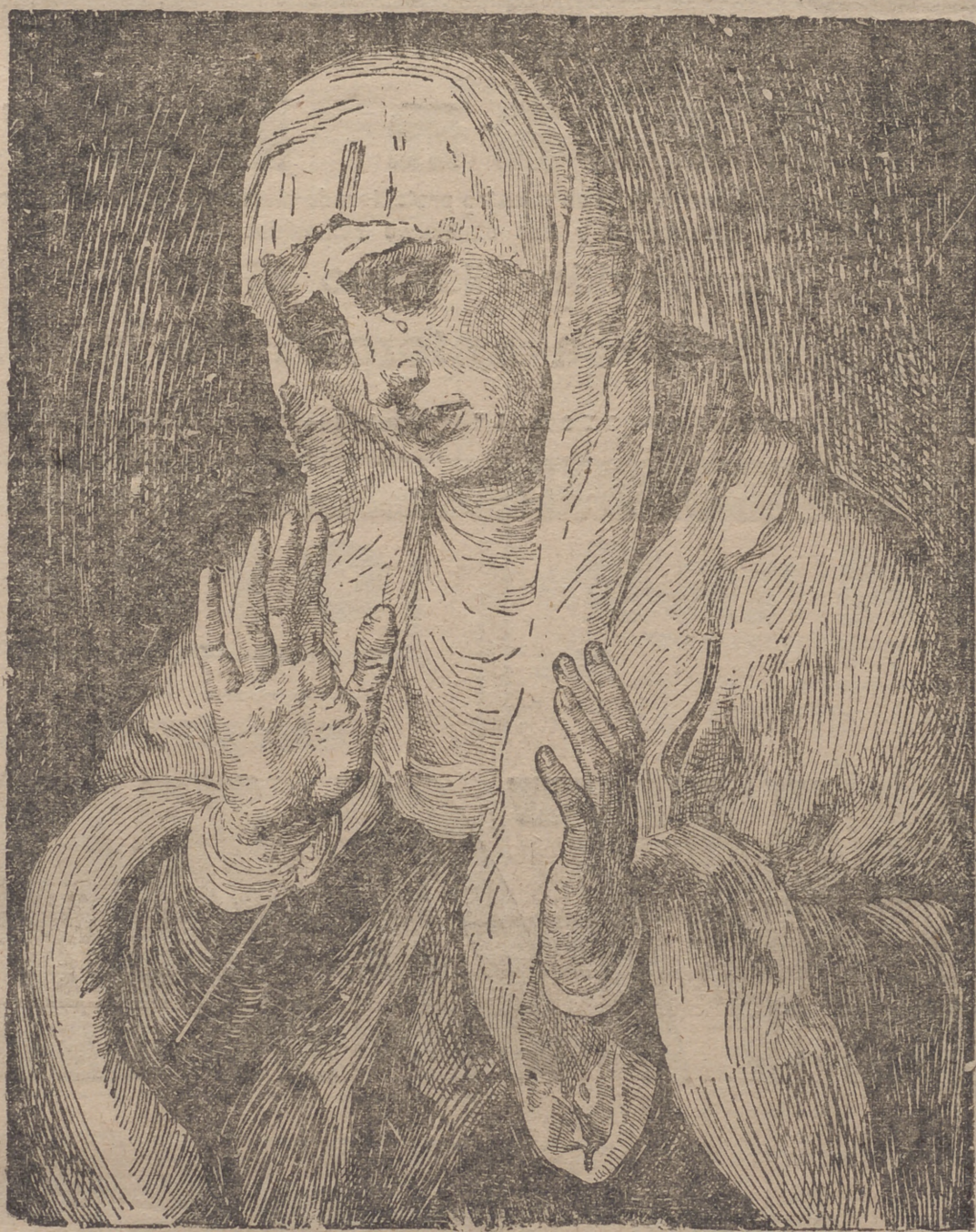
Imagen del dolor divino es el de esta efigie de nuestra Señora que, Madre, sobre todo, refleja en las puras líneas de su faz las sombras tragedias que, por la redención del género humano, afrontó el sublime Mártir del Gólgota.