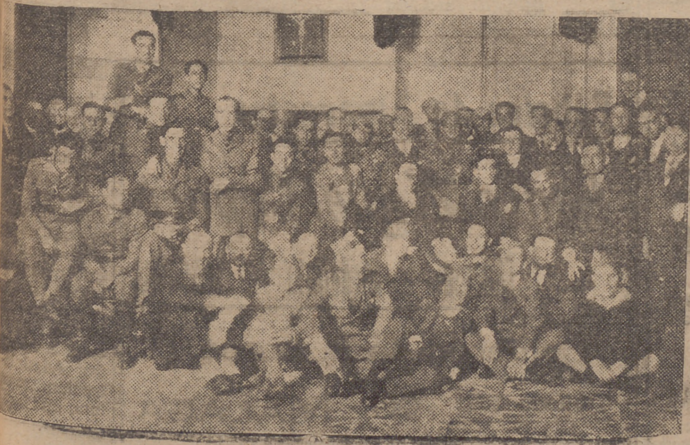
En el magnífico edificio de "La Unión Mercantil" fueron obsequiados con un vino de honor los jefes y oficiales de la Legión llegados a Málaga para escoltar al Cristo de Mena