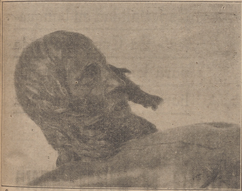
Nuestro Padre Jesús de la Buena Muerte y Animas—vulgo, Mena—, que desapareció la noche del 11 de Mayo de 1931