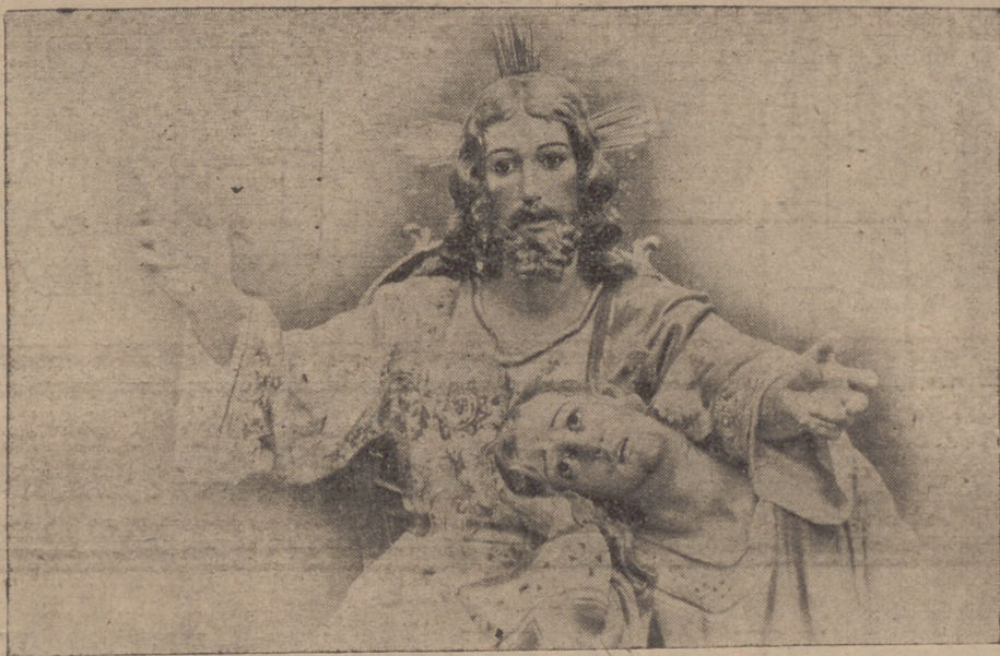
Nuestro Padre Jesús presidiendo la Sagrada Cena

refiriéndose él literalmente a cosa muy distinta profirió la sentencia: