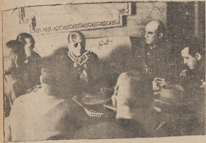
El ilustre general conversando con las autoridades