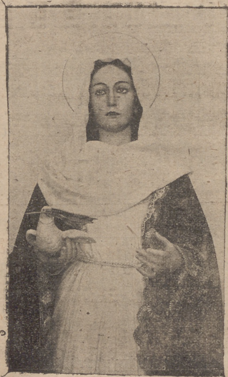
Maria Santísima de la Paz, de la Cofradía de la Cena, que saldrá procesionalmente el año próximo, no haciéndolo en el actual por no haberse terminado el trono que la Hermandad le encargó.

nes que ocupaban un sitio en las filas a precio de jornal. Los únicos y verdaderos penitentes quedaban reducidos al acompañamiento de la Virgen de los Sevillas, por lo que ésta procesión se distinguía extraordinariamente de las demás. No ya en el año de los petardos, o sea en el fuero de la campaña antirreligiosa de nuestro jacobinismo, pero cuando ya se trabajaba por deslustrar nuestras procesiones, un cierto género de penitentes, perdían la compostura o arrojaba el cirio a la primera señal de alarma, aunque ésta careciese de fundamento.