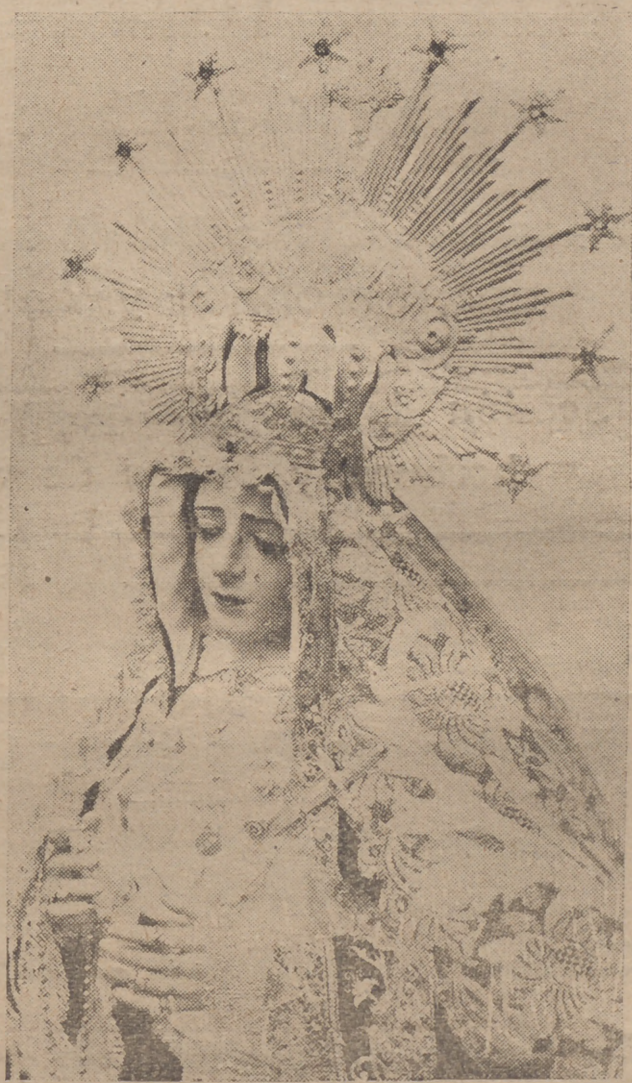
Maria Santísima de los Dolores, perteneciente a la popular Cofradía de la Expiración, una de las pocas imágenes de nuestra Semana Santa que fueron salvadas de la furia republicana el 11 de Mayo de 1931, y de las hordas soviéticas después, durante los siete meses rojos en nuestra ciudad.

Si las circunstancias del momento no son favorables a desplazar los grandes núcleos de viajeros que acudían a Málaga desde todas las naciones de Europa, el hecho de restablecerse la tradición, el andar de las Cofradías y el prestigio de nuestras procesiones, conseguirán en cuanto los tiempos sean propicios, restablecer también la gran corriente universal que se reunía aquí por Semana Santa. Será la hora del equilibrio inevitable y la del premio discernido por el mundo al afán infinito de nuestras Cofradías.