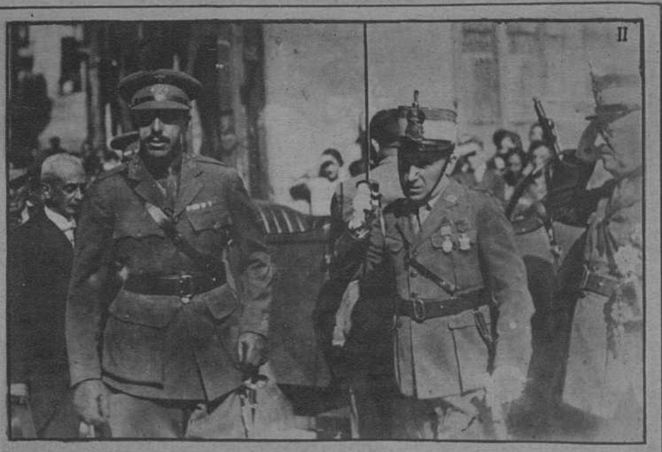
El viaje de D. Alfonso a Manresa. I: S.M. el Rey saliendo de visitar las obras del Grupo Escolar. II: D. Alfonso presenciando el desfile de las tropas