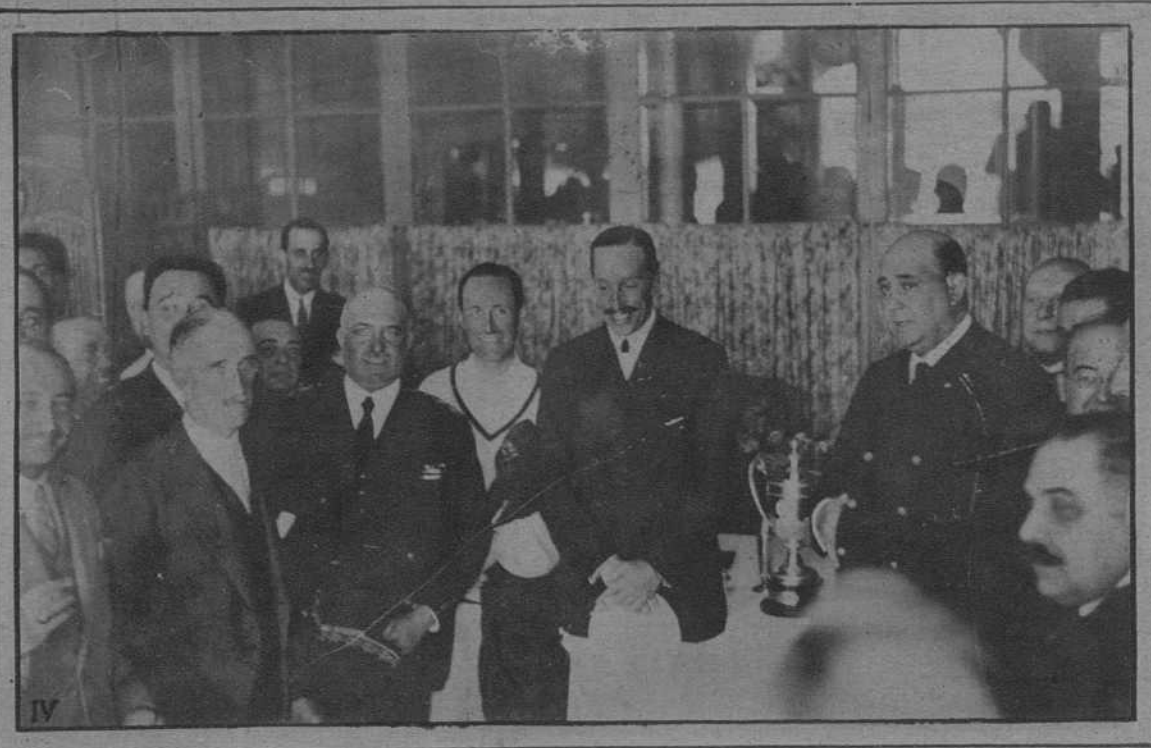
Barcelona.-Regatas de balandros en el antepuerto con asistencia de S.M. el Rey. I: S.M. el Rey al llegar al Club de Regatas. II: El balandro de S.M. el Rey (x) en plena regata. III: El Jurado. en: IV: Reparto de premios de la regata, en la cual salió vencedor S.M. el Rey.